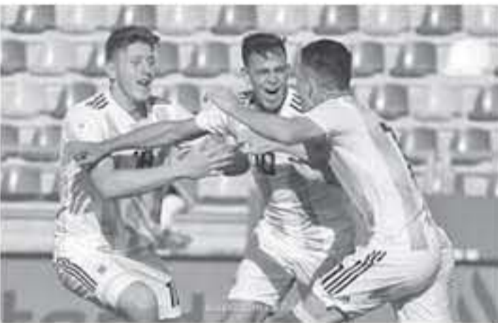
الأنباط - وكالات

٢٠ عاماً، يتضمن بندا يسمح بشراء اللاعب في نهاية الموسم المقبل نظير ١٥ مليون يورو. ويجيد ماروني اللعب في مركز لاعب الوسط المهاجم وأيضاً مركز الجناح، وشارك ماروني مؤخرًا مع المنتخب الأرجنتيني في كأس العالم للشباب تحت ٢٠ عاماً.