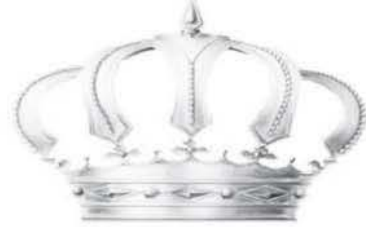
الانباط - عمان

صدرت الإرادة الملكية السامية أمس بدعوة مجلس الأمة إلى الاجتماع في دورة استثنائية اعتباراً من يوم الأحد ٢١ تموز ٢٠١٩ من أجل إقرار الأمور التالية: