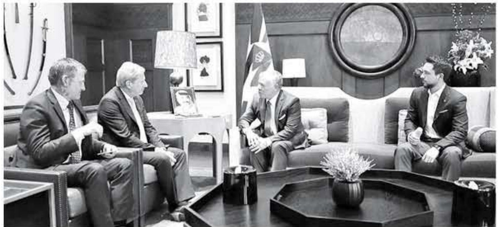
الانباط - عمان

التقى جلالة الملك عبدالله الثاني وسمو الأمير الحسين بن عبدالله الثاني، ولي العهد في قصر الحسينية أمس، مفوض سياسة الجوار الأوروبية ومفاوضات التوسع في الاتحاد الأوروبي يوهانس هان، الذي يزور الأردن على رأس وفد اقتصادي رفيع المستوى يمثل