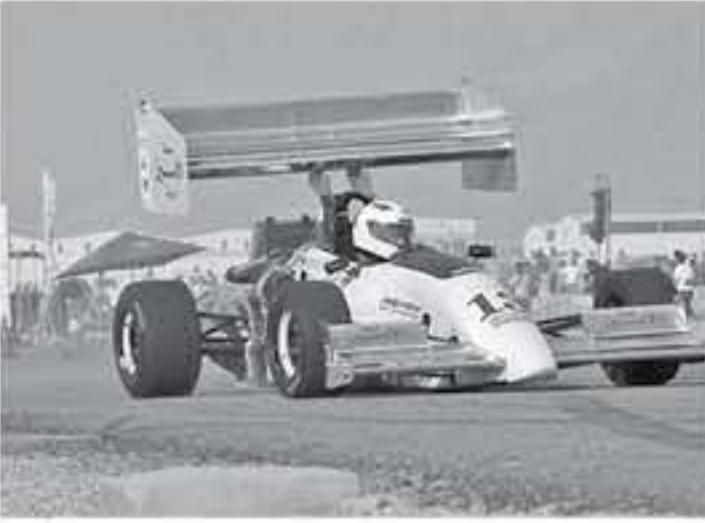
الأنباط - عمان

سباق الحسين تخليداً لذكرى جلالة المغفور له الملك الحسين بن طلال طيب الله ثراه، وكان أول سباقات تل الرمان المطلق العام ١٩٥٣، وذلك عندما افتتح جلالة المغفور له الملك الحسين بن طلال طيب الله ثراه حلبة تل الرمان، كما شارك كمتسابق في هذا السباق، واستمرت مشاركات جلالاته حتى العام ١٩٩٦، وقد حل أولاً بزمن ١:٥٧,٢٨ دقيقة على صعيد متصل قامت اللجنة المنظمة للسباق بتجهيز كافة ترتيبات السلامة على المسار، وبات جاهزاً لإقامة السباق وهذا لحوادث الأضرار الدولية لتسيارات "ها" وسيتم تخصيص أماكن للجمهور وتوفير شاشات لعرض لائحة القرصه أمامهم للاستمتاع بالأجواء المميزة للسباق.