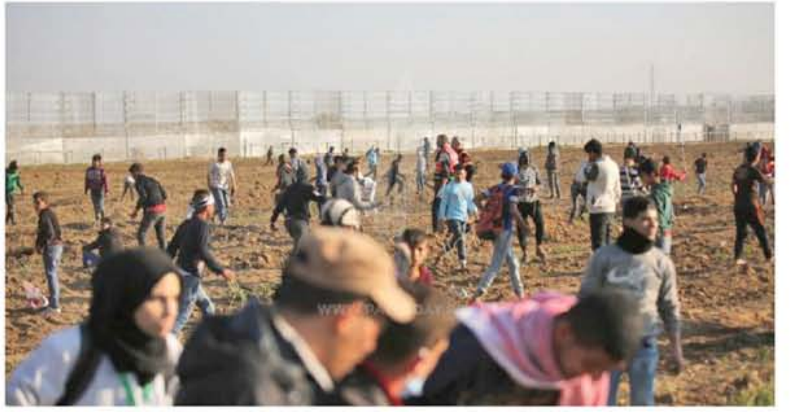
غزة - وكالات

أصيب عصر امس الجمعة عدد من المواطنين بالرصاص الحي والاختناق بالغاز المسيل للدموع، جراء اعتداء قوات الاحتلال الإسرائيلي على المتظاهرين السلميين المشاركين في الجمعة الـ٦ من مسيرة العودة الكبرى وكسر الحصار. وقالت وزارة الصحة إن ١٩ مواطناً بينهم