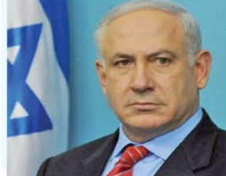
التفاصيل ص ٤٢

دعا زعماء غالبية الأحزاب الإسرائيلية إلى "ضرورة استعادة قودا الودع في قطاع غزة قبل فوات الأوان"، رداً على استمرار سقوط البالونات الحارقة على مستوطنات "غلاف غزة". وقال زعيم تحالف "أبيض - أزرق" بيني غانتس خلال زيارته لغلاف إن "حركة حماس تلحق على نتياهو جدول أعماله"، وأضاف أن الاتفاق على وقف البالونات واستئناف ضخ السولار وإعادة مساحة الصيد "يثبت أن حماس تلحق على نتياهو ما يفعل ولاه لا يوجد قوة روع بسبب عدم