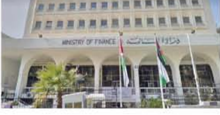
القطبية للمواطنين الأردنيين غير المأتمنين صحياً.

لا يتم تسديدها خلال العام نفسه ضمن بند الائتمانات السابقة ليصار إلى تسديدها على فترات والتي أبرزها لعمود التاجر العالجات