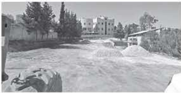
الابتباط - عمان