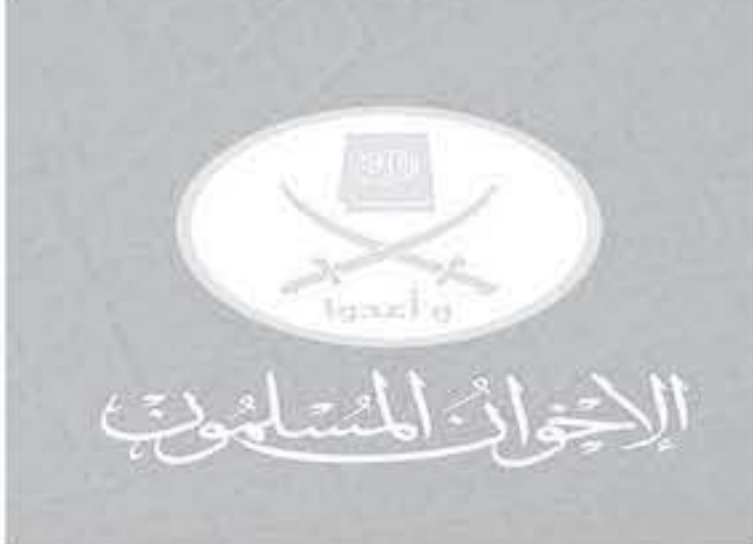
ويعد ذلك أول إعلان رسمي من الجماعة بهذا المضمون منذ خروجها من السلطة إثر احتجاجات حاشدة أيدتها الجيش في يوليو ٢٠١٣.

أعلنت جماعة "الإخوان المسلمين" في مصر عن تبنيها توجهها الجديدة للفترة المقبلة، وذلك على خلفية ما وصفته بـ "الواقع الجديد" بعد وفاة الرئيس الأسبق محمد مرسي و بعد مراجعات داخلية متعددة. وقالت الجماعة، المصنفة إرهابية في مصر، في بيان أمس: "قلنا بمراجعات داخلية متعددة وقتنا خلالها على أخطاء قلنا بها في مرحلة الثورة ومرحلة الحكم، كما وقتنا على أخطاء وقع فيها الحلفاء والمناهضون من مكونات الثورة.