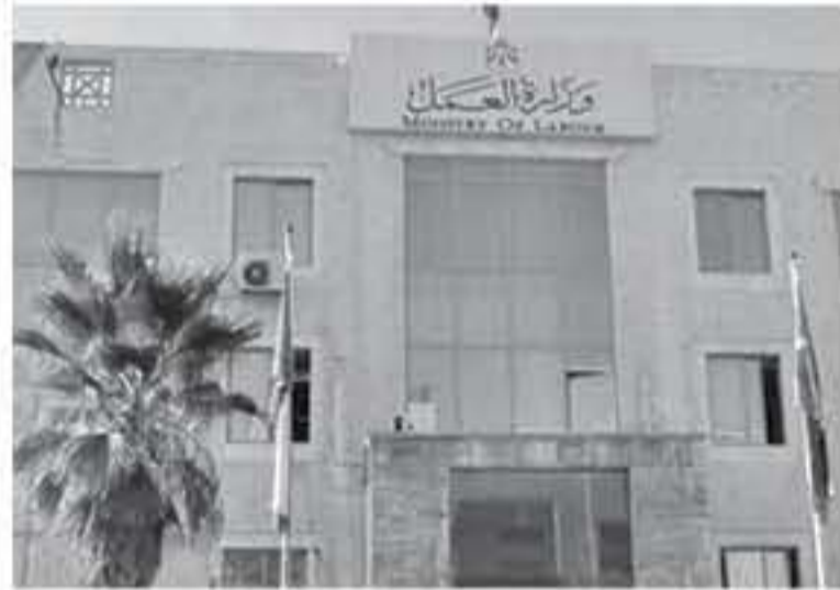
كل عام، وفي نفس السياق كشف "المصدر المسؤول" ان ان حالات الهروب للعاملات البنغاليات تراوحت ما بين 1500 الى 200 عاملة في