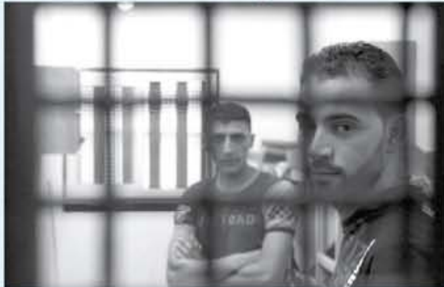
والضرب عن الطعام لليوم العاشر على التوالي، وأضاف: «اعتقل شقيقاه في الأول من آب/ أغسطس 2018، ويقعان في عزل سجن «موفر» إلى جانب عدد من أبناء بلدته الذين اعتلوا هم