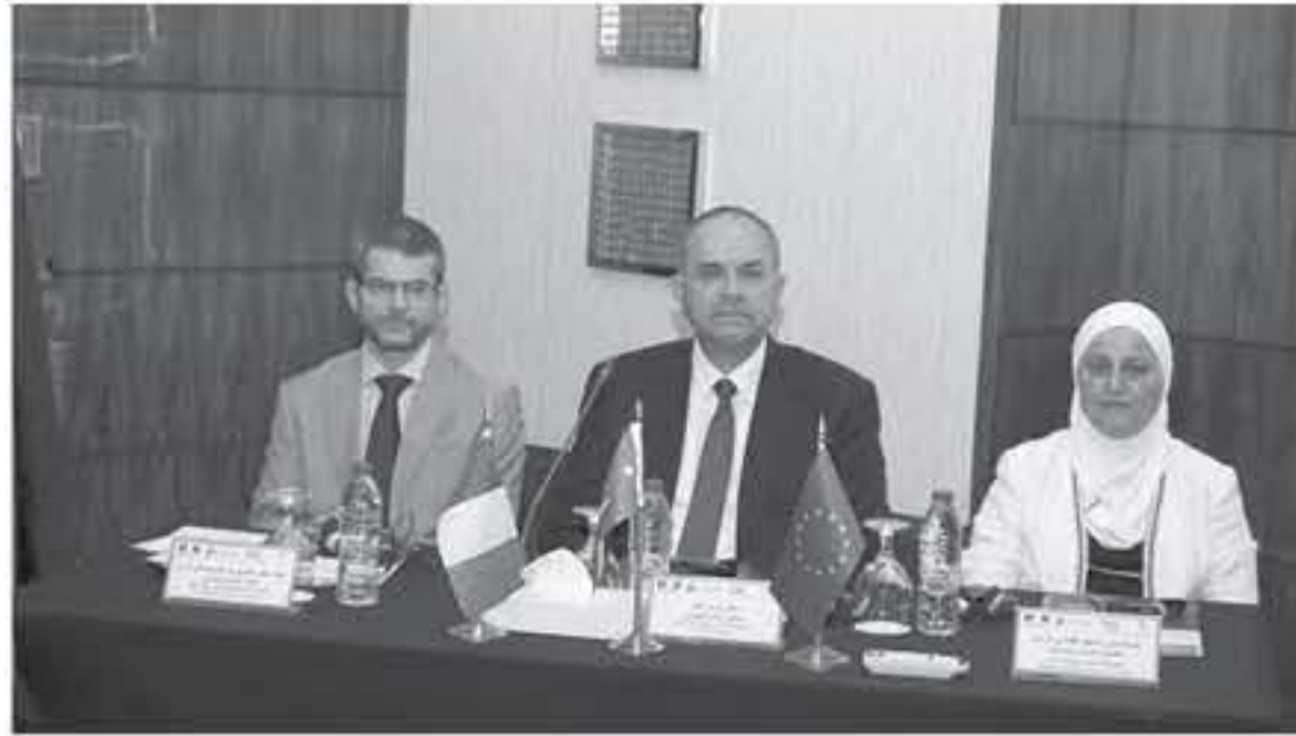
الاتباط - عمان

افتتحت امس اعمال ندوة "التدريب الفضائي بشأن الملكية الفكرية" وافتتاح حقوق الفكرية" التي تشهدها امس الفضائية برعاية وزير العدل ورئيس مجلس ادارة المعهد الفضائي الدكتور سام التلهوني. وبالتعاون مع السفارة الفرنسية في عمان وبمدرسة الوطنية للهندسة في فرنسا.