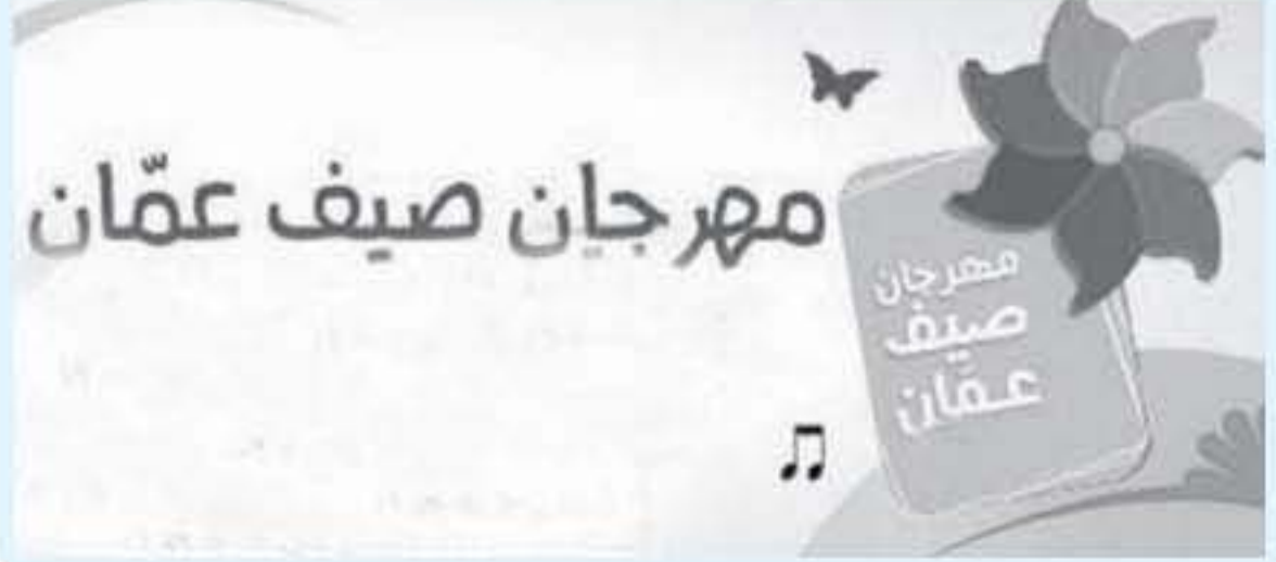
الاتباط - عمان

خلال توفير فرص المشاركة في مختلف المعارض والبيازارات والأنشطة التي تُعنى بالمرأة ويدورها الوطني في هتي الجالات والأصعدة وعلى رأسها الاقتصادية. ودعت زوار حدائق الحسين لزيارة بازار "بصمة نجاح" ودعم السيدات وتشجيعهن عن طريق شراء منتجاتهم اليدوية المميزة لافتة إلى أن نحو ٤٠ مستفيدة يعرضن في البيازار منتجات مشاريعهن التي تتنوع بين الأفعال اليدوية، والتطريز، والخزف، والصابون، والأعمال الخشبية والحاسية والمكولات الشعبية وغيرها الكثير. وقالت لفرید صلح إحدى المشاركات في البيازار ومختصة بصناعة الصابون