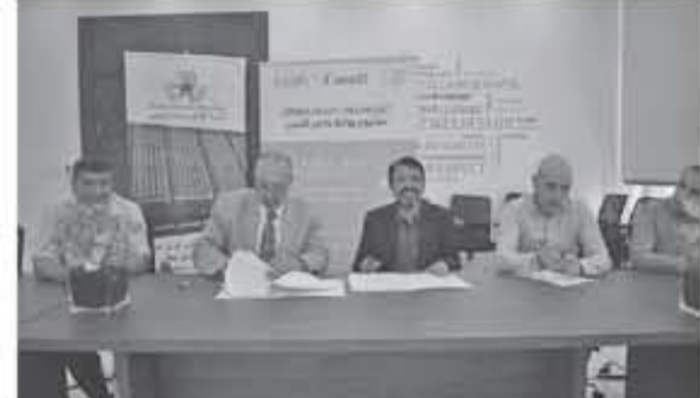
تلقت من مناطق تخزين للبلاستيك استعدادا للتسليم الاسوي، والتواصل ليصل مجموع المشتريات والمشتددين من المشروع الى نحو 780 عضوا وذلك

مع مقاولي مقالص النفايات في وادي الأردن وماديا والمقابلة لشراء 1700 طن من نفايات البلاستيك سنويا. وتتضمن الاتفاقية حملات التوعية لتثقيفهم حول كيفية إعادة تدوير البلاستيك لتصبح بمثابة دخل اضافي لهم. ويهدف مشروع روابط وادي الأردن "ميدا" الذي تموته الحكومة الكندية إلى دعم النساء والشباب من أصحاب المشاريع الريادية وربطهم بالأسواق المحلية لتمكينهم من تأمين مصادر دخل مستدامة، حيث يستهدف هذا المشروع 25 ألفا من النساء والشباب الريادين في مجالات التكنولوجيا النشطة، وتجهيز الأندية، والسياسة المجتمعية، والتوصل إلى قطاعات التمويل.