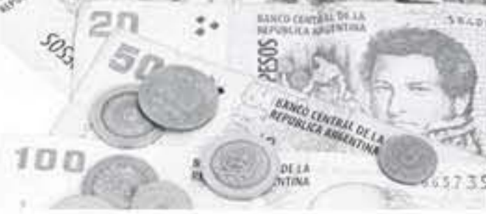
واشنطن - وكالات

سياستها الاقتصادية وتحقيق جميع الأهداف المحددة في البرنامج الذي يدعمه الصندوق. وأضاف: "على الرغم من أنها استعرفت وقتاً، فإن هذه الجهود المبذولة في إطار السياسة الاقتصادية بدأت تؤتي ثمارها، وحتى الآن، منح صندوق النقد ٣.٨٩ مليار دولار لإخراج الأرجنتين من أزمتها، وغرقت الأرجنتين في أزمتين ماليتين في ٢٠١٨، أدت إلى خسارة العملة ٥٠٪ من قيمتها، ودعمت صندوق النقد لإنقاذها والحصول على قرض بأكثر من ٥٧ مليار دولار.