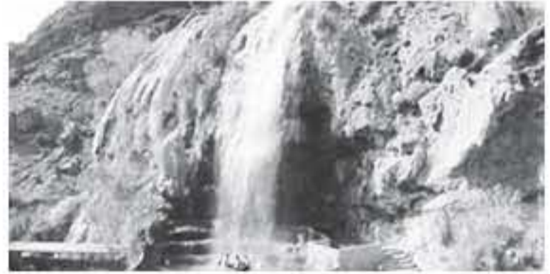
يذكر أن هيئة تنشيط السياحة أعدت بالتعاون مع وزارة السياحة، خطة تنويحية متكاملة تحوي العديد من النشاطات الترويجية في الدول المستهدفة.

ويبحث المجلس مع ممثلي القطاع العام والخاص، الالتزام بالاستراتيجية الوطنية لسياحة العلاجية ما ينبثق عنها خطة تنفيذية لتحقيق الخرجات المتفق عليها. ويضم المجلس في عضويته، وزراء الصحة والداخلية والسياحة والآثار والنقل والغازية وطؤون العتريين والمالية ومدير عام الخدمات الطبية الملكية ومدير عام هيئة تنشيط السياحة ومدير عام مؤسسة الحسين للسرطان ورئيس جمعية المنشآت الخاصة ورئيس جمعية متاعب وحركات لسياحة والسفر الأردنية ونهيا المنظمات الصحية ذات العلاقة ورئيس جمعية الفنادق الأردنية ورئيس جمعية المطاعم السياحية.