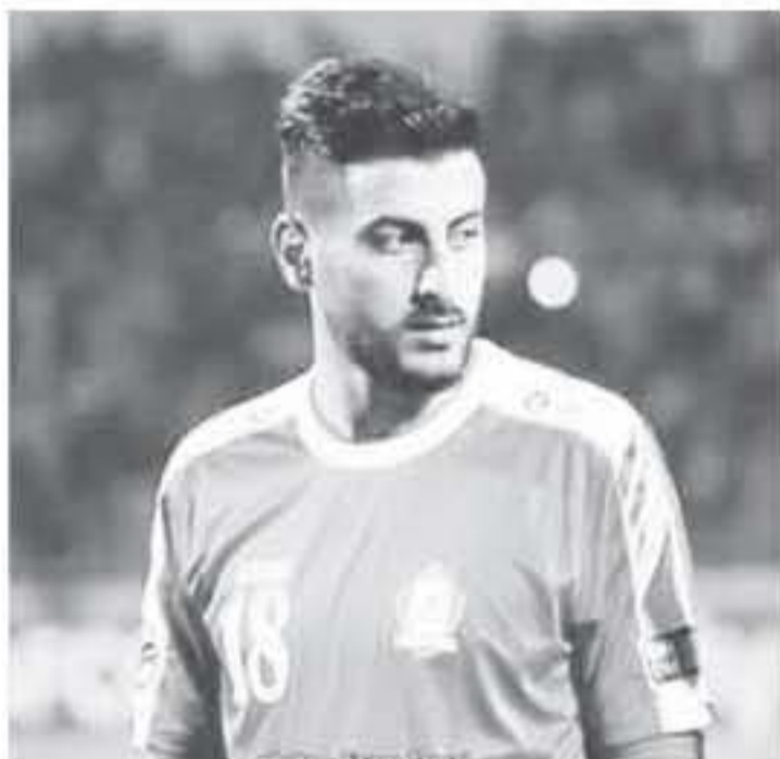
الأخبار - عمان