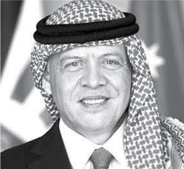
الأبواب - عمان