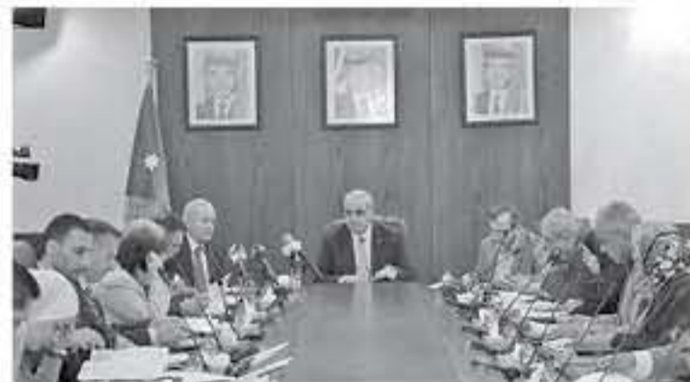
الأبواب - عمان