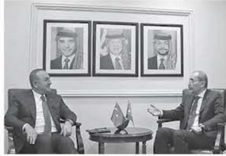
الأبواب - عمان

على الأراهب. وأكد الوزير الموقف المشترك أن القضية الفلسطينية هي القضية العربية والإسلامية الأولى، وأن حلها على أساس حل الدولتين الذي ينهي الاحتلال ويضمن قيام الدولة الفلسطينية المستقلة وعاصمتها القدس الشرقية على خطوط الرابع من حزيران ١٩٦٧ هو السبيل الوحيد لإنهاء الصراع وتحقيق السلام الشامل. وأكد الوزير مركزية القدس وقيادتها في العمل العربي والإسلامي وضرورة الحفاظ على الوضع التاريخي والقانوني القائم فيها وفي مقدساتها الإسلامية والمسيحية.