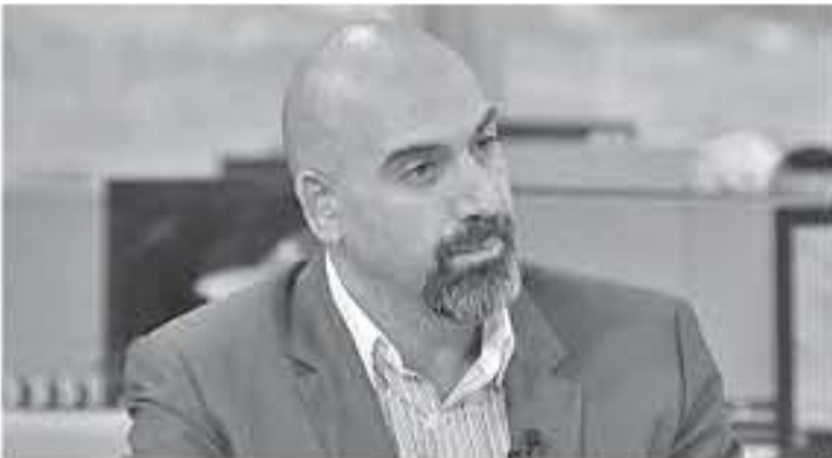
الأبواب - عمان - جمانة خنفر

واضاف الكيلائي ان الصيدليات التي يملكها اعضاء المجلس والنقيب جميعها تخضع لتفتيش دائم من قبل المؤسسة