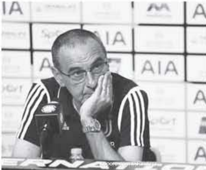
أميركا - وكالات

أيضا. كريستيانو رونالدو سيلعب في الجانب الأيسر أيضا، حيث أنه يحب الخوض قدماً ويجب أن يحدث التفارق. وتابع: "لا أتوقع الكثير من الاختلافات عن مبارياتنا الأولى، في هذه الجودة التحضيرية، نلتزم قليلاً لكننا نخوض مباريات أكثر، لذا ستكون المرحلة الحاسمة من تحضيراتنا للموسم الجديد ستكون من أواخر يوليو/تموز حتى 10 أغسطس/آب. وأردف مازوريسيو: "أعتقد أن مستوى المدربين الإيطاليين واضح، ومن وجهة النظر هذه، أؤكد أن الفجوة بين الدوري الإيطالي والدوري الأخرى مثل البريميرليج ليست هائلة، لكنها اختلافات مالية. وختم ساري: "بالولو دييالا يمكنه اللعب بسهولة كمهاجم وهمي، لكننا قد نجد حلولاً أخرى مختلفة له، ربما خلف الثنائي الهجومى."