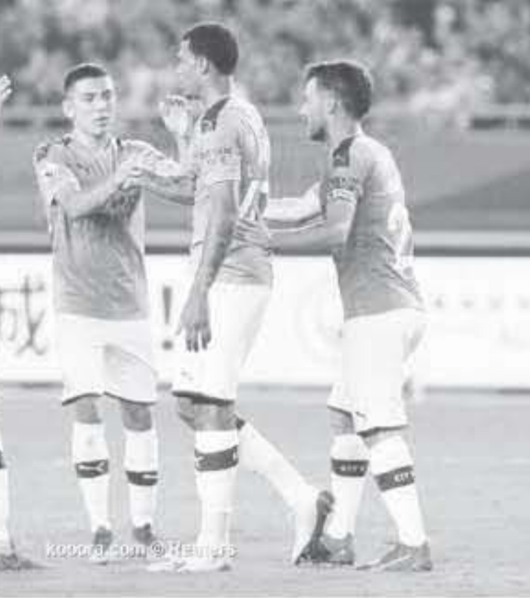
بكين - وكالات

وكالات وكالة أنباء الصين الجديدة "شينخوا" قد شنت حملة انتقادات لاذعة ضد نادي مانشستر سيتي الإنجليزي، الذي خاض في الصين خلال الأيام الأخيرة بطولة الدوري الإنجليزي الأسبوعي. يذكر أن مانشستر سيتي، خاض البطولة بجانب فريقين إنجليزيين آخرين، هما وولفرهامبتون وليوكاس، حيث خسر 1 / 1 أمام الأول في المباراة النهائية بركلات الترجيح، بعد أن فاز على الثاني في الدور قبل النهائي. وأصدرت "شينخوا" بياناً شديد اللهجة، نقلته عنها صحيفة "ماركا" الإسبانية، أكدت فيه أن النادي الإنجليزي جاء إلى الصين بحثاً عن كسب المال وليس كسب قلوب المشجعين الصينيين. وقالت إن لم يخال بالجزء المناسب، وأوضحت الوكالة الصينية أن مانشستر سيتي كان قلقاً بشأن الأموال، حسب، وأكدت في بيانها، "طريقة تصرف مانشستر سيتي في الصين تشير إلى أنهم جاءوا مدفوعين برغبة في كسب الأموال، وليس القلوب، تواجد بطل الدوري الإنجليزي في الصين لم يكن سوى واجب تجاري.. وأضاف: "لقد اقتصدوا للحساس اللازم، طريقة تعاملهم مع الجماهير تختلف عن تعامل فريق آخرى جاءت إلى هنا، وتابع: "تفترسة مانشستر سيتي وقله احترامه للجماهير الصينية كانت شيئاً مفايراً تماماً لما أظهره وولفرهامبتون أو ليوكاس حيث سيرحلان عن الصين بأضرار جدد، يجلب الاحترام. السيتي سيرحل بدون أي شيء"