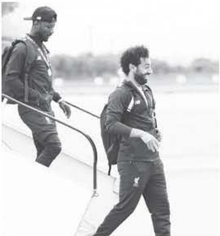
نيروبي - وكالات

التذكارية فور وصوله وقبل مغادرته. ويخص صلاح، إجازته حالياً بعد المشاركة مع منتخب مصر في كأس الأمم الأفريقية، بينما حاض لنيروبي مبارياتين وديتين ضد إيفيبي وبوروسيا دورتموند... ويفتتح الليبر مشواره في الموسم الجديد للدوري الإنجليزي بمواجهة نوريتش سيتي يوم ٩ أغسطس / أيلول المقبل. ولم تنس التقارير الصحفية، في كينيا الإشارة أيضاً إلى أن منتخب بلاده يقع مع مصر ضمن المجموعة السابعة المؤهلة لتصفيات أمم إفريقيا ٢٠٢١، والتي تضم أيضاً منتخب توجو وجزر القمر.