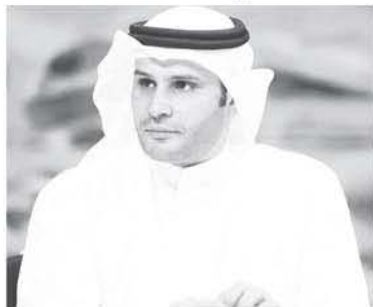
الكويت - خاص