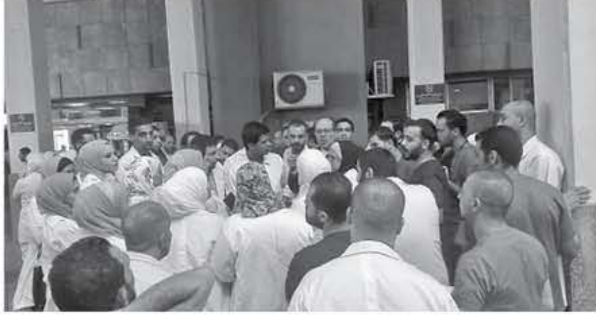
عمان - الأنباط

وعبرت عن تدهورها للحصوة للحضارية والإنسانية التي قدمها ممرضو المستشفى "الذين لم يتأخروا عن تقديم الرعاية للحالات الطارئة وهم يطالبون بحقوقهم بقوة وصلابة ومسؤولية عالية. وأكدت ان النقابة سوف تدعم مطالب الممرضين العائلي ويوم النظافة بتحقيق كامل حقوقهم.