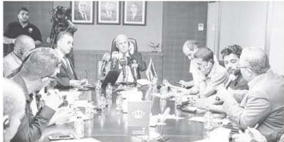
الانباط - عمان - مراك المصحي

من عام ٢٠١٧ وحتى في تنفيذها بشكل حديث، كما حقق في إطارها نتائج إيجابية على صعيد الربحية والنمو المتزايد في أعداد المسافرين. وأضاف أن «التيمة» زادت في الشهور الستة الأولى من عام ٢٠١٩ عن عام ٢٠١٨ بنسبة ١٠٠ في المئة، وذلك بفضل الإيرادات التشغيلية للشركة من ٣١٠,٢ مليون دينار في النصف الأول من عام ٢٠١٩ إلى ٣١٦,٣ مليون دينار لقرنته المقارنة من العام الحالي وبنسبة زيادة ١ بالمئة في الوقت الذي استطلعت الشركة تحصيل التعاليف التشغيلية بمعدل ٣٧,١ مليون دينار في الشهور الستة الأولى من العام الماضي إلى ٣١ مليون دينار لتلات الفتره من عام ٢٠١٩.