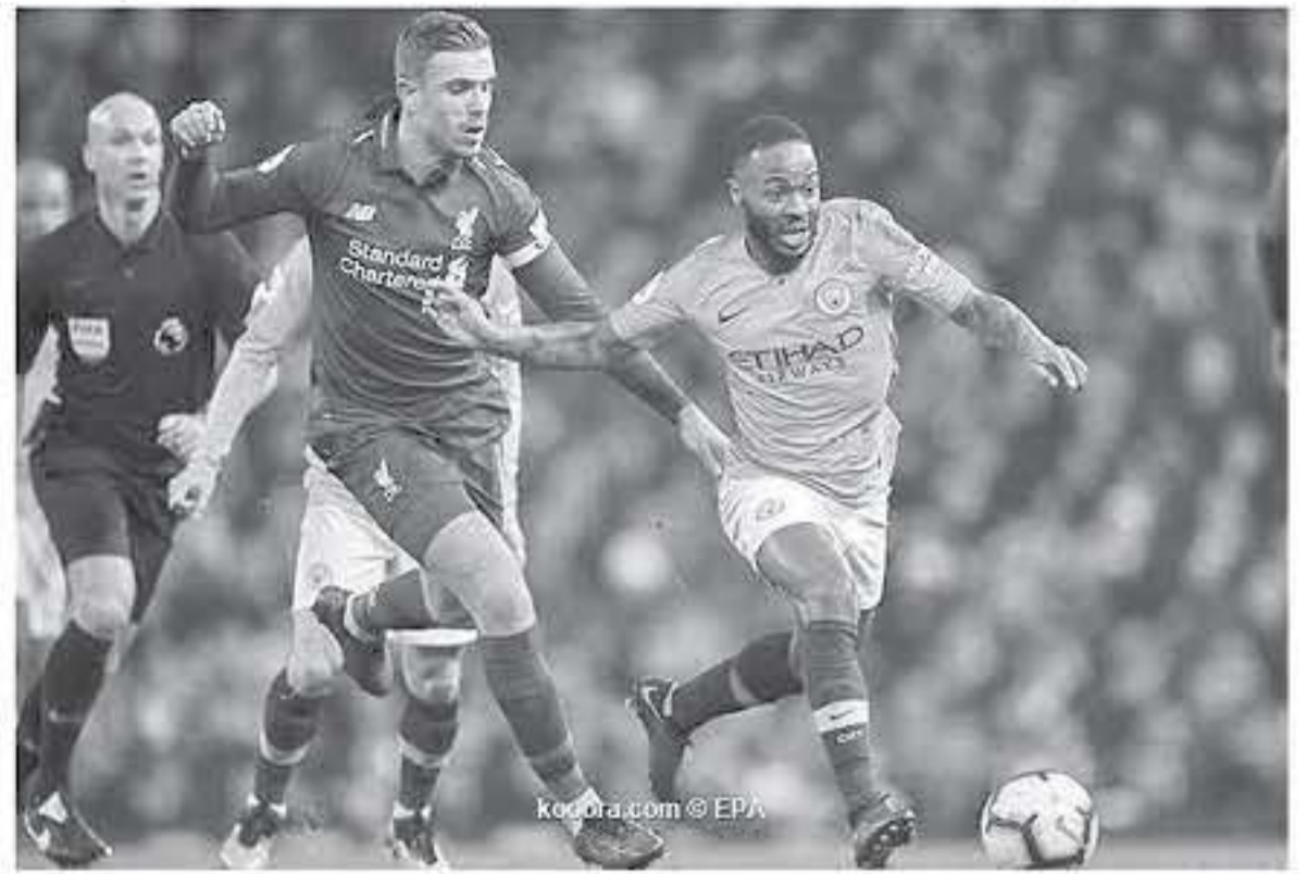
كودرا.com © EPA