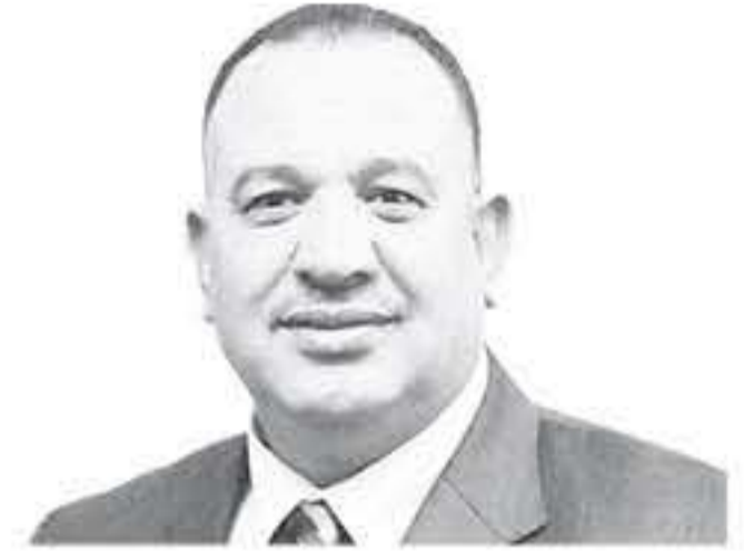
الأنباط-عمان تثبت وكالة التصنيف العالمية ستاندر أند بورز ومقرها "باريس" تصنيفاتها الائتمانية للبنك الإسلامي الأردني للالتزامات طويلة الأجل (B+).

والالتزامات قصيرة الأجل (B) ونظرة مستقبلية مستقرة (stable) وتصنيف SACP للعملة الأجنبية بدرجة (bb-). وبين التحرير الصادر عن وكالة ستاندر أند بورز أنه تم تثبيت التصنيفات الائتمانية للبنك الإسلامي الأردني وفقاً للنتيجة التصنيف العالمية التي تلقتها الوكالة على جميع المؤسسات التي تقوم بتصنيفها لما يتبع به البنك من مركز محلي قيادي بريادته للعمل المصرفي الإسلامي وقوة حصته السوقية حيث يعد أكبر مؤسسة مالية إسلامية وثالث أكبر بنك مصرفي في الأردن، يمتلك جودة أصول قوية وكفاءة التماثل عالية ولديه مرونة في التعامل مع التحديات الاقتصادية في الأردن، ويمتلك قاعدة تمويلية متينة ويتمتع البنك بقاعدة عملاء واسعة ومتنوعة ورأسمال وسولة كافية