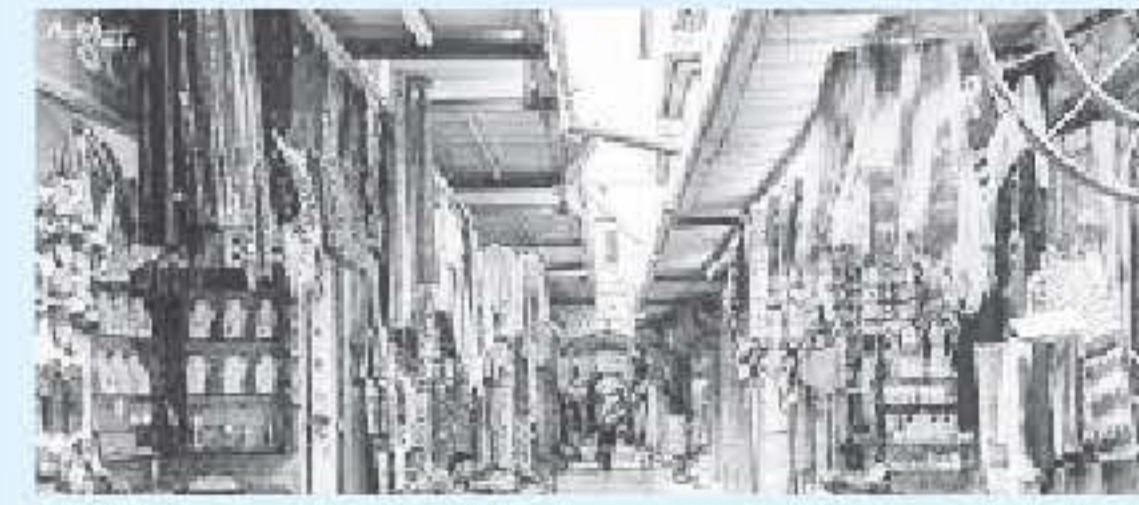
الانباط - وكالات

كبيرة لإرهاق الاقتصاد الهديس لدفعه على الهجرة جنباً إلى جنب مع اصحابه المقدسيين الذين يثلثون تحت وطأة الضرائب والتجوير. المعركة على القدس تتطلب تعزيز صمود أهلها ودعمهم بمختلف الوسائل الممكنة، قال العموري.