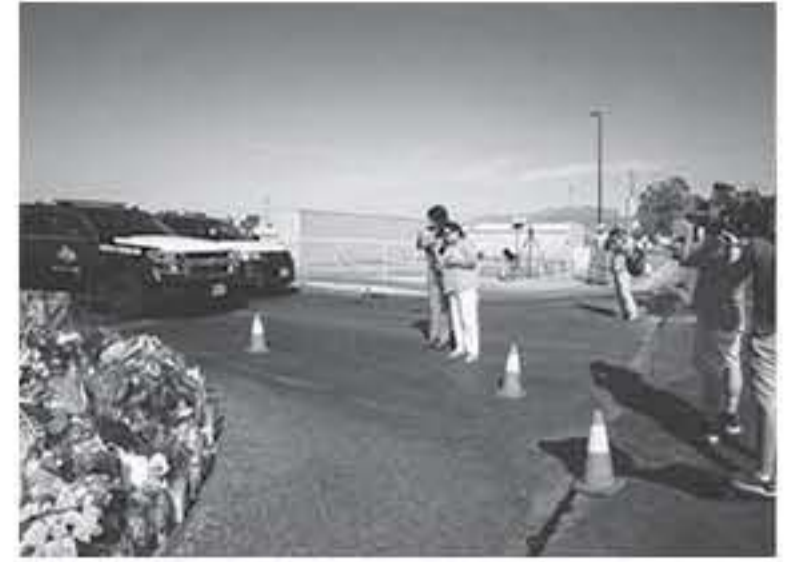
الانباط - وكالات

قادة داعش من حراسة أتباعهم بحكومتهم المزعومة لفترة قصيرة، فإن القومية البيضاء الجديدة ليس لديها قيادة رسمية. ويوضح مؤلف كتاب «التطرف» ج. إم. بيرغر «أعتقد أن الكثير من الذين يعملون على التطرف عبر الإنترنت توقعوا ما حصل» مشيراً إلى أوجه التشابه بين القومية البيضاء وداعش. وعند مراجعة الخطوات التي أدت للأحداث الأخيرة ليس من الصعب بيان الأسباب. إن سبت أفعال داعش جعله صودجا للمتطرفين الذين يرون المسلمين أعداء. ويتولى بيرغر «من الناحية الهيكلية، لا يهم ما إذا كان المتطرفين من الإرهابيين أو القوميين البيض». إذ كان الشعور بالقومية البيضاء في ارتعاش على مر سنوات، وحتى أن هامش اللجوء إلى العنف كان من المؤكد أن يرتفع. ويحول خبراء، للصحيفة، هذا هو بالتحديد ما يبدو أنه يحدث مع الخلايا المتطرفة للحركة القومية للبيض التي تشهد ازدياداً بالعالم. إن تطور ملف الأيديولوجي من تطوير لأدوات التجنيد وخصص التطرف لفترة صعود «داعش» تشبه بطريقة مخيفة تلك التي يتبناها الإرهابيون القوميون اليوم. وبالنسبة لهؤلاء، فإن العالم يتجه بحلق ثابتة نحو صراع عاثي بين البيض وغير البيض. وحوادث رواية غريبة صدرت عام ١٩٧٣ بعنوان «معسكر القديسين» لكتاب مقدس للعديد من القوميين البيض، ويأتي الكتاب على مجموعة من الجهود المبذولة من جانب الأجناب عبر البيض لسحق