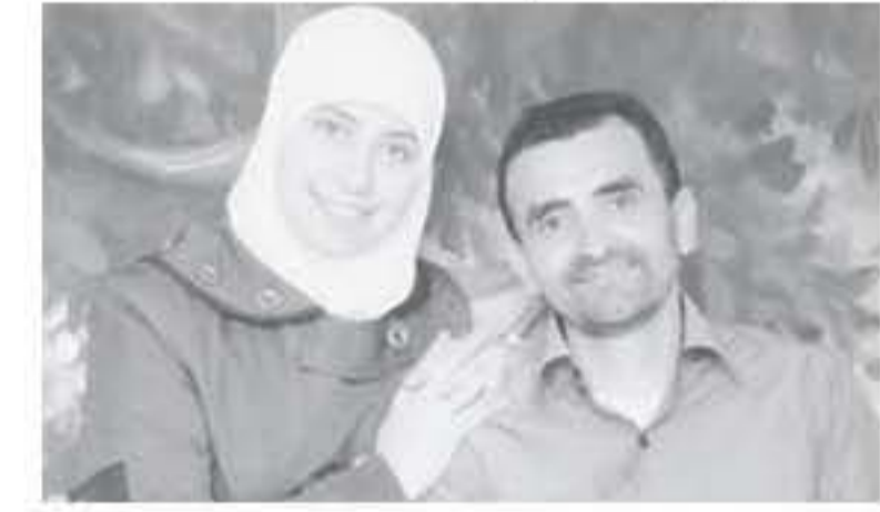
الانباط - وكالات

أوضاعه الصحية. مشددة على أنه أحد ضحايا الإهمال الطبي الذي يستخدمه الاحتلال لقتل الأسرى. ووجهت لجنة دعم الصحفيين، مناشدة عاجلة لكافة المؤسسات الحقوقية الدولية، مطالبة إياها بالتدخل الجاد والفعال لإنقاذ حياة السايح.