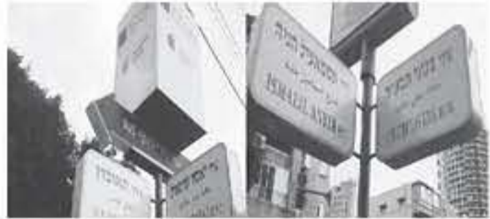
القدس المحتلة - وكالات

مثل «جادة النصر وجادة الورد...» وحمل بعض الشوارع مضامين سياسية مثل «شارع الإعدام للإرهابيين» في إشارة إلى الدعوة لتفرض عقوبة الإعدام على أسرى فلسطينيين متهمين بقتل «إسرائيليين». وقالت الجمعية التي بادرت إلى هذه الخطوة، في بيان: «يتمرد الإسرائيليون بحبيبة أمل إزاء ضعف رد الحكومة على حماس ووقف إطلاق النار الذي تم التوصل إليه بعد الجوة الأخيرة من القتال.. وأضاف: يدعو مشروع النصر الإسرائيلي المسؤولين المتشككين والجنود المجتمع الإسرائيلي بأسره، إلى التحول من سياسة التهينة إلى سياسة النصر من خلال الوسائل العسكرية والاقتصادية والسياسية. وتتهم المعارضة وقطاعات في «إسرائيل» الحكومة بالخضوع لحركة حماس في قطاع غزة، منذ توصلها إلى تفاهات «تهنئة» شهية، بوساطة مصرية وأممية وفكرية.