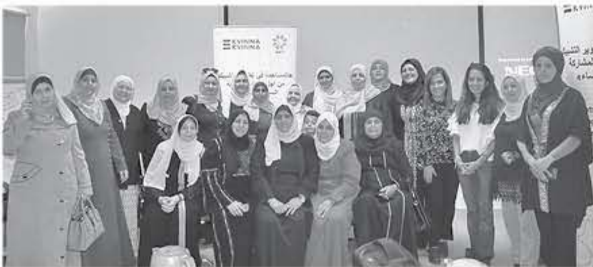
جرش -الابتاط-تأديا العناترة

نظمت جمعية النساء العربيات وبالتعاون مع منظمة كفيينا كل كفيينا السويدية في قاعة الاتحاد النسائي في محافظة جرش وضمن مشروع المساهمة في تطوير التشبيك من أجل زيادة المشاركة السياسية للنساء تعدد من فعاليات الجمعيات والتنمية في جرش وجعلون.