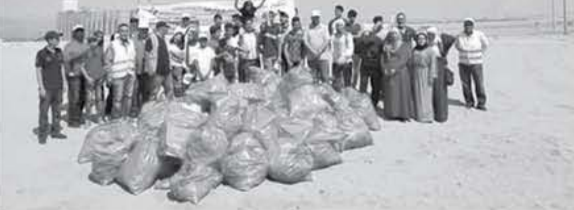
الأردن ومجموعة القمر الكشفية ومبادرة اترك أثرًا. وفي نهاية الحملة التي استمرت ٣ أيام من عطلة عيد الأضحي واستهدفت جميع