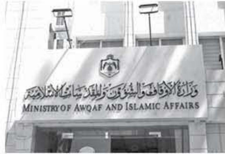
الأوقاف والشؤون والمؤسسات الإسلامية، حجاج الحجازي، أن بعثة الحج الاردنية التابعة للوزارة استأجرت حافلة لتلحق