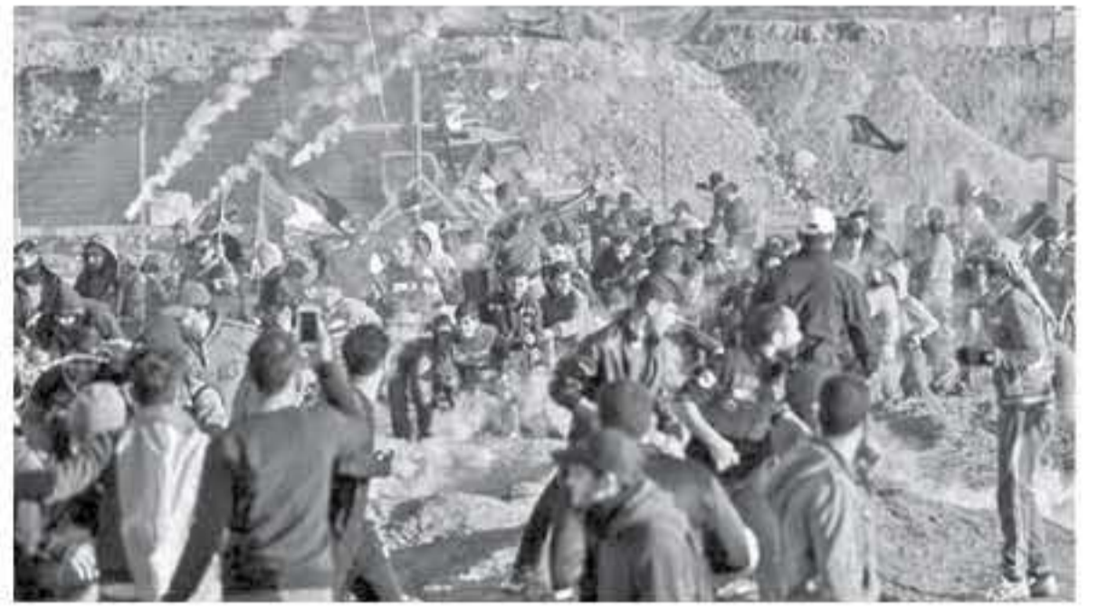
غزة - وكالات

أكد أن إسرائيل لا تحتمل هذا الواقع، وكان يشير إلى عمليات تسلل مسلحين من غزة إلى مناطق الحدود والاشتباك مع جيشه. وقال إن إسرائيل أمام وضعين هما الوضع الحالي الذي تزد فيه إسرائيل على كل نشاط في غزة، فيما الاحتمال الثاني هو التنازل لإسرائيل للحرب، حيث ستسقط عليها صواريخ وستعمل على هزيمة حماس، مدعياً قدرة بلاده على اسقاط حركة حماس. في رسالة عملية على تهديدات إسرائيل ضد غزة، جابت طائرات حربية نفاذة ليل الثلاثاء، وحتى فجر الأربعاء فوق سماء قطاع غزة، وعلى ارتفاعات منخفضة ضمن تدريب عسكري. وقد أعلن المتحدث باسم جيش الاحتلال عن بدء قواته مناورات عسكرية، في منطقة إيلات والمنطقة المحيطة بها، على أن ينتهي مساء الأربعاء. وقال إن المناورات تم التخطيط لها مسبقاً، وأنها جزء من برنامج التدريب لعام 2019، وتهدف إلى الحفاظ على استعداد القوات ويهبطهم. وتوحيظ مؤخرًا أن قوات الاحتلال كتفت من تدريباتها العسكرية في مناطق الجنوب الغربية من حدود غزة إذا شهدت الأسابيع الماضية العديد من التدريبات.