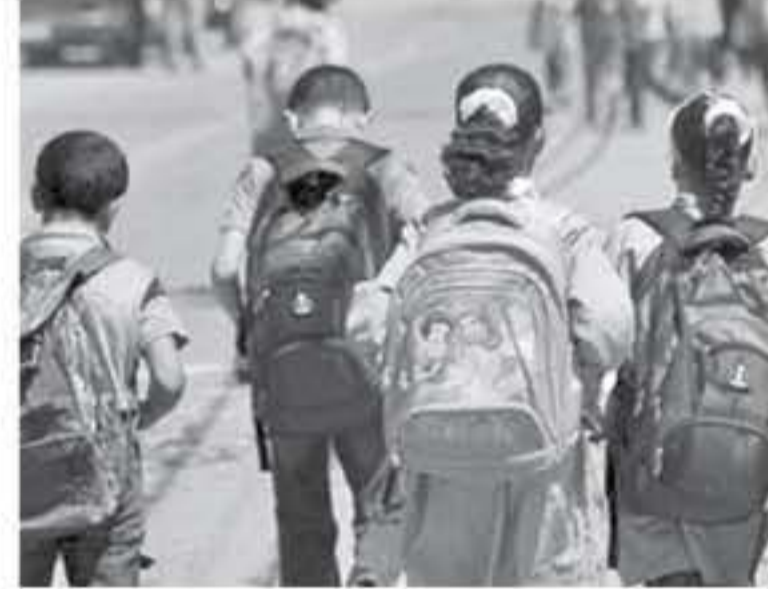
ويبدأ الدوام المدرسي للفصل الدراسي الثاني في الثاني من شهر شباط ٢٠٢٠، على أن تبدأ الاختبارات التحصيلية لحدائق الفصل يوم السبت ٢ أيار ٢٠٢٠

وتلتهي يوم السبت ٢٣ من الشهر ذاته، تليها عطلة الصيف. وحسب التقويم المدرسي، يبلغ عدد أيام الدراسة الفعلية في المدارس للعام الدراسي المقبل، ١٩٥ يوماً بواقع ١٠٦ أيام للفصل الدراسي الأول، و ٨٩ يوماً للفصل الدراسي الثاني، فيما يبلغ عدد الأيام الدراسية الفعلية المرحلة الثانوية في فروع التعليم الثانوي الشامل المهي في السنة الثانية (التوجيهي) ٢٢١ يوماً بما فيها أيام التدريب العملي الصيفي. يذكر أن وزارة التربية والتعليم تعهدت في تحديد عدد أيام الدراسة الفعلية في السنة على ما ورد في المادة ١٠ من قانون التربية والتعليم رقم ٣ لسنة ١٩٩٤ وتعديلاته، التي تنص على أن تتراوح أيام الدراسة الفعلية خلال السنة الدراسية ما بين ١٩٥-٢٠٠ يوم كحد أدنى للمدارس التي تعطل يومين في الأسبوع، حيث قررت الوزارة أن يكون الحد ١٩٥ يوماً للفصلين الدراسيين.