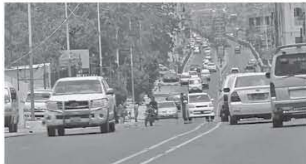
صنعاء - وكالات

طلبت حكومة الرئيس اليمني، عبد ربه منصور هادي، أمس الأربعاء، بانسحاب الانفصاليين الجنوبيين من مواقع سيطروا عليها في مدينة عدن قبل أي حوار سياسي معهم. وأكدت وزارة الخارجية اليمنية في بيان، أن الحكومة اليمنية تجدد ترحيبها "بالدعوة المقدمة من المملكة العربية السعودية الشقيقة لعقد اجتماع للوقوف أمام ما ترتب عليه الانقلاب في عدن". وأضاف البيان، "ولكن يجب أولاً أن يتم الالتزام بما ورد في بيان التحالف من ضرورة انسحاب المجلس الانتقالي من المواقع التي استولى عليها خلال الأيام الماضية قبل أي حوار". وأكد المجلس الانفصالي الجنوبي استعداده للحوار الذي دعت إليه الرياض، ولكنه لم يظهر حتى الآن أي استعداد للانسحاب من المواقع التي سيطر عليها في عدن بما في ذلك الحصن الرئاسي.