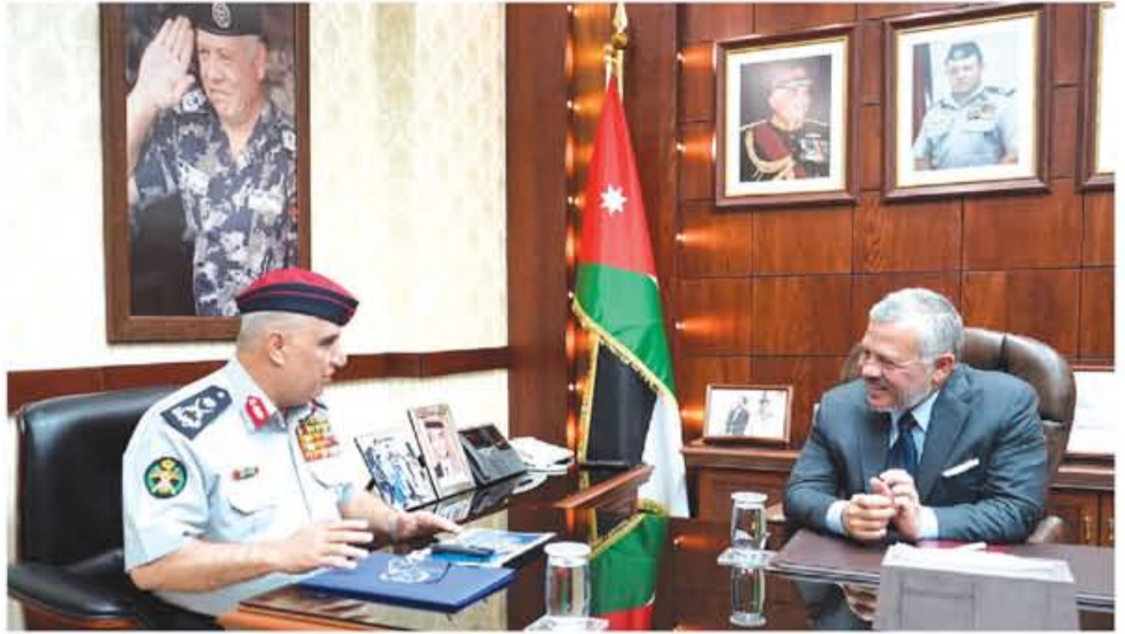
● الملك يطهئن على صحة أمير الكويت ويلتقي وزيرة ألمانية