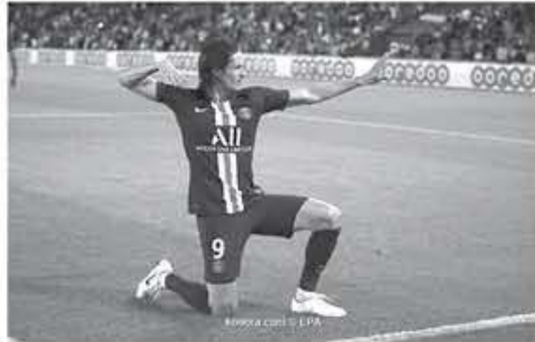
هوية في ظل تباعد الخطوط بين ثلاثي الوسط ماركيتوس وفيراتي ودراكسلا، وثلاثي الهجوم دي ماريا ومبابي وكافاني، واختفاء الإمدادات من ظهوري