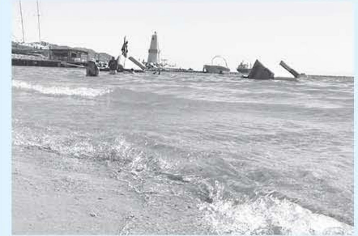
الانباط - بترا

يقيم زوار وسكان مدينة العقبة كل صباح وديانة ليجدوا في لوتورجيا فورجيا أو أسامان أو شي شواطها، لكن ويمجدو لتكافؤ النهار يوايه عمار التظافة سبلا من التظافات هنا وهناك في وقت تشير الأرقام الرسمية إلى أن هناك أكثر من ٤٠ مليون دينار على التظافة في العقبة الرسمية البحرية خلال ١٢ سنة الماضية.