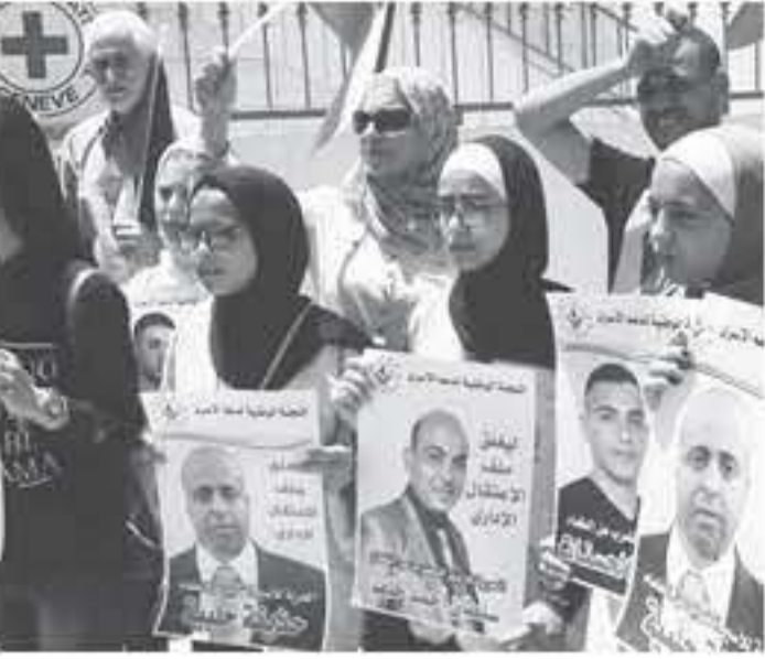
الانباط - رام الله