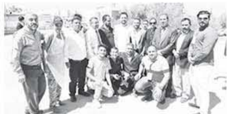
الانباط - المفرق

شارك سمو الأمير الحسين بن عبدالله الثاني ولي العهد، امس، مجموعة من المتطوعين في صيانة مدرسة المفرق الثانوية الصناعية للبنين، ضمن الحملة الوطنية لصيانة المدارس الحكومية لتزدهو مدارسنا.