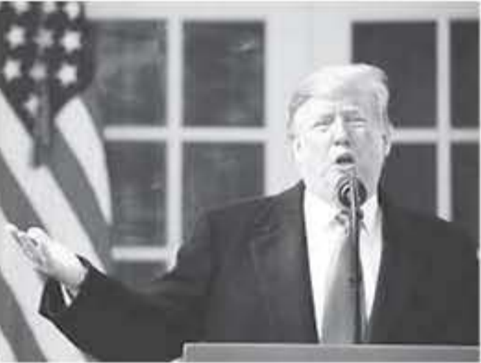
واشنطن - وكالات

وتطرق إلى انتخابات الرئاسة الأميركية التي ستجري في نهاية العام المقبل، وقال إنه سيبحث على نائبه مايك بنس ليخوض معه الانتخابات الرئاسية القادمة. وتابع "أنا سعيد للغاية مع مايك بنس". وفي حزيران/يونيو الماضي جرى الإعلان عن التزم الاقتصادي من "صفقة القرن" من خلال ورقة عُهدت في الخاتمة، من دون مشاركة الفلسطينيين، الذين أعلنوا رفضهم للخطّة. وتبين أن التزم الاقتصادي يستلزم إلى إقامة صندوق دولي يستثمر ٥٠ مليار دولار، بينها ٢٨ مليار دولار ستمستثمر في الضفة الغربية وقطاع غزة، وبما في المبلغ يستثمر في مشاريع في الأردن ومصر ولبنان ودول عربية أخرى.