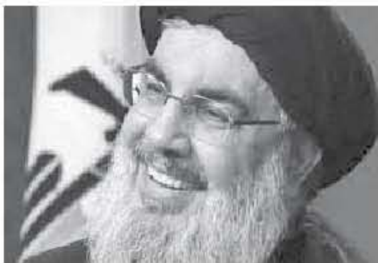
نصر الله وصف القرار الرسمى اللبناني بإدخال الجيش في معركة الجرد بالشجاع. وذكر نصر الله بالوقوف الأميركيين

أكد الأمين العام لحزب الله حسن نصر الله أن ما حصل في السنوات الماضية وأنهت "حرب الجرد" لم يكن حدثاً عابراً ولا يجوز أن يصبح كذلك. نصر الله قال خلال كلمته في مهرجان "صباح الوطن" بمناسبة الذكرى الثانية للتحرير الثاني أمس، إنه "كانت هناك خريطة للسيطرة على المنطقة وتقسيمها على أسس مذهبية وعرقية"، مشيراً إلى أن "ثالثاً في المرحلة السابعة منع مشروع التقسيم في المنطقة". وفي السياق، رأى نصر الله أنه يجب استحضار من "سائد الإرهابيين ودعمهم وزوعهم بالسلح وادافع عنهم سياسياً واعلامياً"، في الوقت عينه الذي يجب أن يستحضر فيه "من واجه الإرهابيين وقتلهم في لبنان وسوريا وغيرها".