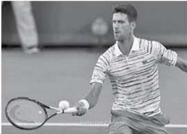
أمريكا - وكالات

وقال ديوكوفيتش في مؤتمر صحفي امس الأحد: "هذا يحتمني قدرًا من المسؤولية، لأنني أطمح لتحقيق ذلك.. وأضاف: "إنه بالتأكيد أحد طموحاتي وأهدائي". وتوج ديوكوفيتش بعدد 16 لقبًا في بطولات الجولاند سلام محافل عشرين لقبًا ليفيدرر فيما يتوسط الإسباني رافاييل نادال الثنائي بإحرازه 18 لقبًا.