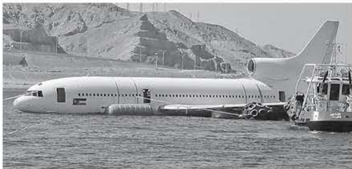
الابتاط - العقبة - خليج العقبة

غرقت سلطة منطقة العقبة الاقتصادية الخاصة امس طائرة ترايستر التجارية لتضم الى النصف العسكري البصري الذي تم تجهيزه في مياه خليج العقبة ليكون مقصدا سياحيا ومكانا مميزا للفحوص بوجه السياح والفاوض من مختلف دول العالم.