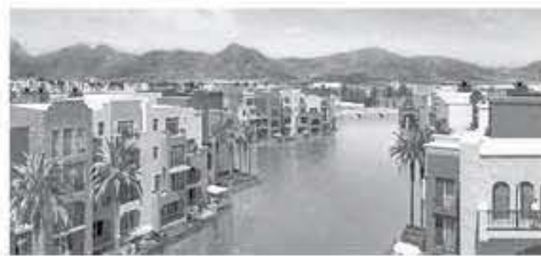
الابتاط - العقبة

تدشن مجموعة روجي قريبا أولى هيدلياتها في منطقة العقبة الاقتصادية الخاصة بقرية الرسي في مشروع أيلة.