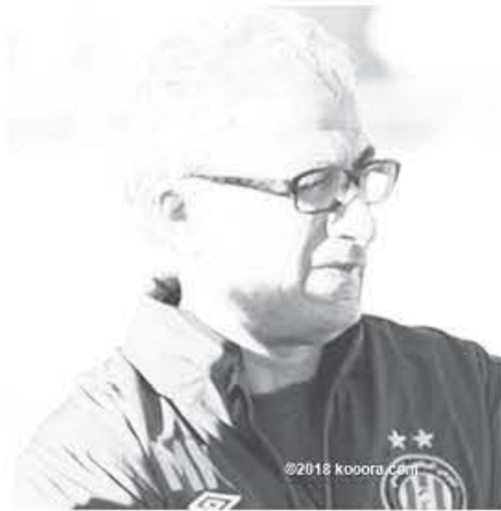
تونس - وكالات

القدم خلفا للفرنسي آلان جيريس وأhead الاتحاد في بيان أنه تعاقب مع الكبير لمدة ٢ أعوام وسيجري الإعلان عن أعضاء الجهاز الفني التعاون له في مؤتمر صحفي غد الخميس.