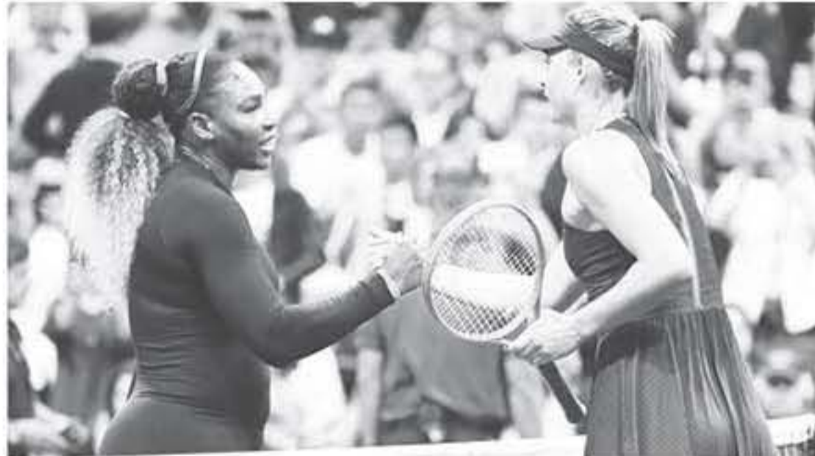
أميركا - وكالات

أبدت لاعبة التنس الروسية ماريا شارابوفا اقتناعها بأنها مازالت في مرحلة تعلم، وأكدت إيمانها بمهاراتها، وذلك عقب تعرضها لهزيمة كاسحة أمام الأمريكية سيرينا ويليامز (بواقع ١-٦ و ١-٦) في الدور الأول من بطولة أمريكا المفتوحة وصيرحت شارابوفا في مؤتمر صحفي عقب اللقاء: "أؤمن بمهاراتي، أعتقد أن أشخاص كثيرين قد يستعدون، لا سيما عقب الهزيمة ١-٦ و ١-٦ في الجولة الأولى من أمريكا المفتوحة. وتابعت المصنفة الأولى سابقاً ٨٧ حالياً "طال أن الشخص الذي يملك لا يعثر هكذا، فالوضع سيكون على ما يرام.. وأبرزت الحسنة الروسية أن من بين أسباب هزيمتها الإرسال القوي للخصمة الأمريكية، وعدم عونها مباريات كثيرة مؤخراً بسبب إصابته في الكتف الذي أجريت لها جراحة فيه قبل أشهر، علاوة على مواجهة لاعبة بستوي وويليامز في