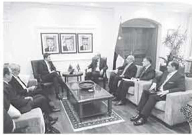
حرص بلاده لتطوير العلاقات مع المملكة في شتى المجالات. وأكد أهمية

الإرهاب، مشيدا بالدور المهم الذي تؤديه هذه الاجتماعات لتشد جهود المجتمع الدولي في محاربة الإرهاب وهزيمة فكره الطغامي. وأكد الصفدي أن الإرهاب عدو مشترك سنستمر الأردن في التصدي له بالتعاون مع المجتمع الدولي، لافتا إلى جهود المملكة في هزيمة طلائمه التي لا تنلني لأي حضارة أو دين، ولا علاقة لها بتيق السلام والمحبة التي يجسدها الدين الإسلامي الحنيف. وبحث اللقاء المستجدات الإقليمية، وفي مقدمتها القضية الفلسطينية والأزمة السورية. ووجه الوزير السكاكي دعوة للصفدي للمشاركة في المؤتمر المتوسطي للظلمة والأمن والتعاون في أوروبا الذي سيعقد في العاصمة الألبانية تيرانا في شهر تشرين الأول المقبل.