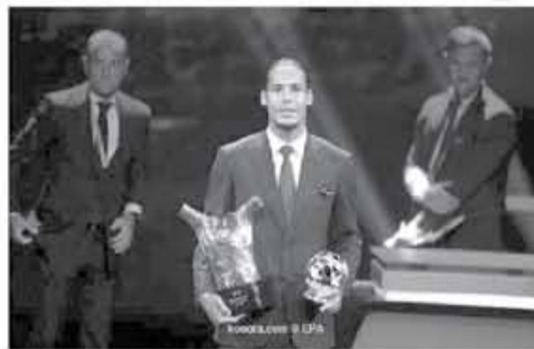
توج بجائزة أفضل لاعب في أوروبا لعام 2018، وتوج فان دايك مع فريقه بلقب دوري أبطال أوروبا على حساب توتنهايم، كما بلغ نهائي دوري الأمم الأوروبية

مع هولندا التي سقطت أمام البرتغال. بدور توج ميسي هدافًا للنسخة الأخيرة من التشامبيونز ليغ برصيد 14 هدفًا وحصل مع برشلونه على لقب الدوري الإسباني، من جانبه، كان كريستيانو رونالدو هداف المرحلة النهائية من دوري الأمم الأوروبية الذي توج به مع منتخب البرتغال، كما حقق لقب الدوري الإيطالي مع يوفنتوس، واشتعل الصراع على جائزة أفضل لاعب في العالم، بين الثلاثي لوسي برونز (أولمبيك ليون)، وأليكس مورجان (أورلاندو برايد)، وميجان رايشوي (ريجين)، ومن المقرر أن يحتضن ملعب «سان سيرو» في مدينة ميلانو بإيطاليا، حفل توزيع النسخة الرابعة من الجائزة، يوم 23 سبتمبر/أيلول الحالي.