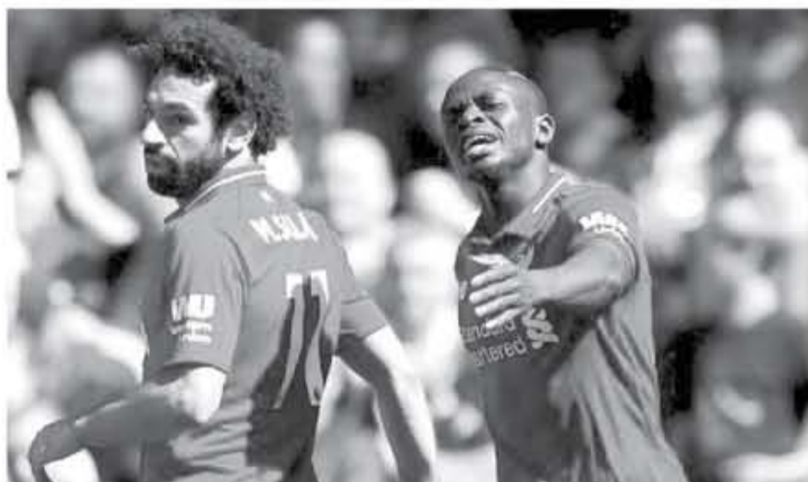
مختلفة، وخلال أسبوع واحد لا أعتمد أنني سأحدث عن ذلك الأمر مرة أخرى... ولم يتحدث صلاح أو ماني عن هذه الواقعة، لكن القائد جورديان هندرسون أكد أن الموقف تم تحطيمه من الثنائي، وأن كلاهما كان في حالة معنوية جيدة في غرفة خلع الملابس بعد المباراة، وسيوقف نشاط الأندية عدة أسبوعين

أكد الألماني يورجن كلوب المدير الفني للبرعولي أن الأزمة التي نشبت مؤخرًا بين ثنائي خط الهجوم محمد صلاح وساديو ماني، انتهت بنسبة 100٪، وظهر ماني عاهيًا أثناء خروجه للتبديل ضد بيرنلي بالبريميرليج، بسبب عدم تمرير صلاح له في إحدى الكرات، وهو ما أثار الجدل في وسائل الإعلام وبين الجماهير. وقال كلوب، خلال تصريحات لفتها صحيفة «مترو» البريطانية، «يمكنني وصفه أو 6 حالات طالب فيها اللاعبين صلاح بالتمرير لكنه سدد وسجل، إنني هي حرية اللاعب، ويجب على كل عضو بالفريق اتخاذ القرار سواء التسديد أو التمرير». وأضاف: «يمكننا ارتكاب مثل هذه الأخطاء، وأن نخسر الكرة أو لا نستطيع رؤية زميلنا في الفريق بشكل جيد، وهذا لا يعني أنك تجاهله، وثاني، الأمر ليس تحديًا كبيرًا، لكن بالطبع مع اتهاجم يمكن أن تحدث هذه المواقف وما يطعمه يعتمد على الموقف... وواصل: «ستترك الأمر بنسبة 100٪، لأننا فزنا بثلاثية نظيفة، والجميع يذهب في اتجاهات