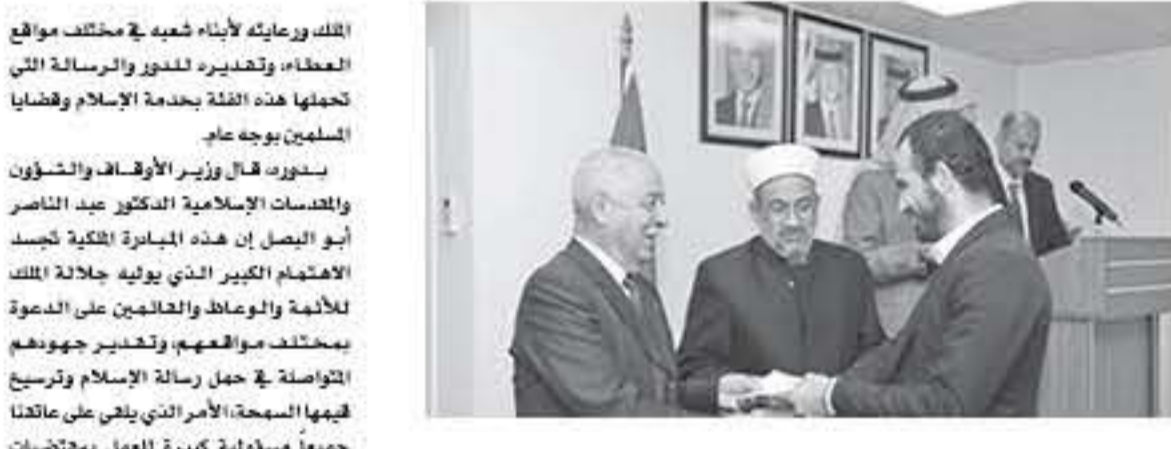
الأنتاب - عمان

الملك ورعايته لأبناء شعبه في مختلف مواقع العقائد، وتقديره للصور والرسالة التي تحملها هذه الفئة بخدمة الإسلام وقضايا المسلمين بوجه عام.