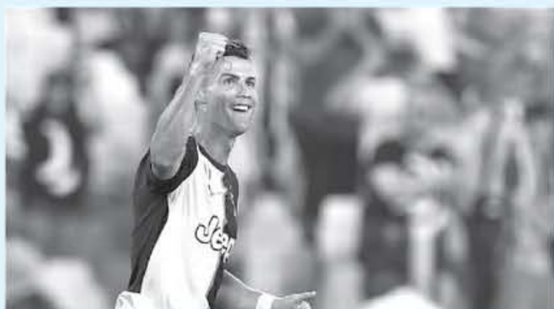
مدافع ونافس رونالدو على جائزة أفضل لاعب في أوروبا، لكنه خسرها أمام فيرجيل فان دايك، وسينافس على جائزة أفضل لاعب في العالم وتويستجي حارس برشلونة، وكاينيو كوينشيري أفضل

رفض البرتغالي كريستيانو رونالدو نجم يوفنتوس، وضع شارة أفضل لاعب على قميصه، احتراماً لزملائه في الفريق هذا الموسم، وقررت رابطة الدوري الإيطالي، وضع شارات خاصة على قمصان اللاعبين الذين توجوا بجوائز الأفضل في الموسم الماضي، كمكافأة لهم. وتوج رونالدو بجائزة أفضل لاعب في الموسم الماضي، بعدما قاد السيدة العجوز لحصد لقب الكالتشو، لكن اللاعب البرتغالي اختار عدم وضع الشارة على قميصه، بحسب صحيفة «دا صن». على الجانب الآخر، قرر الفائزون الآخرون ارتداء الرمز بكل فخر، حيث كان ليكو زانيلو لاعب روما قد توج بلقب أفضل لاعب شاب، فيما توج سمير هاندانوفيتش كأفضل حارس مرمرس، وكاينيو كوينشيري أفضل