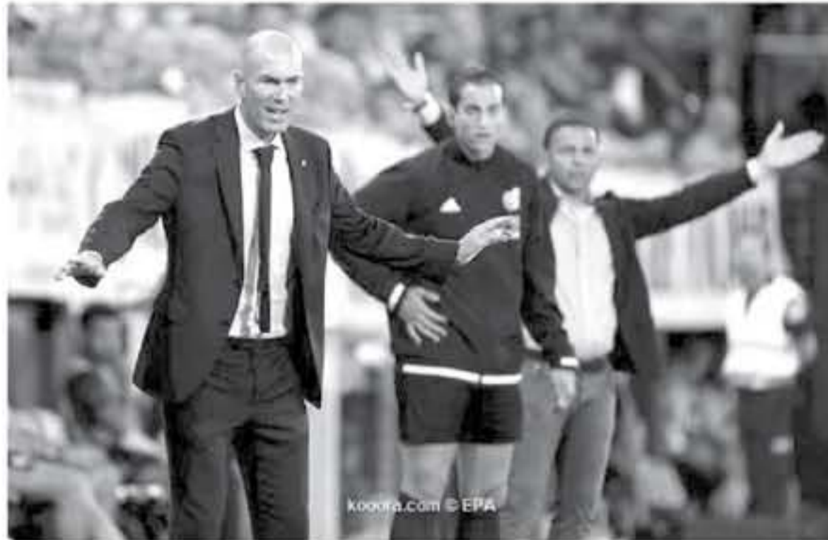
العاشر بعد الخسارة 0-1 ضد برشلونة، ووقتها تمت إقالته وتعيين سانتياجو سولاري بدلاً منه. يُذكر أن زيدان تولى القيادة الفنية للميرنجي بنهاية الموسم

سلفك تشرير صحفي إسباني، الضغوط على الخطأ في زيدان المدير الفني لريال مدريد، هذا الموسم ومشاركته مع الموسم الماضي الذي بدأ جولان تويستجي على رأس القيادة الفنية للميرنجي، وبحسب صحيفة «موندو ديبورتيفو»، بعد مرور 3 جولات، حصد زيدان 5 نقاط من أصل 9 ويحتل المركز الخامس بفارق 4 نقاط عن المتصدر أتلتيكو مدريد، بينما الموسم الماضي كان يحتل الفريق المركز الثاني خلف برشلونة بفارق الأهداف فقط برصيد 9 نقاط، وكان تويستجي قد قاد الملكي للتصاعد على خيتافي وجيرونا وليجانيس، وسجل الفريق 10 أهداف واستقبل هدفين، بينما هذا الموسم فاز الميرنجي على سيلتا فيجو وتعادل مع بلد الوليد وفاريال، وسجل 6 أهداف واستقبل 4، وأشارت الصحيفة، إلى أن تويستجي مع الفريق كان في الوصافة حتى الجولة السادسة حين تعادل مع أتلتيكو قبل أن يتراجع للمركز التاسع في الجولة