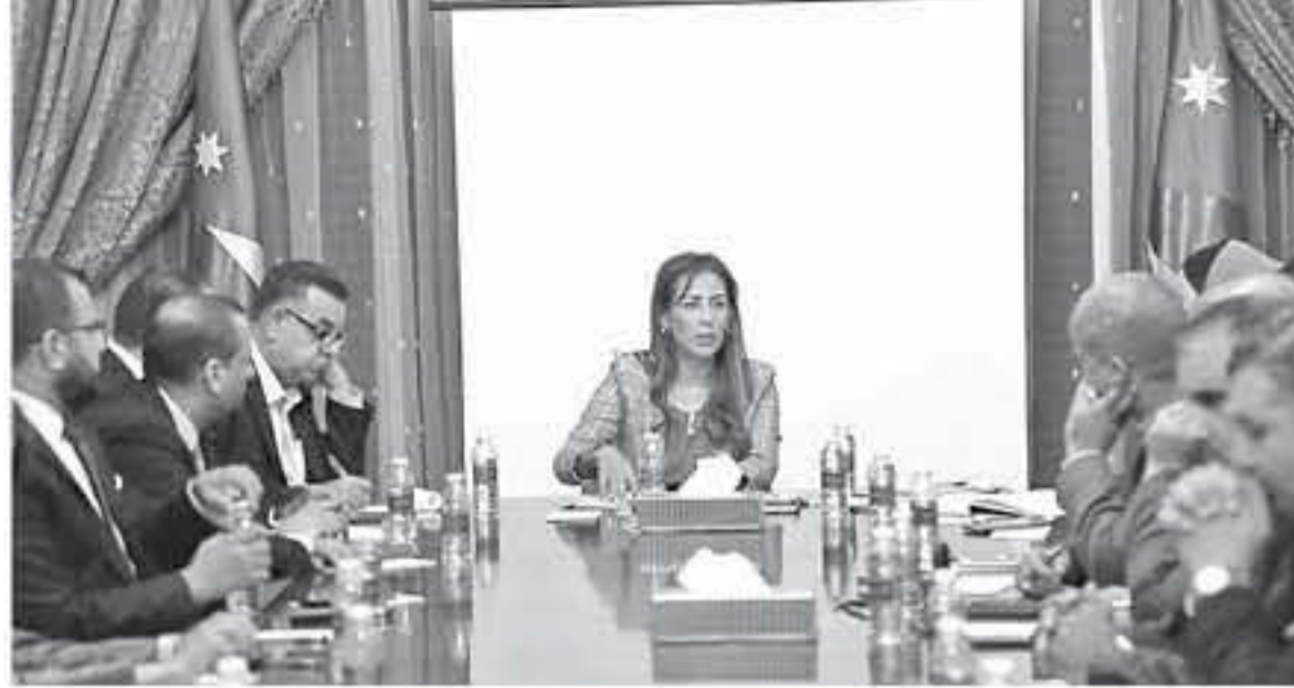
الأنتاب - عمان

فالأردن سياساتها الحكيمه، استطاعت أن تتعامل بكل ائزاز وبعد نظر مع العديد من القضايا المختلفة، بما يصب في مصلحتها، ونحو اتخاذ خطوات جادة وبناءة لعلاقات صحية مع محيطها العربي