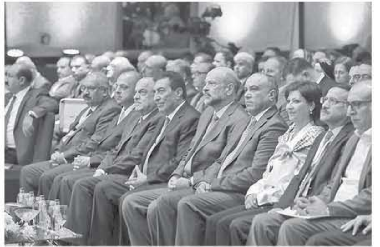
الأبطال - البحر الميت