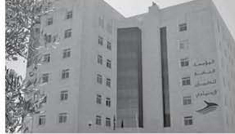
وبين أن هناك شروطاً للحصول على الراتب، منها ان يكون المؤمن عليه مدة بتسوية حقوقهم.

اشتراف فعلي لا تقل عن عشر سنوات منها 12 اشترافاً متصلاً ولم يخض على التقاعد عن الشهور بأحكام قانون الضمان أكثر من خمس سنوات محسوبة من بداية الشهر الثالث للشهر الذي أوفت فيه اشترافه بالضمان وحتى نهاية الشهر الذي توفي فيه. وأشار إلى أن هناك أكثر من 1100 أسرة المؤمن عليه متوفى خارج الخدمة ستفيد من هذا التعديل حتى لو حدثت الوفاة في سنوات سابقة بشرطه ان تطبيق على حالة المؤمن عليه المتوفى الشروط المذكورة، وكذلك يشمل من تمت تسوية حقوقهم بصرف تعويضات الدفعة الواحدة لورثة المستحقين على ان يتم إعادة كامل مبلغ تعويض الدفعة الواحدة قبل تخصيص راتب الوفاة الطبيعية.