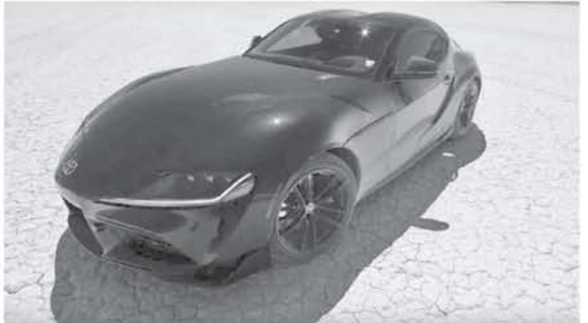
ديبي - محراب جي تي

نتيجة المحاولة الأولى بوصول سيارة تويوتا سوبرا موديل 2020 إلى سرعة 333,3 كم/س (165 ميل/س)، ولكن المحاولة الثانية وثقت وصول أحد أجدد سيارات تويوتا 2020 إلى سرعة قصوى تبلغ 312,3 كم/س (193 ميل/س) قبل أن هناك محددة سرعة قصوى إلكتروني منع السيارة من الزيادة على هذا الرقم.