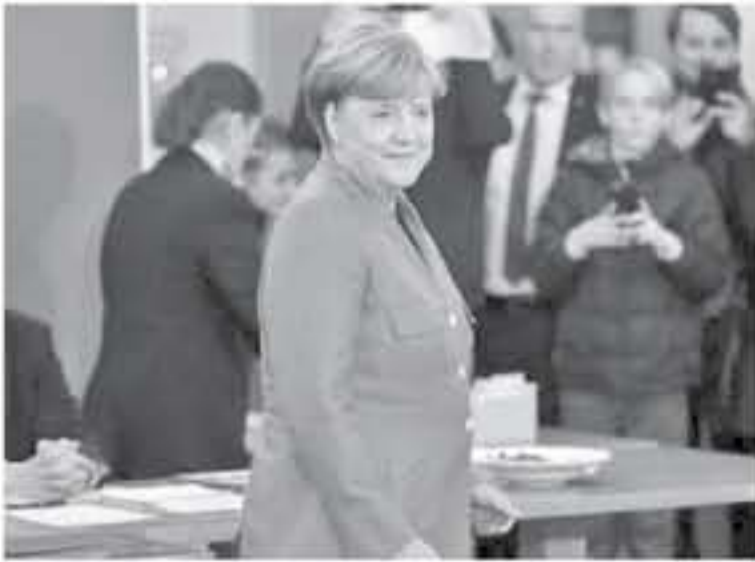
بيكين - وكالات

التجاري مع الولايات المتحدة إذ أنه يواثر على الجميع.