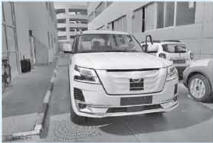
ديبي - محراب جي تي

عمودي هضبي اللون مطلي بحمل كلمة PATROL، وهناك تحديثات واضحة على تصميم الصدام الخلفي الذي حصل على زوايا مربعة وعلى مشت الهواء الخلفي والجناح المثبت فوق غطاء الصندوق الخلفي. كما توضح صور سيارة نيسان باترول 2020 المرسمة التجميع على هويتها العائلية مع كسوة جديدة فاخرة وزخارف عالية الجودة، ولم يخل الصانع الياباني على ما يبدو بتوفير تقنيات متطورة تساعد السائق على القيادة. من المرجح أن تعتمد سيارات باترول