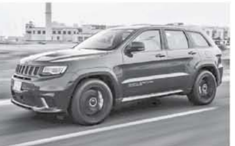
ديبي - محراب جي تي