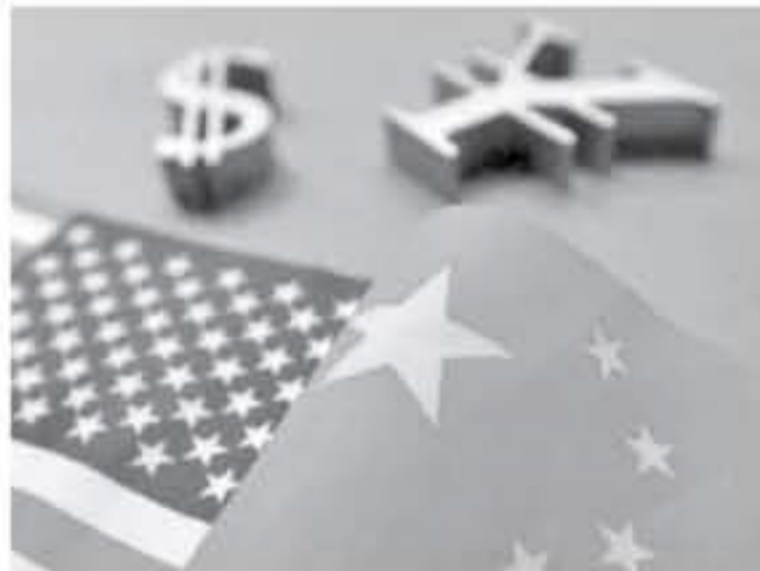
سان فرانسيسكو - وكالات

أشار بحث نشره مجلس الاحتياطي الاتحادي هذا الأسبوع إلى أن الشكوك التي تحيط بالسياسة التجارية، والتي يوقعها النزاع التصاعدي لإدارة ترمب مع الصين تعني أن الناتج الأمريكي سيقدّر 200 مليار دولار، في حين سيخسر الناتج العالمي 850 مليار دولار حتى أوائل العام القادم.