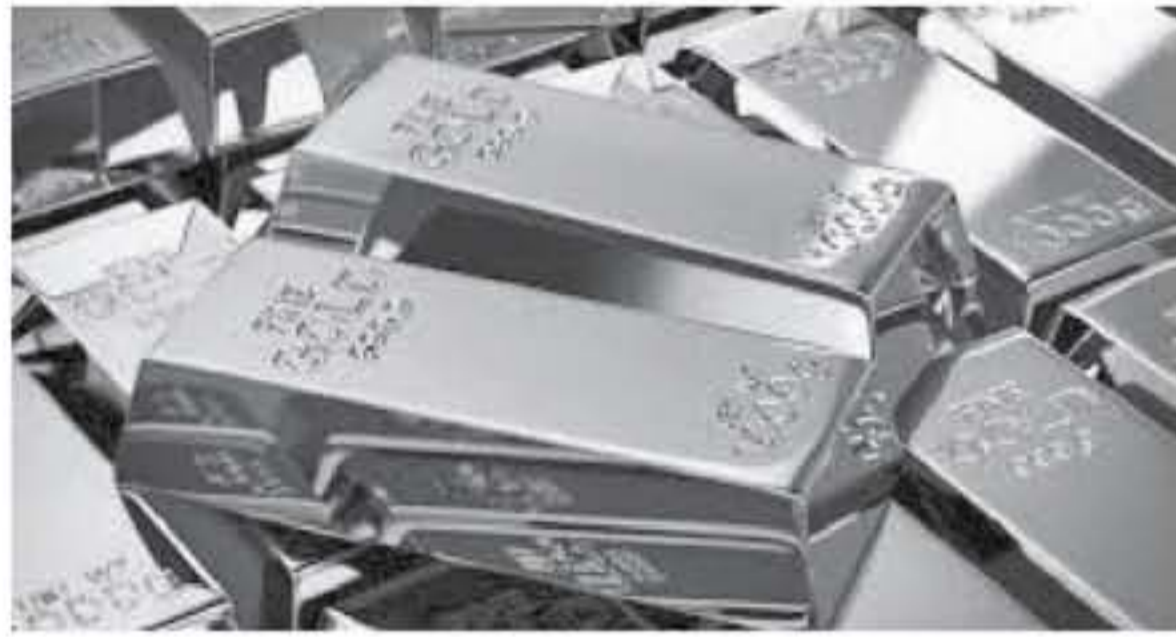
سنغافورة - وكالات

ظللت أسعار الذهب تتعرض لضغوط أمس الجمعة، في الوقت الذي تسببت فيه بيانات أمريكية قوية للمستثمرين على العودة إلى الأصول العالية المخاطر مما أضر بالطلب على المعدن الأصفر الذي يُعتبر ملاذاً آمناً. وذهب البلاتين أيضاً للانخفاض ثلاثة