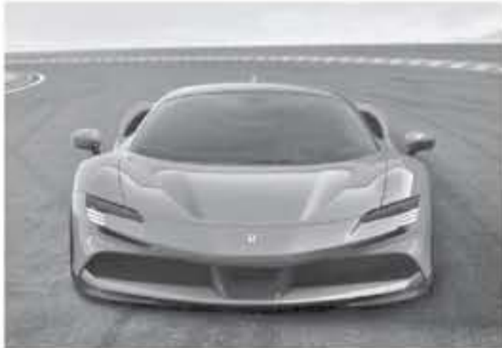
ديبي - محراب جي تي

أكبر هذه المصائب هي الوزن الزائد الذي يعتبر أكبر معضلة في عملية صنع سيارات خارقة، فكما نعلمون تتميز السيارات السريعة بخفة الوزن فهذا العامل يؤثر على أداء السيارة بشكل هائل، ولكن عملية صنع سيارات خارقة هجينة يزيد من هذا الوزن بسبب استهلاك السيارات لأكثر من محرك إلى جانب وزن البطاريات، ومهما حاولت الشركة من تقليل وزن السيارة التي تعمل بهذه التقنية يبقى أعلى من سيارات فبراري التي تعتمد على محرك البنزين فقط، مما يسبب لفيراري الشعور "بالآثام" كما وصفه Michael Leiters، ولكن الحل كان يدفع الشركة ليعود أعلى ليصدر من المحركات أرقام أعلى قادرة على التسارع بأرقام قليلة بالنسبة لوزن السيارة، وإلى جانب هذا تم استخدام الكربون فايبر بكثافة أكبر في هذه السيارات.