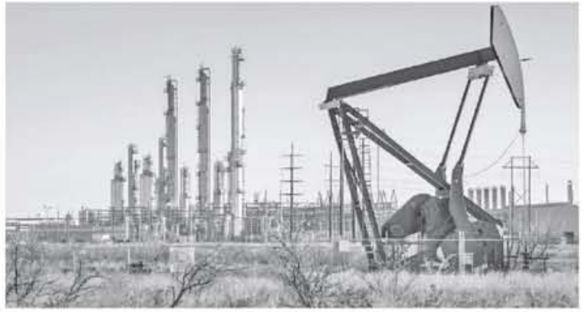
طوكيو - وكالات

استقرت أسعار النفط أمس الجمعة، مع اتجاه الخامين القياسيين برنت وغرب تكساس لتحتلن مكاسب أسبوعية في ظل تراجع كبير لخزونات النفط الأمريكية، بينما انحسرت التوترات التجارية بعد اتفاق واشنطن وبيكين على إجراء محادثات ريفية المستوى الشهر القادم.