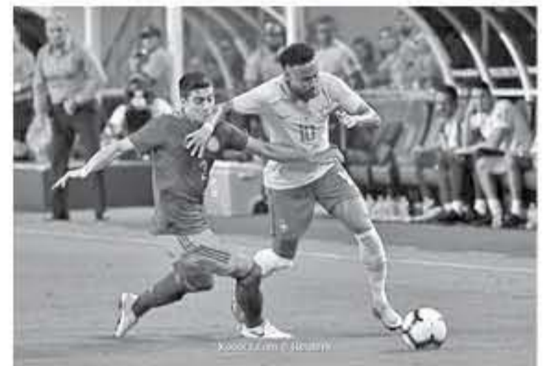
ميامي - وكالات

أصبح لويس موريل أول كولومبي يسجل هدفين في شباك البرازيل، لكن المباراة الودية في ميامي، الماضية، انتهت بالتعادل (2-2). وتقدمت البرازيل بهدف بعد 20 دقيقة، بضربة رأس من كاسيميرو، عقب ركلة ركنية نفذها نيهار العائد إلى تشكيلة المنتخب، بعد الغياب عن مشوار التتويج بكونيا أمريكا للإصابة. وتعادل موريل من ركلة جزاء بعد ست دقائق، بسبب خطأ من أليكس ساندرو، ثم منح التتويج لكولومبيا قبل 11 دقيقة من نهاية الشوط الأول، عندما سد بقوة في الشباك إثر لعب جماعي رائع. وتطور أداء البرازيل