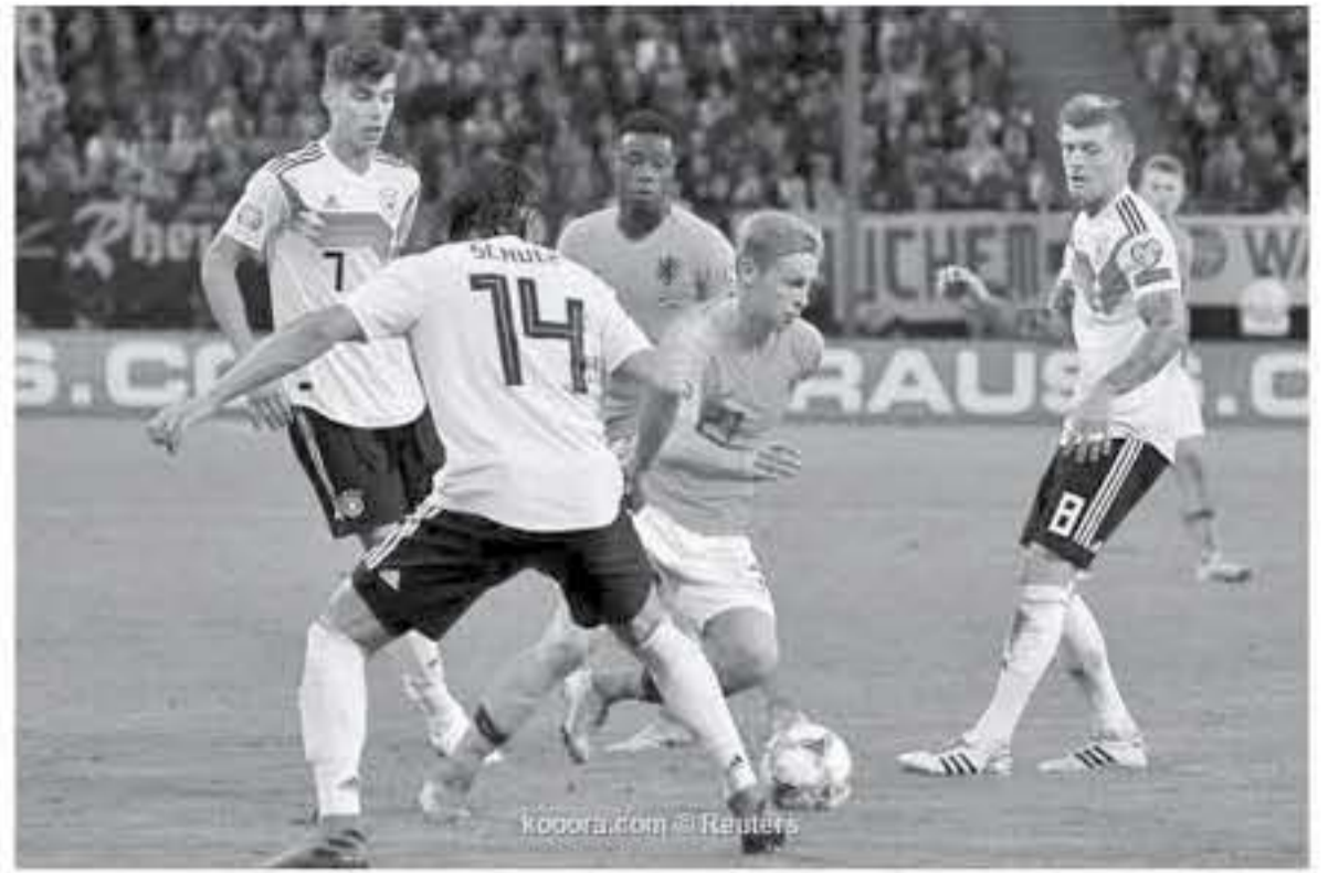
برلين - وكالات

منتخب الطواحين الثار من سقوطه أمام الألمان (2-3)، على ملعب يوهان كرويف أرينا، في مستهل التصفيات. وجاء الرد بطريفة أكثر قوة، ليرفع الطواحين رصيدهم إلى 6 نقاط في المركز الثالث، بينما تجهد رصيدهم ألمانيا عند 4 نقاط، في المرتبة الثانية، لكنها لعبت مباراة أكثر من هولندا، وغابت الخطورة عن المرمين في الدقائق الأولى، في ظل سيطرة هولندية على مجريات اللعب، قبل أن يصل الألمان بأول فرصة عن طريق تسديدة بعيدة المدى،