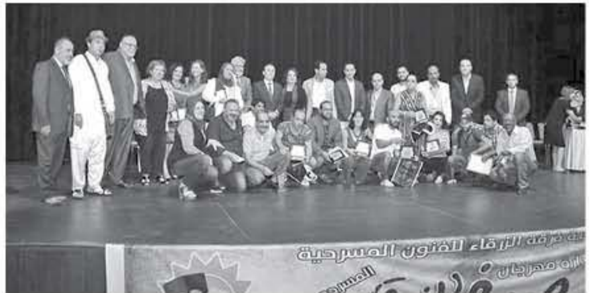
مهرجان هيف الزرقاء المسرحي السابع عشر