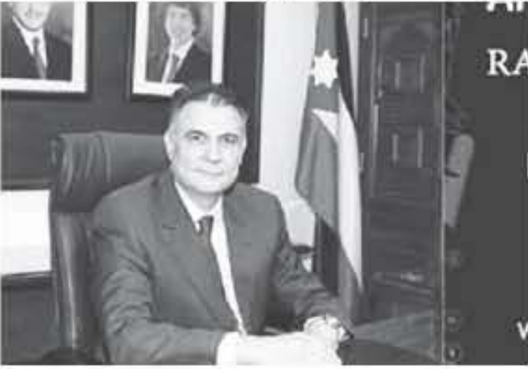
الانباط . السلط

والعالي وتكثفت هذه الجهود اليوم بعد صدور تصنيف التايمز العالمي المرموق بدخول الجامعة لنادي أفضل ١٠٠٠ جامعة عالمية في سابعة تاريخية تسجل الجامعة والتعليم العالي الأردني. وعليه فإننا في جامعة البلقاء التطبيقية نهنئ هذا الإنجاز التاريخي لجلالة الملك عبدالله الثاني صاحب الرؤى الثاقبة والتي تسند منها عزيمتنا على التلمذة وتحقيق الإنجاز طمو الإيجاز لنبي عن حسن ظن قيادتنا بنا، واننا كذلك نهنئ هذا الإنجاز لكل فرد في أسرة الجامعة البلقاء ولكل أسرة أردنية حيث لا يتكاد يحلو كل بيت منها من طالبها في جامعتنا الفتية، كما نهدية إلى كافة مؤسسات التعليم العالي الأردنية. وأكد أن ما حقق من إنجاز يستلزم منا العمل بجهد أكبر في الأيام القادمة للمحافظة على الخبز والتقدم أكثر وأكثر في كافة ميادين التعليم العالي والبحث العلمي، وامتعا نقول حق لكل أردني وعربي أن يتخبر بهذا الإنجاز الذي حفته الجامعة. وكنا سنسبح على العهد في القيام بواجباتنا الوكيفة البيا بكل إخلاص وتفان.