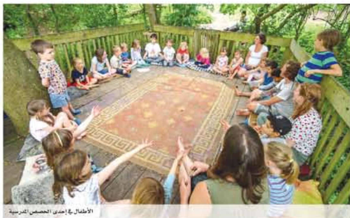
الأطفال في إحدى الحصص الدراسية