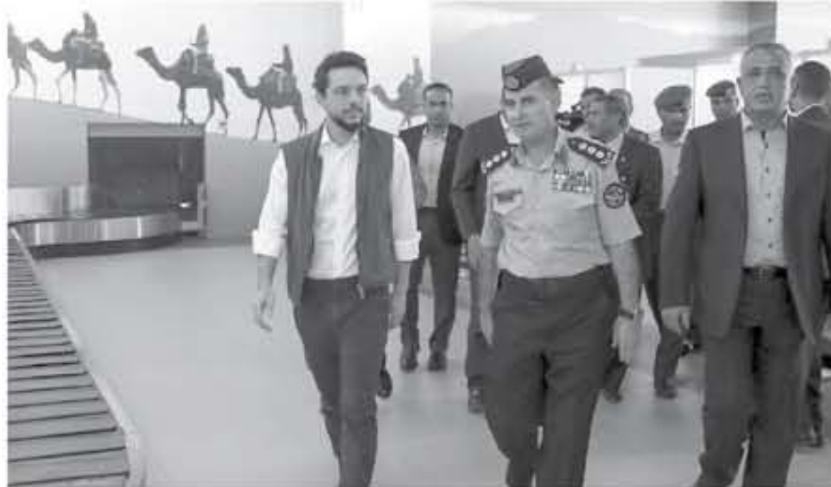
الانباط - العقبة

تفقد سمو الأمير الحسين بن عبدالله الثاني ولي العهد، امس، جاهزية مطار الملك الحسين الدولي في العقبة لاستقبال الزيادة في الرحلات السياحية القادمة عبر المطيران منطقتي الطفلة التي ستبدأ مطلع الشهر المقبل. وتابع سمو ولي العهد، خلال جولة له في مرافق المطار، إجراءات استقبال المسافرين، وصولاً ومقارفة.