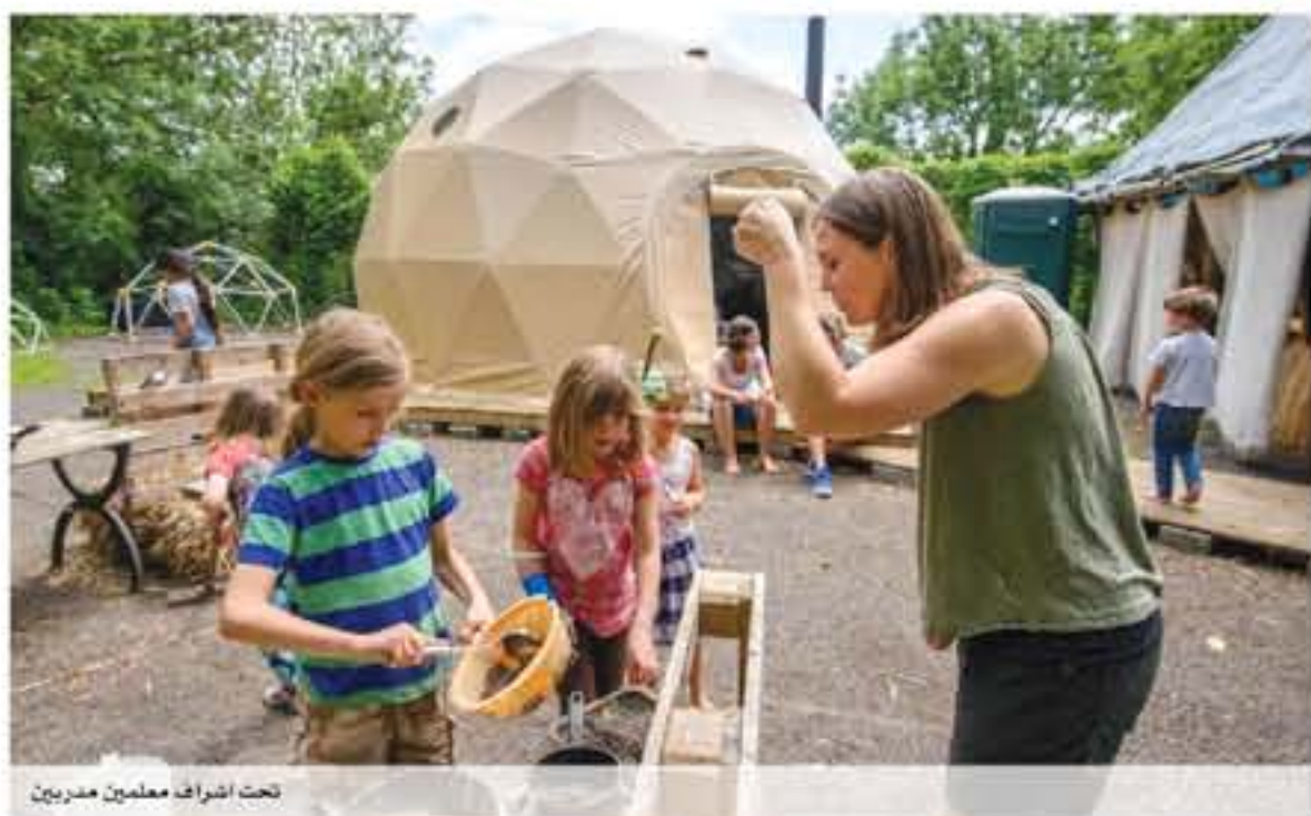
تحت إشراف معلمين مديريين