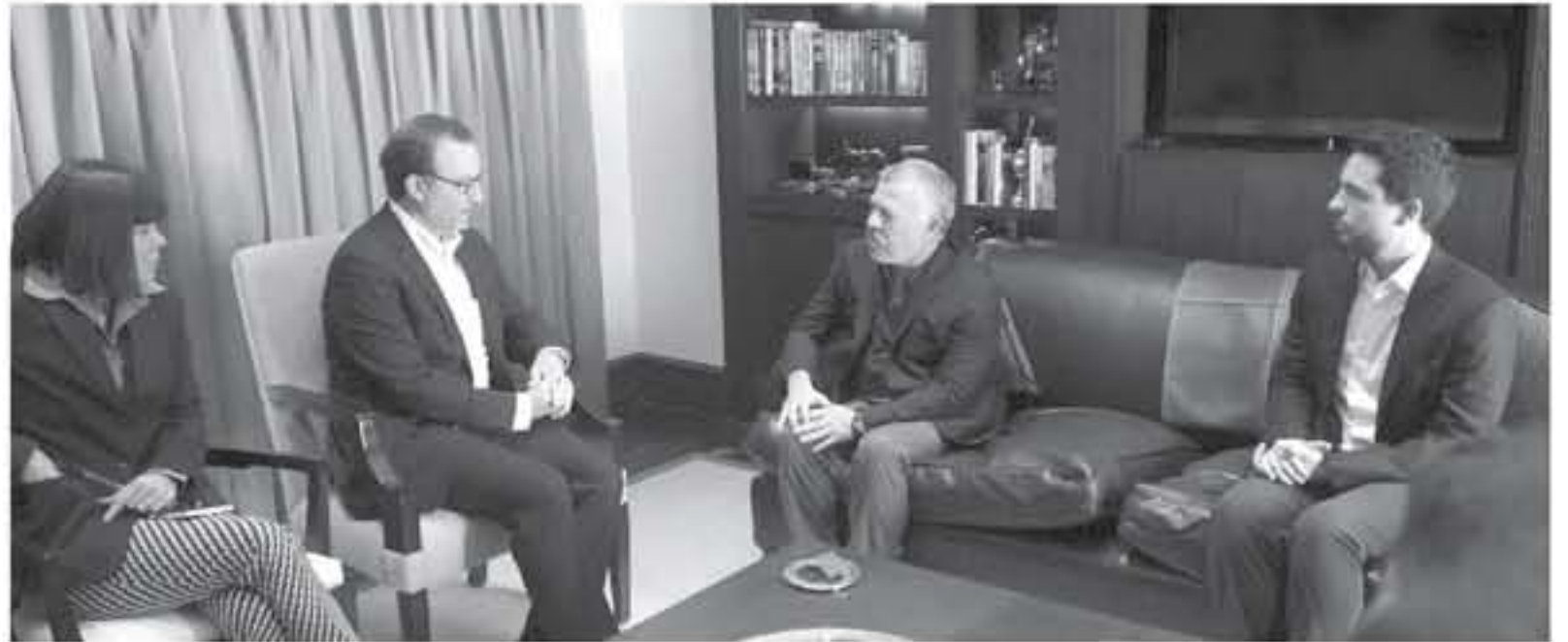
الانباط - العقبة

استقبل جلالة الملك عبد الله الثاني بحضور سمو الأمير الحسين بن عبدالله الثاني ولي العهد، امس، مساعد وزير الخارجية الأمريكي لشؤون الشرق الأدنى ديفيد شينكر، الذي يزور الأردن ضمن