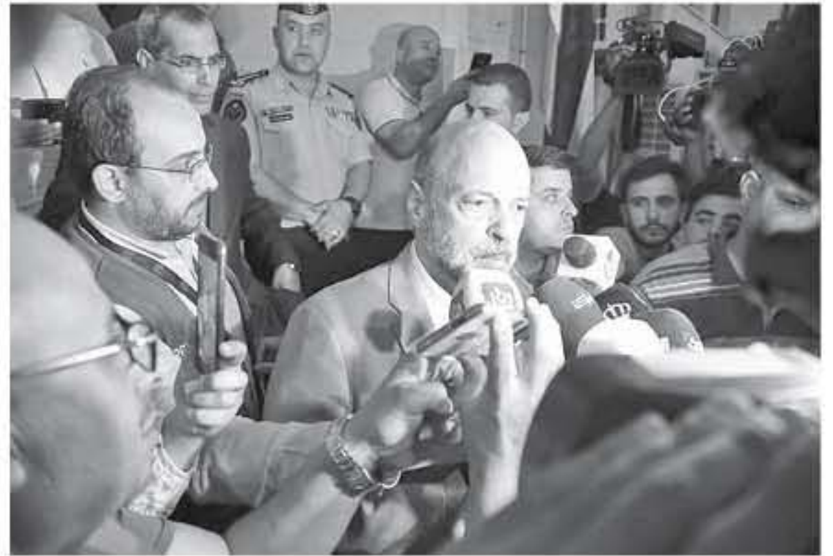
الابتاط - عمان

أكد وزير التربية والتعليم وليد الغماني ان الفريق الحكومي ونقابة المعلمين اتفقا على تأجيل اجتماعهم الذي عقد في وزارة التربية والتعليم امس الاربعاء وعقد اجتماع اخر اليوم الخميس للاجتماع