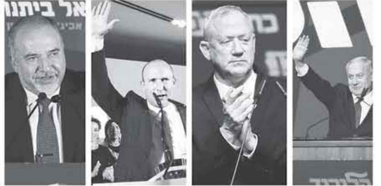
القدس المحتلة - وكالات

ووفقًا لتقارير الحبارية، فإن نتيهاو وغانتس لا يمكن أن يشكلوا حكومة، ما يعني أن السيناريو الأول يتمثل بأن يعطى الرئيس رؤوفين ريفلين، من قبل نتيهاو وغانانتس، مهمة تشكيل حكومة وحدة بالتناوب، بينما هو وأن يكون نتيهاو رئيسًا أول للوزراء. وأشارت إلى أن فرصة تنفيذ مثل هذا السيناريو ربما متوسطة وثابتة أكيدة، وستكون أقرب للضعف لأسباب مختلفة منها ما يتعلق بالنهج السياسي لنتيهاو، إضافة لضعفها في القضايا الداخلية، إضافة لتضايقها لغيرها عدم خوض انتخابات أخرى. في حين أن نتيهاو قد يواجه اتهامات وقضايا أمام المحاكم ما يدفعه للاستقالة. أما السيناريو الثاني، فهو حل "الكليست" والتوجه لانتخابات جديدة مثلما حدث سابقًا من خلال تكليف نتيهاو بتشكيل الحكومة ومن ثم فشله