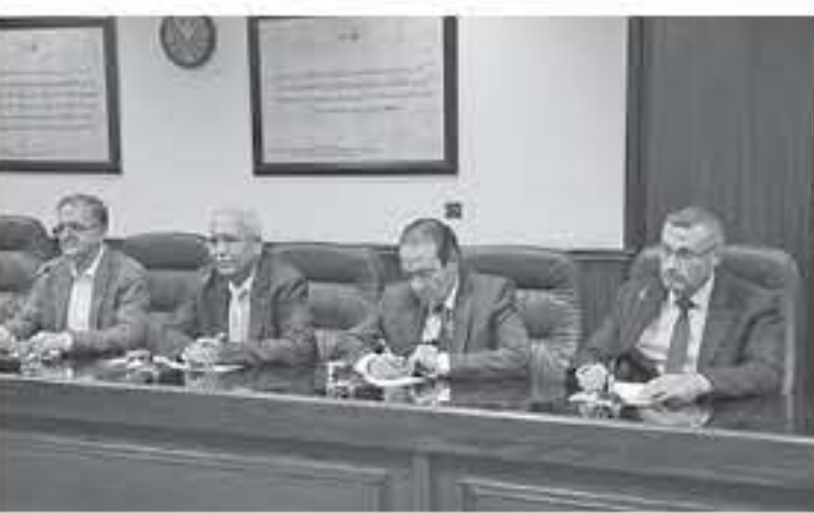
الابتاط - عمان

البيديات للحد من التمازوات التي قد يكتنفها شبهات فساد، مؤكداً أهمية العمل المشترك للوقاية من الفساد والتوعية من أضراره.