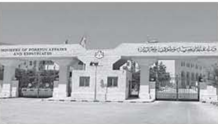
الابتاط - عمان

تأمين عودتهم سالمين إلى أرض الوطن حيث سيصلان مساء اليوم الأربعاء إلى مطار الملكة علياء الدولي.