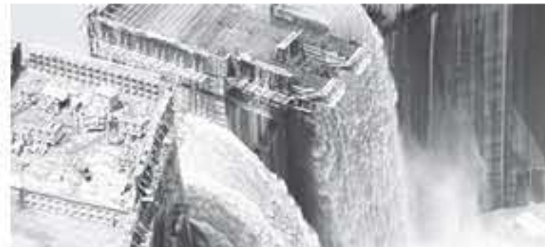
الانطباق - وكالات

كشفت مذكرة وزعتها وزارة الخارجية المصرية على الدبلوماسيين الأسبوع الماضي، عن خلافات أساسية بشأن سد النهضة، حول التدفق السنوي للمياه التي يبيح أن تحصل عليها مصر وكيفية إدارة عمليات التدفق أثناء فترات الجفاف. وأوضحت المذكرة التي تحمل تاريخ ١٢ آب ٢٠١٩، إن إثيوبيا رفضت دون نقاش حطها المتلفه بجواب رئيسية في تشغيل سد النهضة "المعلق الذي تبنيه أنيس أبابا على نهر النيل، كما رفضت القاهرة في الوقت نفسه مقترح إثيوبيا واعتبرته "مجحماً وغير منصف". وقالت "للأسف رفضت إثيوبيا دون نقاش المقترح مصر وامتعت من حضور الاجتماع السادس. وأضافت أن إثيوبيا اقترحت بدلا من ذلك اجتماعاً لوزراء المياه مناقشة كيفية ضمان مقترحها من عام ٢٠١٨. وكشفت أن الترتيب على أن المرحلة الأولى من المراحل الخمس للمسد ستستغرق عامين، وفي نهاية المطاف سيتم ملء خزان السد في إثيوبيا إلى ٩٤ متراً وتصبح جميع توربينات