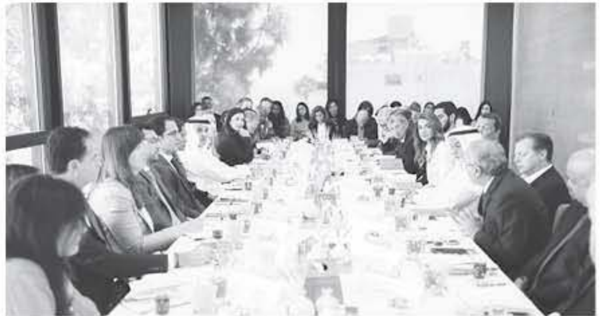
الانباط - عمان

اجتماعاً رفيع المستوى في عمان الخيرا لبحث أزمة اللاجئين والتعليم. وجاء الاجتماع في أعقاب المائدة المستديرة رفيعه المستوى التي عقدت على هامش المنتدى الاقتصادي العالمي في دافوس شهر كانون الثاني الماضي بحضور جلالة الملكة رانيا، ومشاركة الرئيس التنفيذي لقطعة