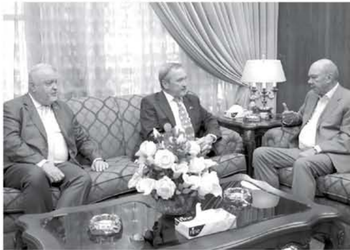
على الزبيد، والسفير التشيكي لدى المملكة جوزيف كاولسكي. وحضر اللقاء امين عام مجلس الاعيان اخلال السلام والامن في المنطقة. بقيادة جلالة الملك عبدالله الثاني من اجل تهيئة المياه والسياحة، متمنا دور الاردن بين البلدين الصديقين وخاصة في مجال

بحث رئيس مجلس الاعيان فيصل الفايز، خلال لقائه في مكتبه بدار مجلس الأمانة امس نائب رئيس لجنة الشؤون الخارجية بمجلس النواب التشيكي جيري كوزبا، العلاقات الثنائية بين البلدين الصديقين وسبل تعزيزها بمختلف المجالات. وقال الفايز للقاء الأوضاع الراهنة في المنطقة وخاصة ما يتعلق بالقضية الفلسطينية والأزمة السورية، وأهمية الدور الذي يمكن ان يلعبه الاتحاد الأوروبي لتسكين الشعب الفلسطيني من حقوقه المشروعة، وانهاء الأزمة السورية. واشرب الفايز عن تقديره للسوروي الرفيع الذي وصلت اليه العلاقات الاردنية التشيكية في العديد من المجالات ولاسيما السياسية والاقتصادية القائمة على الاحترام المتبادل. من جانبه عبر كوزبا عن اعتزازه ببلاده بامتياز الرفيع الذي وصلت اليه العلاقات التشيكية الاردنية، مؤكداً ان بلاده تسعى لتعزيز علاقتها مع الاردن وهذا يعكس بالرعاية والاهتمام من حكومة بلاده وبين ان هناك مجالات عديدة للتعاون بين البلدين الصديقين وخاصة في مجال