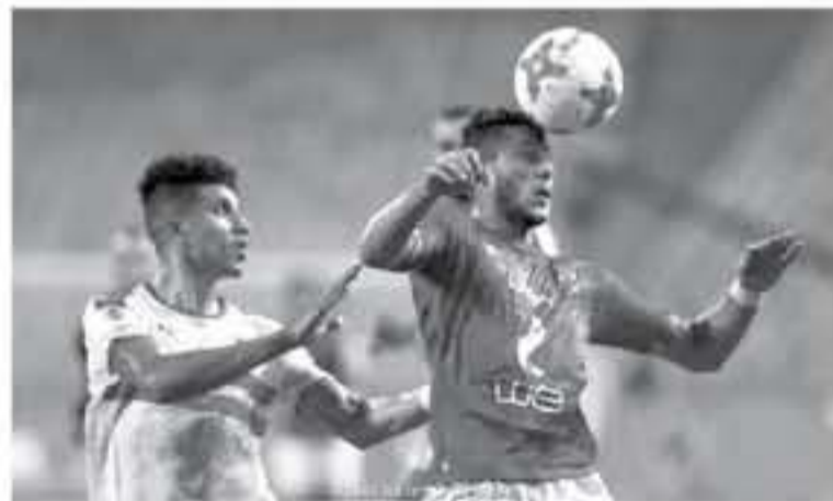
مع قلعة الحمراء أمام كائو سيورث. لأول مرة منذ فترة طويلة، تشهد مباراة القمة في السوبر المصري ظهور عدد كبير من الوجوه الجديدة، حيث

يترقب محبو الساحرة المستديرة في الوطن العربي بصفة عامة وعشاق الكرة المصرية على وجه الخصوص، لقاء القمة بين الاهلي والزمالك مساء اليوم الجمعة. على كأس السوبر المصري. ويعد هذا اللقاء بمثابة المباراة بطوروف متباينة حيث تميل الكفة حسب بعض الخبراء. لزمالك كونه الأجهز قلباً ومعنوياً ليحصد لقب كأس مصر مؤخراً على حساب بيراميدز. بينما وعد الاهلي. كأس مصر مكرماً من دور ال١٦ مما تسبب في إقالة المدرب مارتن لاسارتي والتعاقد مع السويسري رينيه فايلر الذي لم يخض سوى مباراة واحدة