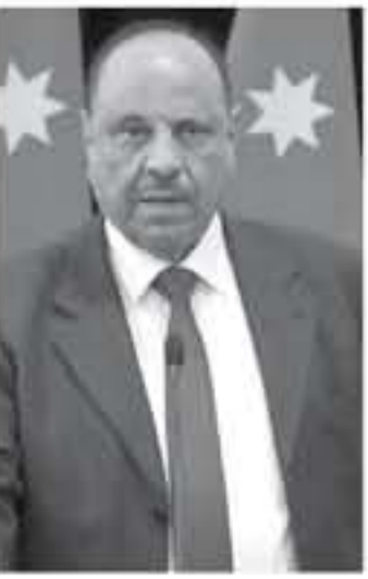
الانباط - عمان

في الضعف على حكوماتنا، لإعادة حالة التضامن العربي على سبيلها السليمة، فهي وعدنا الضامنة لروح الطامعين وصد المتربصين... وتبر الطراوة عن الإمانة باسم الاتحاد لأعمال الجبانة التي تعرضت لها السعودية، كما صبر عن الدمع بحار العملية السياسية في العراق الشقيق، منكمما فترقب تطورات الأوضاع في سوريا الشقيقة وهي التي تلخص شيئاً فشيئاً من شرو الإرهاب وزمره الضلالة، داعين لكل مساعي العملية السلمية التي تحفظ أمن ووحدة واستقرار سوريا أرضاً وشعباً. وأضاف " نبارك للأشقاء في السودان التوصل لاتفاق تقاسم السلطة خلال المرحلة الانتقالية، ولؤكد أيضاً دعماً ووفاءنا إلى جانب مساعي التوافق في الشقيقة ليبيا، ونابع الطراوة، وفي تونس، نبارك للأشقاء عزيمهم وأصرارهم على مواصلة مسيرة الديمقراطية بأبهي صورها، وأما جراح اليمن فما زال جسد الأمة معها وهناً، فأرض اليمن النعميد، أصبحت مسرحاً للتدخل الخارجي، مضيقاً علينا ان ندعم كل المساعي الصادقة لاستعادة الأمن والاستقرار فيه على قاعدة وطنية خالصة عنوانها الشرعية. بدوره، اشكر الشوابكة إلى أن اللجنة التنفيذية بدأت أعمالها في دورتها الـ ٢٦ لتلظر في توصيات اللجنة الصغرة حيث تم إقرار تعديلات النظام الداخلي للاتحاد و سيتم النظر بقرارات وتوصيات الفريق القانوي حول القوانين الاستراتيجية للإرهاب والمراء والطفل. وستقوم اللجنة برفع ما توصلت إليه إلى مؤتمر رؤساء البرلمانات العربية خلال مؤتمر الاتحاد الثلاثين الذي سيعقد آذار المقبل في أبو ظبي. والشعب البرلمانية العربية المشاركة في الاجتماع هي المملكة الأردنية الهاشمية والامارات والبحرين والجزائر والسعودية وسورية والصومال والعراق وسلطنة عمان وفلسطين وقطر وجزر القمر والكويت ولبنان ومصر والمغرب واليمن.