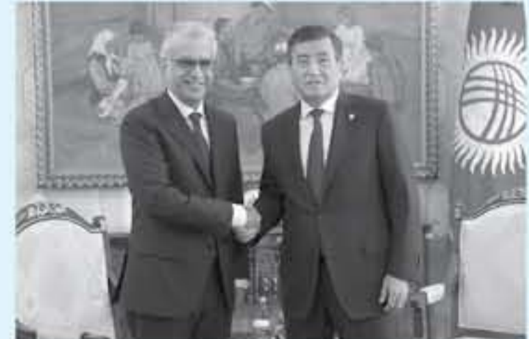
في عدد من دول منطقة وسط آسيا. وعبر الشيخ سلمان عن سعاده بزيارة

أشاد الرئيس سورولباي جينيبكوف رئيس جمهورية قيرغزستان بالإنجازات التي حققتها الاتحاد الآسيوي لكرة القدم على صعيد النهوض بمنظومة اللعبة في مختلف دول القارة مبدياً ارتياحه للدم الذي يقدمه الاتحاد القاري لدعم مسيرة كرة القدم في جمهورية قيرغزستان. جاء ذلك أثناء استقبال رئيس جمهورية قيرغزستان في العاصمة بشكيك الشيخ سلمان بن ابراهيم آل خليفة رئيس الاتحاد الآسيوي لكرة القدم النائب الأول لرئيس الاتحاد الدولي لكرة القدم وذلك في مطار الزيارة الرسمية التي يقوم بها رئيس الاتحاد الآسيوي للبلاد ضمن جولته