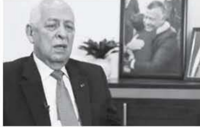
الانباط - عمان

وتوعيتها في مختلف القطاعات، يعكس مدى الجهود المبذولة لخدمة مختلف شرائح المجتمع.