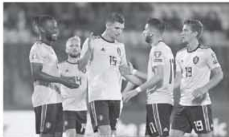
أوروغواي لتحل سادسة (١٣٩ نقطة). أما منتخب إسبانيا فقد هفز مركزين. نقطة، يليه منتخبان كرواتيا وكولومبيا

حافظ المنتخب البلجيكي على تصدره لتصنيف الشهر، الصادر عن الاتحاد الدولي لكرة القدم "فيفا"، بينما تبادل المنتخبان البرازيلي والفرنسي المركزين الثاني والثالث ووفقاً للموقع الرسمي للفيفا، فإن بلجيكا استمرت في صدارة التصنيف مكتسبة ٦ نقاط (١٧٢٢ نقطة)، بينما تقدمت فرنسا فرنسا للمركز الثاني برصيد (١٧٢٥ نقطة). في حين تراجع البرازيل للمركز الثالث بخسارة ٧ نقاط كاملة (١٧١٩ نقطة). وحافظ منتخب إنجلترا على موقعه بالمركز الرابع (١٦٦٢ نقطة)، بينما هفز المنتخب البرتغالي إلى المركز الخامس (١٦٢٢ نقطة). وبعثت