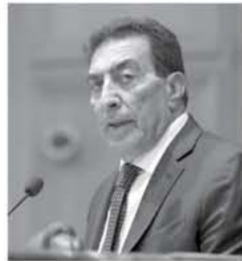
الانباط - عمان

أكدر رئيس الاتحاد البرلماني العربي المهندس عاطف الطراوة، أهمية مواصلة البرلمانات العربية في الدفاع عن القضية الفلسطينية مع دولة الاحتلال. عمان، برفض التطبيع مع دولة الاحتلال. حديث الطراوة جاء لدى ترؤسه اجتماعات اللجنة التنفيذية للاتحاد بحضور الأمين العام للاتحاد فايز الشوابكة، والتي بدأت أعمالها في عمان امس. مؤكداً في كلمة له أن المحتل الذي ما زال يُعَمَّر في طغيانه بحق الشعب الفلسطيني الشقيق وأرضه ومقدساته ويدير ظهره لكل قرارات الشرعية الدولية. وقال: "رغم تعاطف المحرورف، وما يحيط بالأردن من إقليم محتلب إلا أنه بقي صامداً، خير عون وسند لأمتنا، يتأى بنفسه عن التدخل في شؤون الأشقاء، رافضاً كل أشكال التجارة بالدم، وبقي رغم تزايد التحديات، ولقلب الأخلاف، في خندق أمتنا العربية، لثأركا وراء ظهره كل الضغوطات التي حاولت عبثاً المقايضة على ثوابتنا، فنحن وإن ضاقت بنا ذات اليد، لا نساوم على مبادتنا." وأضاف: بينما نتبع في الأردن بحصار متقن، فالأوضاع الاقتصادية صعبة، ورغم هذا كنا المؤثرين على أنفسنا رغم ما بنا من خصاصة، لا نبلخ على أبناء أمتنا، نستقبل اللاجئين والتاجر والجرير والريش ونيس في هذا منة أو فضلا، ولكننا "نستأمر الأمم من واجب أمتنا أيضا أن نلحق إلى جانبنا، في محنتنا العنصرية"، مؤكداً، ينبغي متمسكين بثوابتنا في الدفاع عن القضية الفلسطينية والمقدسات الإسلامية والشرعية في القدس، خلف الوصاية الهاشمية التي يحمل أمانتها جلالة الملك عبد الله الثاني. وأكد أهمية تصدر القضية الفلسطينية سلم أولويات أفكارنا العربية، وأن تعود للتصديرة على أجندة القرار العربي "وأشار: "تفصلنا أيام عن أعمال الاتحاد البرلماني الدولي