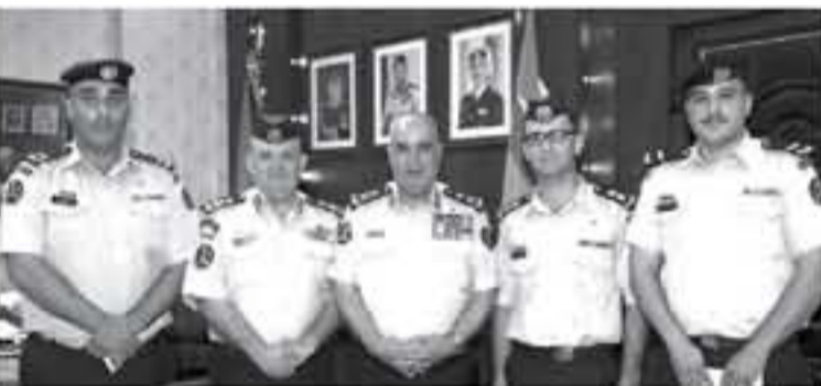
الانباط - عمان

وأشرف اللواء الزباينة على أمانيهم وصفهم وحسن تصرفهم والذي يعتبر قدوة للجميع ومثالاً يحتذى، مشيراً إلى ما يتحلل به منتسبو الدفاع المدني من أخلاق وأمانة مستمدة من ديننا الإسلامي الحنيف وقيمتنا وعاداتنا الأردنية الأصيلة ليبينوا على الصوام موضع فخر واعتزاز كل الأردنيين. من جهتهم، شمن الكرمون هذه اللفتة الكريمة من قيادة جهاز الدفاع المدني، مؤكداً أنهم سيوفون جنوداً أوفياء مخلصين في عملهم وأمينين عليه.