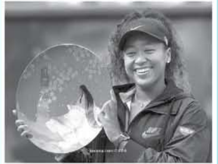
طوكيو - وكالات

أسام كارولين فوزنياكي، وكارولينا بيسكوفا، في نسخة 2019، و2018، عندما كانت البطولة تقام في العاصمة طوكيو، وقالت أوساكا، 21 عاماً، المصنفة الرابعة على العالم، عقب المباراة في تصريحات نشرتها هيئة الإذاعة البريطانية "بي بي سي" "هذه هي المدينة التي ولدت بها والتي منحتني الكثير من القوة خلال خوض كل مباراة تلو الأخرى... أشق اللعب هنا وأتطلع لترويتكم جميعاً في العام المقبل.."