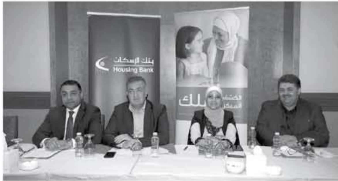
بعد البنك داعماً ورئياً للمسابقة الإعلامية السنوية للتوعية بسرطان الثدي لأعضائها في زيادة مستويات الوعي حول فرص الكف الغير وتقديم الدعم اللازم للتوعية بخطورتها

للمسابقة التاسعة على التوالي، قدم بنك الإسكان - البنك الأكثر اتساعاً في المملكة، رعايته انطلاق المسابقة الإعلامية الحادية عشر للتوعية بسرطان الثدي. وأعلن مدير عام مركز الحسين للسرطان الدكتور عاصم منصور خلال المؤتمر الصحفي الذي عقده المؤسسة في فندق المشراون، عن إطلاق المسابقة بحضور ممثلين عن بنك الإسكان إضافة إلى عدد من الصحفيين والمؤثرين على مواقع التواصل الاجتماعي. وتهدف المسابقة إلى رفع مستوى الوعي بسرطان الثدي، من خلال تفعيل دور الإعلاميين والنشطاء، على مواقع التواصل الاجتماعي لزيادة وعيهم على الرأي العام المحلي.