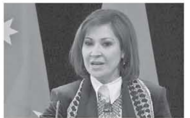
الأنباط - عمان عرضت وزيرة السياحة والأشتر مجد شويكة، التحديات التي تواجه مندوبي مكاتب السياحة والسفر في مطار الملكة علياء، والإجراءات الجديدة التي طبقتها

إدارة المطار بنقل لثمان المخصص لوكلاء ومندوبين المكاتب، ودعت شويكة خلال لقائها في مقر الوزارة، أمين الرئيس التنفيذي لجمعية المطار الدولي كوند، بلجبر، حل هذه التحديات وإيجاد الحلول المناسبة لها بما يخدم الحركة السياحية، وتقديم أفضل الخدمات والتسهيلات وتسيير الإجراءات أمام السياح، مشيرة بتعاون وزارة النقل والدور الذي تقوم به من أجل التناسل للسياح من لحظة وصوله مندوبي مكاتب السياحة والسفر. وأشارت إلى ضرورة العمل على توسيع مظلة الخدمات بنظام E Visa، من خلال التنسيق مع الجهات ذات العلاقة، بالإضافة لتوحيد النواظ وتتنوع وسائل الراحة للسياح داخل المطار، ما يعكس صورة حضارية عن المطار باعتباره وجهة