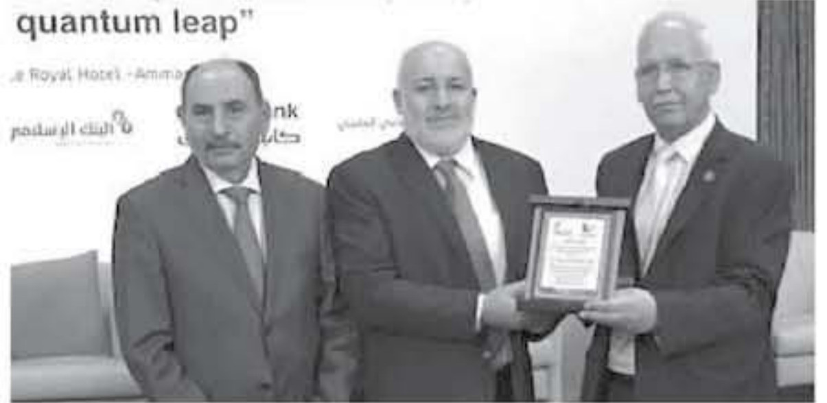
الأنياب - عمان

شارك البنك الإسلامي الأردني بالمرافعة المناسبة للمؤتمر الهندسي الاستشاري الأول بعنوان «نحو نقلة نوعية، والذي عقد برعاية مندوب رئيس الوزراء معالي المهندس صلاح العموش وزير الأشغال العامة والاسكان وتنظيم من هيئة المكاتب والشركات الهندسية في نقابة المهندسين الأردنيين وبمشاركة حوالي 300 استشاري ومهندسين من دول عربية، ويهدف المؤتمر إلى مناقشة قضايا الأربن الهندسية الحاسوبية والتحديات التي تواجه العمل الهندسي الاستشاري وتطوير الشركات