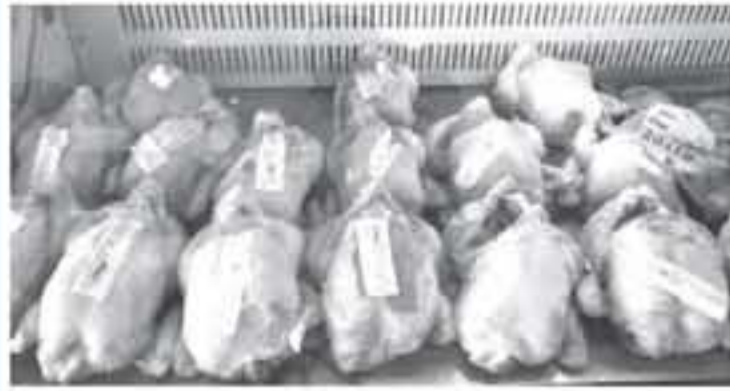
الأنياب - عمان

ارتفعت اسعار لحوم الدجاج خلال الربع الثاني من العام الحالي بنسبة 48% مقارنة مع الفترة ذاتها من العام الماضي. وحسب بيانات دائرة الإحصاءات العامة، بلغ سعر كيلو الدجاج من باب المزرعة 3.4 دينار في الربع الثاني من العام الحالي مقابل 2.3 دينار مع