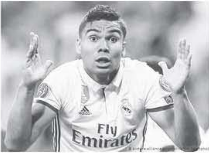
مدير - وكالات

وشنت هجومًا على منزل كاسيميرو وسرقت العديد من الأشياء الثمينة ورغم تواجد زوجة كاسيميرو في المنزل أثناء هجوم اللصوص، ولكنهما في حالة جيدة ولم يتعرضا لأي ضرر. يذكر أن ريال مدريد سبق أن حذر لاعبيه من نشر مقاطع فيديو لمنازلهم على شبكات التواصل الاجتماعي، بسبب حوادث السرقة.