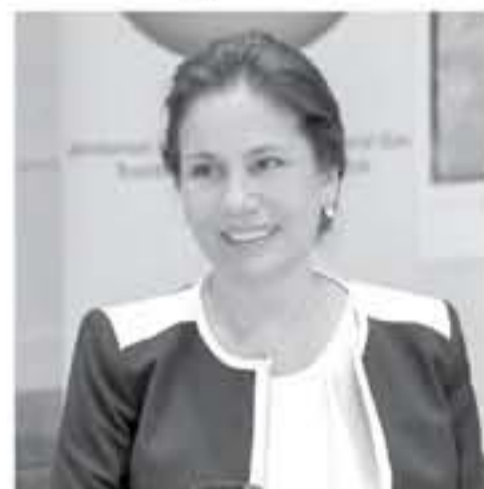
الأنياب - عمان

والاستفادة من طاقة نظيفة مستدامة باستغلال مصادر الطاقة المحلية وتعزيز مساهمتها في خليط الطاقة الكلي. عدا عن الفائدة المتخلفة من المشروع بتوفير المزيد من فرص العمل للأردنيين. وقالت زواتي ان 7 شركات محلية تعمل على تنفيذ المشروع الذي يشمل تركيب أنظمة خلايا شمسية لتوليد