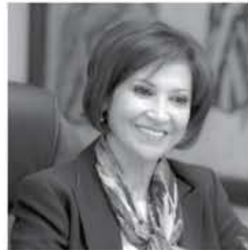
الأنياب - بئرا

نظام التذكرة الموحدة الإلكتروني لزيارة المواقع السياحية والتاريخية والأثرية. وتلقت شويكة إلى أن الوزارة استخدمت هذا النظام الإلكتروني المتطور والموقع التخصصي الذي نتاج فيه عملية شراء التذكرة بيسر وسهولة من قبل الزوار من