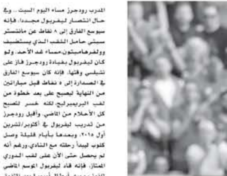
لندن - وكالات

المرب رودجرز مساء اليوم السبت.. وفي حال انتصار ليفرولوكاس هرادكي، فإنه سيوسع الفارق إلى 8 نقاط عن مانشستر سيتي حامل اللقب الذي يستضيف وولفرهامبتون، مساء غد الأحد، ولو كان ليفرولوكاس بقيادة رودجرز فاز على تشيلسي وقتها، فإنه كان سيوسع الفارق في الصدارة إلى 9 نقاط قبل مباراتين من النهاية ليصبح على بعد خطوة من لقب البريميرليج لكنه خسر لتصبح كل الاحلام من الماضي، وأقبل رودجرز على تدريب ليفرولوكاس في أكتوبر/تشرين أول 2015، وبعد ما بأيام قليلة وصل كلوب ليما رحلته مع النادي، ورغم أنه لم يحصل حتى الآن على لقب الدوري الممتاز، فإنه قاد ليفرولوكاس الموسم الماضي للفوز بدوري أبطال أوروبا بعد التلوق على توتنهام في النهائي، وفاز ليفرولوكاس بأول سبع مباريات في الدوري هذا الموسم، لكنه يواجه صعوبات مؤخراً، وفاز ليفرولوكاس 1-0 على شيلد، يونايتد، مطلع الأسبوع وحرط في تقدمه 2-0 أمام ضيفه ريد بول ساكزبورج في دوري