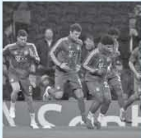
ميونخ - وكالات

أنه قام بواجبات دفاعية، وتابع "أعلم مدى قدرته على المساعدة في الحظ الأمامي وتقديم أداء استثنائي، القيام بواجبات دفاعية كان سبب له المشاكل في بعض الأحيان، ويحل لايزيخ صاحب المركز الثاني برصيد 13 نقطة، ضيفاً على باير ليفرولوكاس الذي يتخسن من مباراة إلى أخرى ويملك نفس الرصيد، ولتقى باير ليفرولوكاس هزيمة كبيرة أمام مضيفه يوفنتوس 3-0، لكنه يأمل أن يستعيد الكثير من قوته على أرضه أمام لايزيخ، ويلعب فرايبورج صاحب المركز الثالث برصيد 13 نقطة أيضاً مع يوروسيا دورتموند الذي يحتل المركز الثامن برصيد 11 نقطة، لكن دورتموند انتخافن التشيكيدي على اللقب، سيدخل المباراة منتشياً بفوزه 2-0 على سلافيا براغ في دوري الأبطال، وقال مايكل زورنك المدير الرياضي لدورتموند "سعداء للغاية ونشعر بالراحة، لأننا حققنا الفوز الأول في آخر ثلاث مباريات، وحتى الآن لم يواجه فرايبورج أي فريق يحتل مركز في