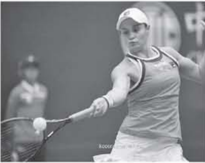
الصين - وكالات

إلى المربع الذهبي للبطولة الصينية للمرة الأولى، ونجحت بارتي في تحقيق انتصارها الثاني على الشواني أمام كيتوفا، حيث تغلبت عليها في طريقها للتتويج ببطولة ميامي المفتوحة في مارس/آذار الماضي، وتلتقي بارتي في الدور قبل النهائي الفائزة في مباراة الثمانية بين إيلينا سبيتولينا وكين بيرتر.