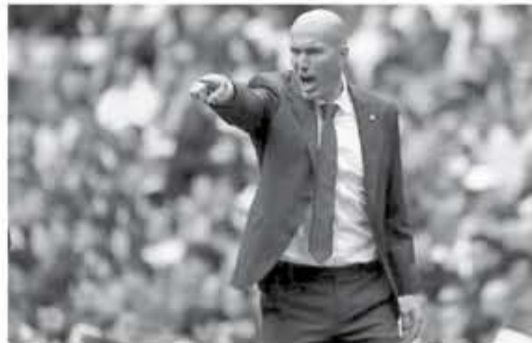
مدريد - وكالات

يتلقى ريال مدريد المتصدر مع غرناطة الوديع، مساء اليوم السبت، ضمن المرحلة الثامنة من عمر الدوري الإسباني، ويتطلع النادي الملكي لاستعادة ثقته بنفسه بعد الكهبة الأوروبية التي تعرض لها مؤخراً، وخروج الريال بتمادل محيط مع ضيفه كلوب بروج البلجيكي بهدفين لكل منهما، في دوري أبطال أوروبا، مما أثار حفيظة وقل الجماهير، وقال زين الدين زيدان مدرب ريال مدريد "الشيء الإيجابي الوحيد هو رد فعل اللاعبين، لأنهم نجحوا في تغيير نتيجة اللقاء، ويستعيد الريال جهود صائلي اللب الكولومبي خاميس رودريجيز والويلزي جارينيت بيل بعد غيابهما عن مواجهة كلوب بروج ويأمل زيدان في نجاح الريال في تصحيح مساره أمام غرناطة بعد اكتمال فوزه الضاري، وقال زيدان "لو كنا أكثر حسماً لسجلنا أولاً