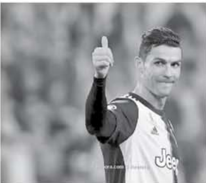
روما - وكالات

الكتفى برفع أصبعه إلى السماء، في حركة تدل على مدى استيائه من إهدار فرصتين محققتين صندماً حارس مرمر ليفرولوكاس هرادكي، أظفت أنه وبعد هذه المباراة في حوار أجراه مع موقع "شورتلين" الإنجليزي، لم يتحدث النجم البرتغالي عن المناقشات التجارية ولا عن إصراره المتواصل للفوز وإنما عن مستقبله المهني قائلاً، "لا زلت أشعر كرة القدم، وأشعر المتحمسين وأشعر من يعشقني، عمري لا يجب أي دور، فالأمر يتعلق بالعلوية فقط"، مضيفاً، "في السنوات الخمس الأخيرة بدأت أعود نفسي على فكرة الحياة من خارج عالم كرة القدم، وبعد هذه المرة الأولى التي يلعب فيها رونالدو وبوضوح عن فترة ما بعد الاعتزال، لكن دون تقديم تفاصيل إضافية حول موعد اعتزاله.