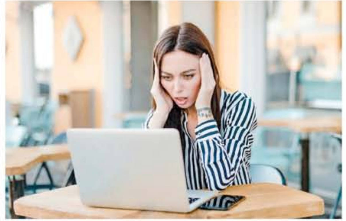
البرازيل - وكالات

أن تحصل المرأة على مقابلات النجاح بسهولة، ولذلك فإن السيطرة الذكورية على الأمور في مجتمعات كثيرة أو ليس في صالح المرأة على الإطلاق، حيث لا يتم تسليمها مهام مناصب قيادية كبيرة لها تأثير على القرار الذي يخشى الرجل أن يكون ضاراً. الاختلافات من حيث الأعداء في العالم المتطور لا يبيد كل إنسان عن رغبته التي تطوي على سيطرة على الجنس الآخر بسبب شدة الفوارق الموجودة حول هذا الأمر، ولذلك فإن الدراسة أخذت آراء ما يقرب من خمسة آلاف رجل وامرأة في أوروبا والولايات المتحدة خلال فترة سنة كاملة، السؤال الرئيسي للرجل كان حول ما إذا كان يفضل أن تكون المرأة صاحبة القرار الذي يؤثر على حياته بشكل مباشر أو غير مباشر، والسؤال للمرأة كان حول قبولها بالأعداء التي تحول دون توليها منصباً قيادياً، كانت الردود على الشكل التالي، نسبة 20 في المائة فقط من الرجال قالوا أنهم يفضلون التصرف بحسب قرارات امرأة في منصب قيادي، إلا أن 50% أجابوا بعدم القبول بالخضوع لقرارات نسائية، بينما امتنع 30% منهم عن الرد، أما النساء فإن نسبة 90% تفضلن أن يعزرن القرار غير منطقي. ما هذه الأعداء وما هو رد المرأة عليها؟ هناك أعداء غير منطقيين، أو بالأحرى غير مقبولة في الامتناع عن تعيين المرأة في مناصب قيادية على المستوى الاجتماعي، فما هي أهم هذه الأعداء التي يقولون بأن الرجل هو الذي يستغلها، والرد النسائي البسيط