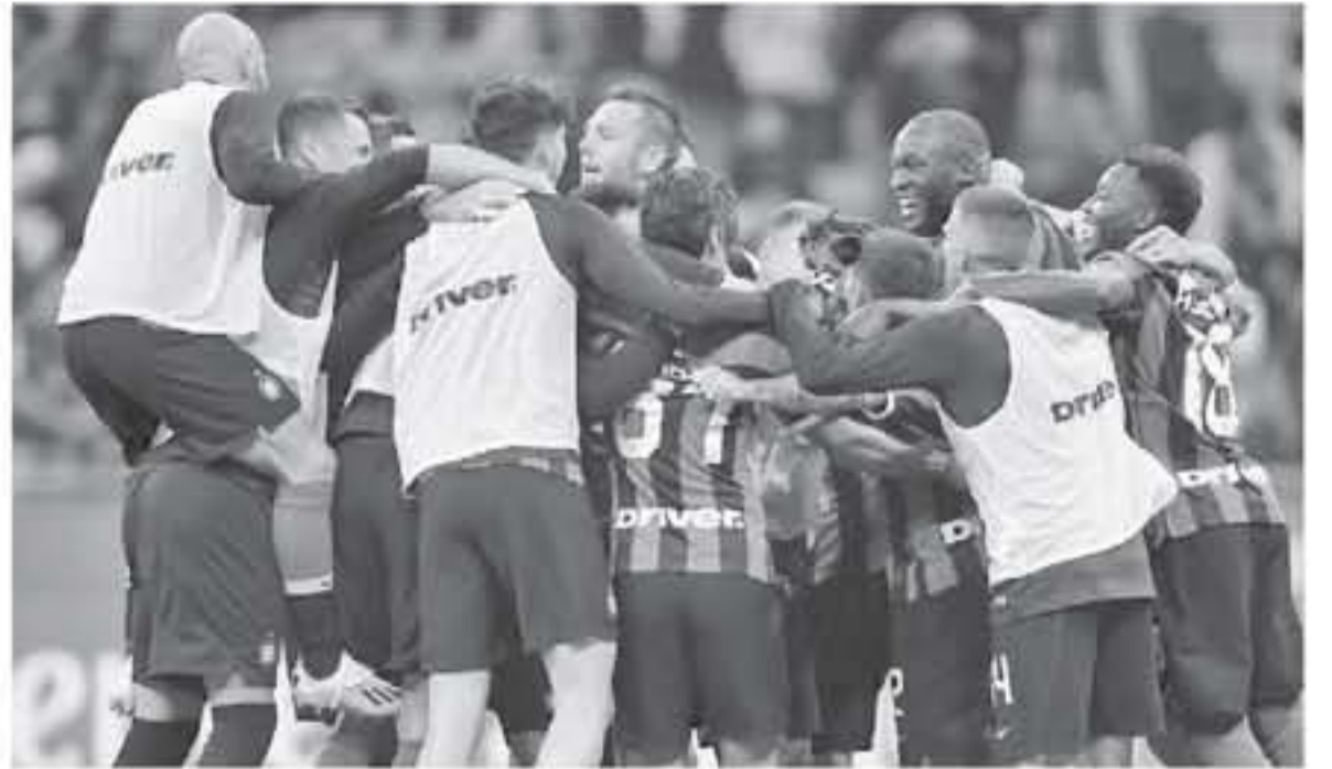
روما - وكالات

مارتينيز، لكن لويس سواريز رد بهدفين لبرشلونة ليخرج الشاذي الكتلوني فازاً بنتيجة 2-1، وستكون مواجهة يوفنتوس ذات معنى استثنائي بالنسبة لأنطونيو كونتي مدرب إنتر ميلان، خاصة وأنه درب السيدة العجوز من قبل، وقال كونتي "بالنسبة للكثير من لاعبينا فهذا هو الموسم الأول في دوري الأبطال، لكن ينبغي أن نكون هذه هي الخطوة