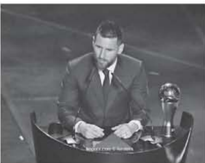
سويسرا - وكالات

الأمر لا يتوقف أبداً على عالم كرة القدم، ولذلك من الصعب للغاية إيجاد وقت للتحدث فيما يخصه، وواصل "عند متاهدة لخطات لك في سنوات ماضية فأنت لسرور قيمة ما حققته، وكيف أن هذا الأمر جميل، وأكمل نجم برشلونة، "هذه اللحظات تجعلك تفكر في أهمية التواصل الاجتماعي اليوم، وأردف، "الاستماع بكرة القدم والحفاظ دائماً على أن تكون نفسك أهم شيء في اللعبة، واستطرد، "كشيء سيحقق إذا كانت هذه هي إرادته، والله يعلم ما فعله، ولذلك فإن الجوائز ستأتي إذا كانت هذه هي إرادته، وأنتم، ولكن أهم شيء هو الحفاظ على ما تشع به كثيراً وكأنت طفل.