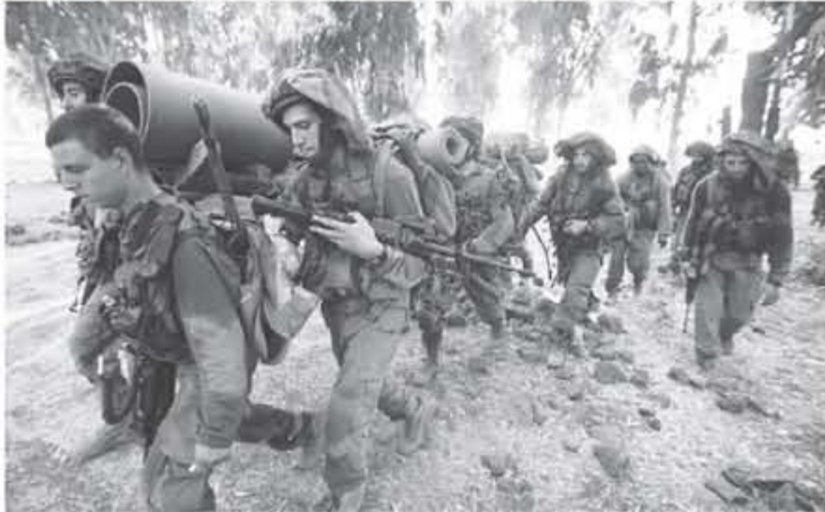
الانباط - وكالات

حدثت صحيفة إسرائيلية، عن حالة عدم اليقين في فترة الاحتلال على التعامل مع أي حرب قادمة، مؤكدة أن الحرب التالية ستهز "إسرائيل" كما لم تهزها في حرب تشرين الأول/أكتوبر 1973. وقالت "يديعوت أحروت"، أن ٦ تشرين الأول/أكتوبر الذي وقعت فيه حرب 1973، "ما زال يبعث للشعيرة في الأجساد، وأسفرت"، وعلى الأقل يفتري به أن يبعث للشعيرة، على فرض أن دوس حرب يوم الغفران (الاسم الذي يطلقه الاحتلال على حرب أكتوبر) قد استلصت وما زالت استلصت، تعلمنا ولا زلنا تعلمها.. ذكرت، "اليوم في موعده قريب من يوم الغفران" القادم، ويشكل نادر منذ أن اجتاحت "إسرائيل" في الدوامه السياسية عديمة المخرج، سببها الكابيت السياسي الأمي للبحث في الوضع الحساس، ولم يعد ممكناً أن نعرف، إذا كان هذا جدياً لم أنه حديث إعلامي.. وتساءلت: "هل تفتح الغرف لتقويتها، هل تهدأ، أم أن كل شيء هو جزء من دعابة التخاطبية متواصلة؟" وذهوت أن "هناك القدام، ويشكل نادر منذ أن اجتاحت "إسرائيل" في الدوامه السياسية عديمة المخرج، سببها الكابيت السياسي الأمي للبحث في الوضع الحساس، ولم يعد ممكناً أن نعرف، إذا كان هذا جدياً لم أنه حديث إعلامي..