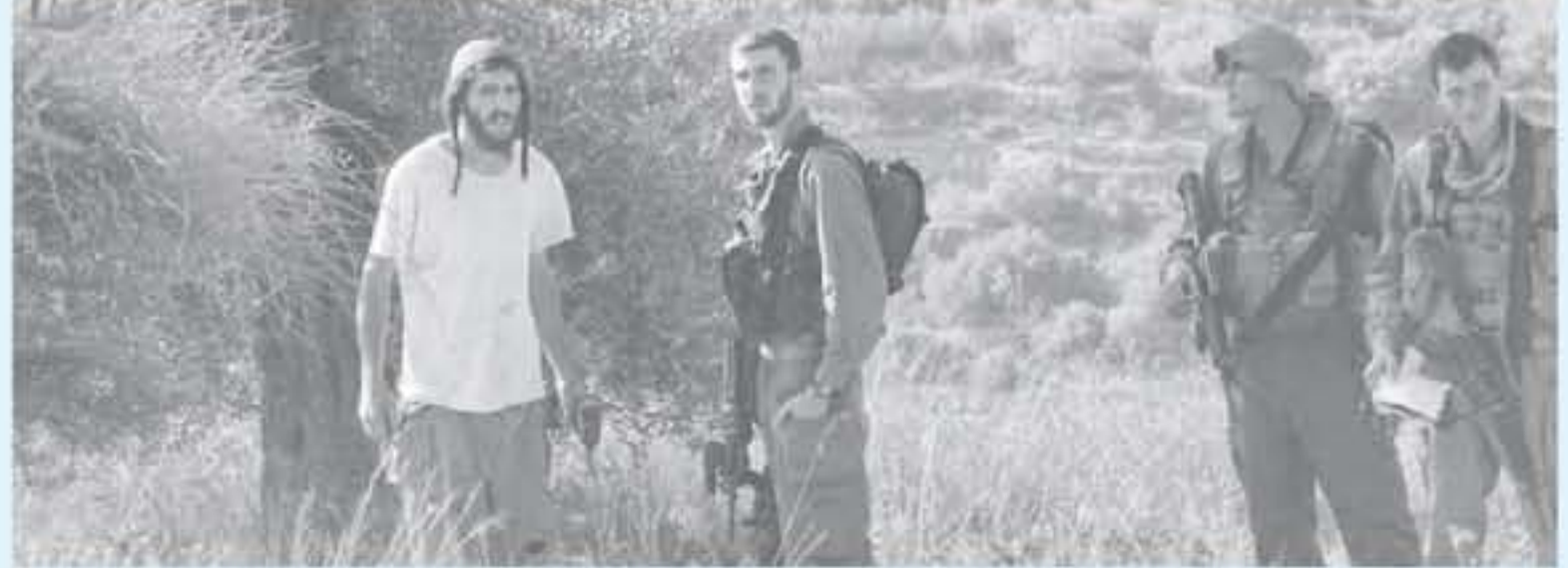
الانباط - وكالات

بمساحة ألفي دونم منذ عشرات السنين.. ويوضح أن الجبل مزروع بالزيتون منذ سنوات طويلة في عهد أجدادهم، وكانت العائلة تقوم برعايته والاهتمام به وحرارة الأرض، ولكن مع حلول عام 2000 أعطت حكومة الاحتلال الضوء الأخضر للمستوطنين، لاحتلال تلك الضفة وقتنا لانتقالية "وأي رمز" قبلوا بوضع البؤر الاستيطانية على أطراف الأرض ومهاجمة أصحابها. ويضيف: "العائلة بدأت منذ ذلك الوقت حين تم تقسيم الأراضي وصفت أراضينا بـ "ج" حيث يعتدي علينا المستوطنون ويحرقون أشجارنا ويسرقون محاصيلنا، وبدأ الاستيطان يتسلسل ويمتد حتى سيطر على معظم الأراضي.. ويبين بأن العائلة توجهت عام 2001 لمحكمة الاحتلال العليا لإثبات حقها في أرضها، وبعد جلسات طويلة وجهود مضنية من المحامين والإسناد الحقوقي أصبح لها بالدخول إلى الأرض، ولكن وقتنا للظروف قاسية، كما لم نتج محاولاتهم بإزالة البؤر الاستيطانية والمساكن المتتلة للمستوطنين. ويبين بأنه يضطر أحياناً إلى التسلل داخل أرضه وأخذ بعض من محصول الزيتون الخاص به، ويشير إلى أن شروط دخول الأراضي تفتتت في وجود حماية إسرائيلية تعمل على حماية المستوطنين