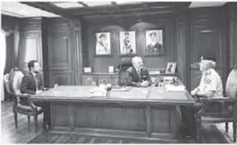
الإنباط - عمان

ومديري الأجهزة الأمنية فترة من الوقت تم خلالها بحث عدد من الأمور والقضايا التي تهم القوات المسلحة والأجهزة الأمنية في مختلف المجالات العمليّة والتدريبية والأمنية. وأشار جلالته الملك عبدالله الثاني، القائد الأعلى للقوات المسلحة، برأفته سمو الأمير الحسين بن عبدالله الثاني ولي العهد، أمس، القيادة العامة للقوات المسلحة الأردنية - الجيش العربي، حيث كان في استقبال جلالاته لدى وصوله رئيس هيئة الأركان المشتركة اللواء الركن يوسف أحمد الحنيطي، ومديرو الأجهزة الأمنية. واجتمع جلالته باللواء الركن الحنيطي