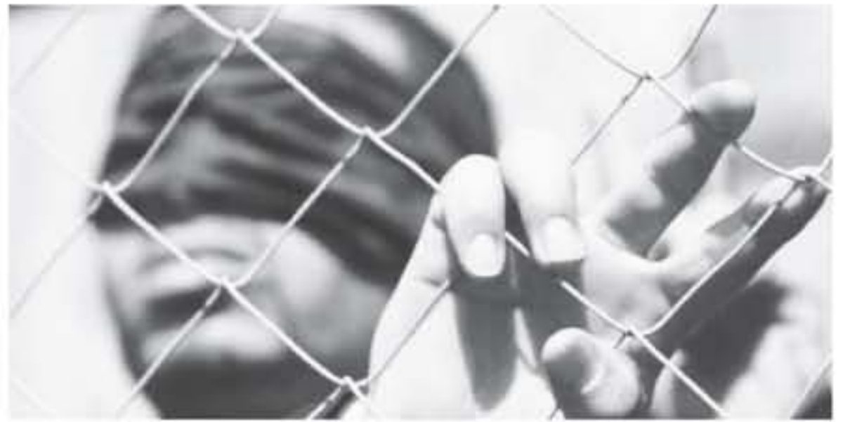
الانباط - غزة

أكد مركز أسرى فلسطين للدراسات بأن الاحتلال هو الكيان الوحيد في العالم الذي يشرع التعذيب بشكل رسمي رغم أنه عضو في اتفاقية مناهضة التعذيب التي تم توقيعها في تشرين الأول من عام 1948. وأوضح المركز بأن الاحتلال بدأ على استخدام مبررات متعددة لإجازة استخدام وسائل التعذيب الوحشية دولياً ضد الأسرى الفلسطينيين مثل "وسائل خاصة واستثنائية أو قنابل موقوتة" وهو بذلك يجد مخرجاً لممارسته التعذيب باعتباره أي معتقل فلسطيني هو حالة استثنائية أو قنابل موقوتة.