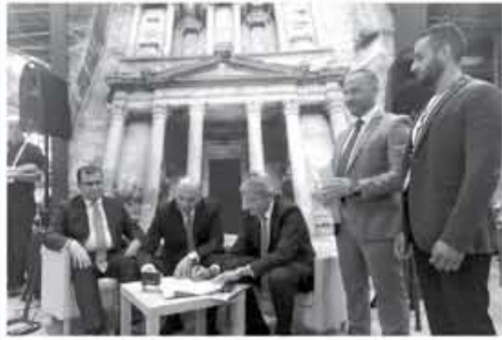
الإنباط - عمان

أوف ترافل، المتغل السياحي الرائد في فرنسا ودعم من هيئة تنشيط السياحة لاستقطاب زحلات سياحية للمملكة يوافق ٢٤-٣٠ رحلة خلال العام ٢٠٢٠ تهبط في مطار الملكة علياء الدولي وتغادر من مطار الملك حسين في العقبة. وأشار إلى ان المعرض ضم عددا كبيرا من شركات السياحة الأوروبية الكبرى العاملة في السوق. كما يتضمن الجناح الأردني العديد من الجوائز الذهبية والهدايا التذكارية والأفلام التسجيلية لعرض المنتج السياحي بألوانه المختلفة من سياحة أثرية وشاطئية وعلاجية ودينية وغيرها. من جانبها عكفت وزيرة السياحة والآثار مجد شويكة على المشاركة حيث قالت ان مشاركة الأردن هذا العام جاء من خلال ١٦ شركة أردنية سياحية كما ساهمت المشاركة في توقيع اتفاقيات استقطاب سياحة اجنبية للمملكة. وأوضحت أيضا ان الجناح الأردني شهد حضورا مميزا خلال فترة إقامة المعرض وإشادة معيزة بالمنتج السياحي الأردني المتنوع وتباينت أيضا انه نتج عن هذه المشاركة في المعرض والتمثلة بـ ١٦ شركة أردنية سياحية توقيع اتفاقيات استقطاب سياحة اجنبية للمملكة. الجدير ذكره ان عدد السياح ارتفع للغاية شهر ابول بنسبة ٤٤٪ ومن المتوقع استمرار ارتفاع الأعداد لهذا العام للعام القادم بنفس الوتيرة.