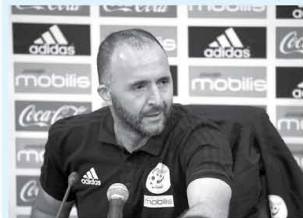
الجزائر - وكالات

أكد جمال بلماضي، مدرب المنتخب الجزائري، أنه منح صوته في جائزة الأفضل بالعالم "دا بيست" المقدمة من الاتحاد الدولي لكرة القدم "فيفا"، للمصري محمد صلاح، نجم نادي ليفريول، عن قناعة. وقال بلماضي خلال المؤتمر الصحفي الذي عقده، أمس الثلاثاء، "منحت صوتي ل محمد صلاح كأفضل لاعب في العالم عن قناعة، لن أفصح عن الأسباب ولكنني متأكد من أن اختياري كان صادقا.. وحصد ليونيل ميسي نجم برشلونة جائزة الأفضل هذا العام، فيما حل المصري محمد صلاح رابعا خلف فان دايك وكريستيانو رونالدو.. وتابع: "بالنسبة لجائزة أفضل لاعب في أفريقيا، أؤمن أن يفوز بها قائد الجزائر رياض محرز، بالنظر إلى السنوات الكبيرة التي قضاها هذا الموسم، سواء مع مانشستر سيتي أو مع منتخب بلاده خاصة في كأس الأمم الأفريقية.. وختم: "محرز سيد منافسة شرسة للتتويج بالجائزة، خاصة من جناح ليفريول.. ساديو ماني، بما أنه ساهم في قيادة منتخب بلاده إلى بلوغ نهائي كأس أمم أفريقيا.."