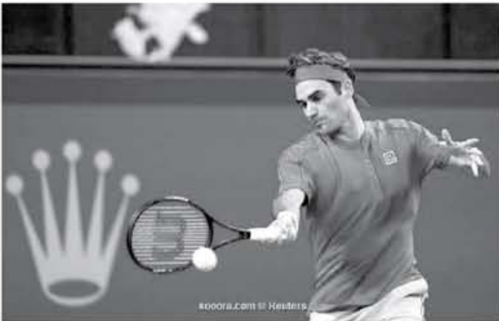
الصين - وكالات

تأهل النجم السويسري روجيه فيدرر، للدور الثالث من بطولة شنغهاي للأساتذة، بعد تغلبه على الإسباني أليبرت راموس فينولاس، بمجموعتين دون رد (6-0، 7-0). وقرض فيدرر، هيمنته التامة على المجموعة الأولى، وحسمها بعد كسر إرسال فينولاس، مرتين، قبل أن يرفع الإسياني مستواه في المجموعة الثانية، ويدفعها إلى شوط كسر التعادل.