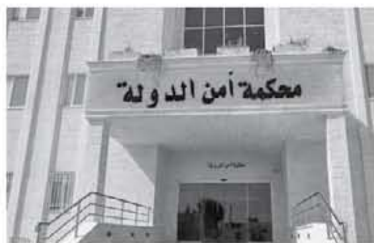
لاستكمال سماع عدد من شهود إثبات النيابة العامة.

أكد شاهد إثبات نيابة عامة بقضية الدخان خلال جلسة مبدئية عقدها محكمة أمن الدولة أمس الثلاثاء، برئاسة العقيد القاضي العسكري الدكتور علي المبيضين، أنه تعرض خلال الأرقام المبدئية لحاولات من مقررين المتهمين اثنين رايسين من أجل تغيير شهادته، واستعدت المحكمة خلال الجلسة اليوم التي عقدت بحضور القاضي المشي الدكتور ناصر السلمان، والقاضي العسكري الرائد صفوان الزعبي، بحضور مدعي عام المحكمة القاضي العسكري الرائد أمجد فارس، إلى شهادتي إثبات النيابة العامة، وقررت الهيئة المحكمة في نهاية الجلسة رفعها إلى يوم غد الأربعاء.