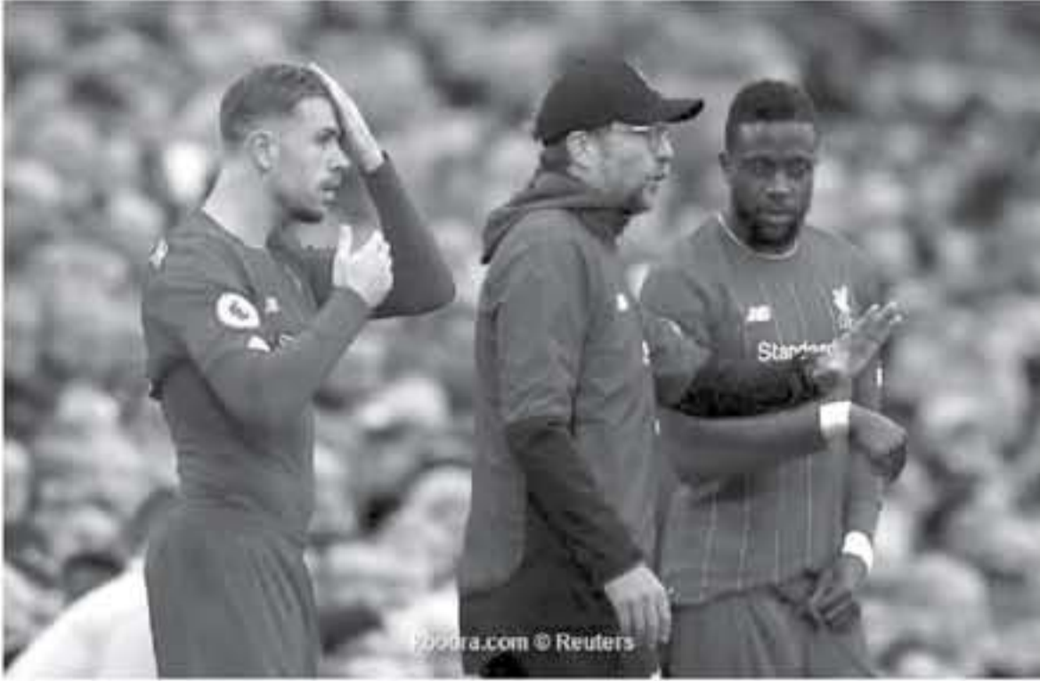
الإنباط - عمان

منذ توليه مهمة تدريب ليفريول قبل سنتين، استطاع المدرب الألماني بيور من كلوب نسج علاقة قوية مع لاعبيه وجماعته "الريدز"، التي تقف باسمه، لا سيما وأنه نجح في إعادة قطار الإنباط إلى سكة الانتصارات، فضلاً عن التتويج بالإنجاب وكان آخرها كأس السوبر الأوروبي أمام تشيلسي العتيق. ويشتهر كلوب بطريقته المميزة في تحفيز اللاعبين، واستخراج أفضل ما في جعبتهم فوق المستطيل الأخضر، بيد أن المدرب الألماني لا يريد على ما يبدو أن يصبح بإمكان الجميع معرفة حديثه مع اللاعبين في غرفة تبديل الملابس، خصوصاً في فترة ما بين التشوطين. وفي هذا الصدد، نقلت صحيفة "إكسبريس" البريطانية عن كلوب قوله "إن نشر فتاة ليفريول في فيديو (وأنسا في غرفة تبديل الملابس)، فإنني سأرحل عن النادي.. وأضاف: "هذه هي الحقيقة. وهذا ما يمكن أن أقوله بخصوص هذا الأمر.. وأتى رد فعل كلوب، عقب ظهور فيديو قبل أيام لجيسي مارسش مدرب فريق