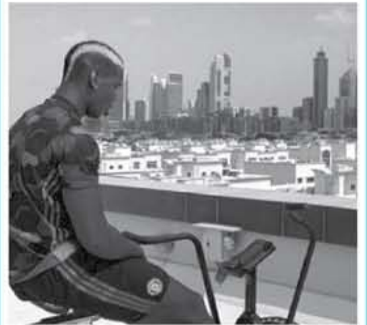
دبي - وكالات

حتى يكون جاهزاً لخوض مباراة ليفربول، يوم 20 أكتوبر / تشرين الأول الجاري.