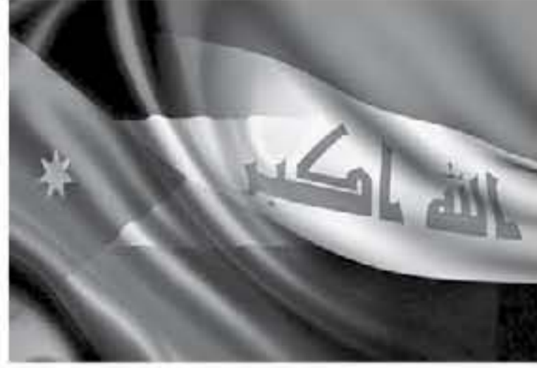
الأنباط - عمان - زمن العقلي