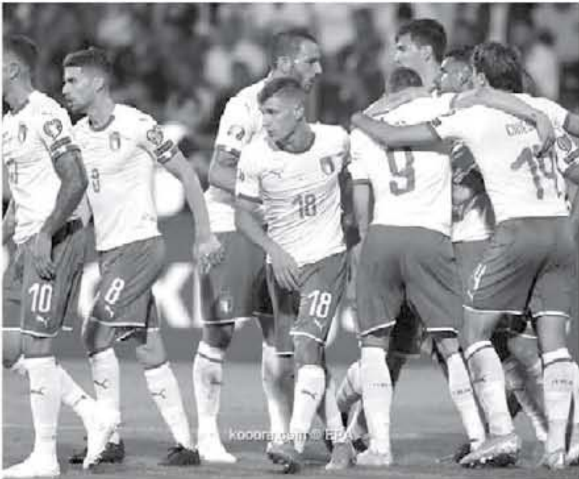
Kooper.com - BPA