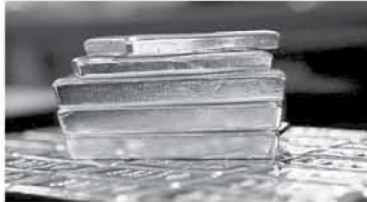
سنغافورة - وكالات

ارتفعت أسعار الذهب امس الجمعة لتستقر داخل نطاق ضيق في الوقت الذي يرتقب فيه المستثمرون المزيد من الوضوح بشأن مسائل تكتنفها الضبابية عاليا بما في ذلك التجارة وخروج بريطانيا من الاتحاد الأوروبي، مما ساعد المعدن الأصفر في تعويض خسائر تكبدها في وقت سابق مدفوعا بأمال تحقيق انفراجة في المحادثات التجارية بين الولايات المتحدة والصين. في غضون ذلك، ربح البلاتينيوم ٠.٢ بالمئة إلى ١٧٠٣.١١ دولار للأوقية بحلول الساعة ١٢:٢٨ بتوقيت جرينتش وتماثل بالقرب من أعلى مستوياته على الإطلاق والذي سجله يوم الخميس عند ١٧٠٤.٥٩ دولار مما يضعه على مسار تحقيق مكسب أسبوعي سبسته نحو الثلث بالمئة. كما يتجه المعدن المستخدم في التحفيز