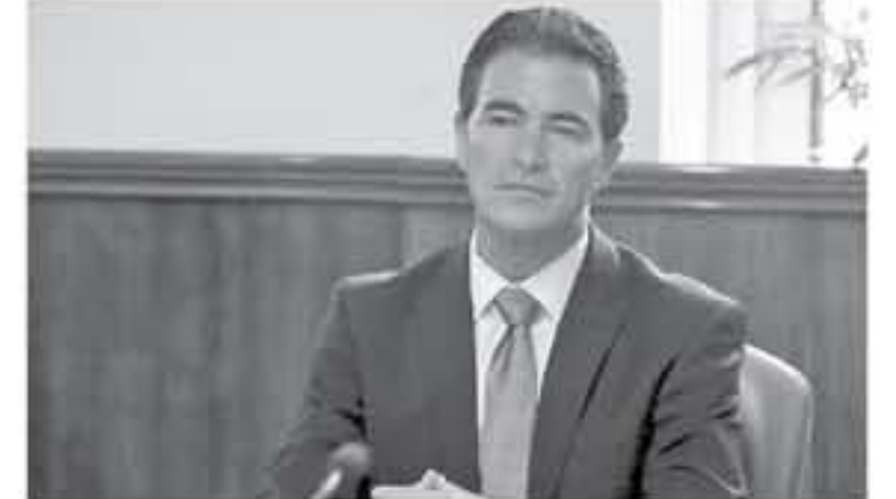
القدس المحتلة - وكالات

الإسرائيلي يوسي كوهين، بأن عناصره اغتالوا مسؤولين للفصائل بحركة المقاومة الإسلامية (حماس) في أنحاء