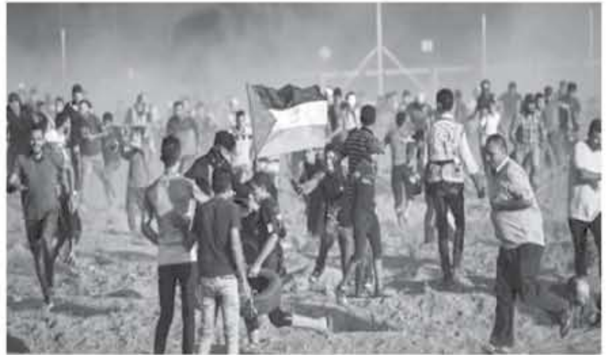
غزة - وكالات

القطاع بإصابة 4 متظاهرين شرق غزة انتان بالرصاص الحي. فصا أصيب 22 متظاهرا بينهم 5 بالرصاص الحي شرق جباليا شمالي القطاع في حين أصيب عدد من المتظاهرين بجراح شرق خزانة جنوب قطاع غزة أحدهم بالرصاص الحي. وكانت الهيئة الوطنية العليا لمسيرات