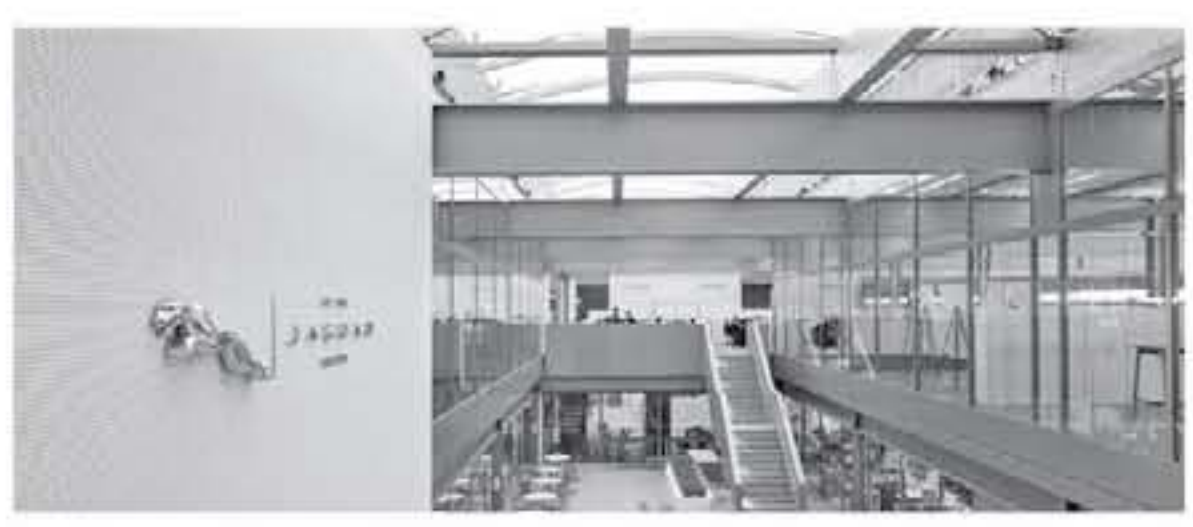
الأنباط - دبي

كشفت شركة «جاكوار لاند رووفر» عن منشآت جديدة في موقعها في غايدون، في مقاطعة دكشير، تعتبر من أكثر الأبنية غير السكنية استدامة في المملكة المتحدة، وأكبر مركز لإنشاء وتطوير منتجات السيارات في البلاد، ويشمل موقع غايدون جزءاً من رؤية «الوجهة سفر» في «جاكوار لاند رووفر» والتي تلعب لاجل المجتمعات أكثر أمناً وصحة وجعل البيئة أكثر نظافة، ويتم التحرك بدءاً نحو هذه الرؤية من خلال الارتكاز المتواصل، وتركيز الشركة على تحقيق مستهدفه صفير الانبعاثات، وهدف حادوث، وهدف ازدهار، في منشآت الشركة ومنتجاتها وخدماتها. ويوجد في غايدون حوالي ١٣,٠٠٠ مهندس ومصمم من ذوي المهارات المرتفعة، يقضون الجيل الحالي والمقبل من سيارات جاكوار ولاند رووفر، كما يعمل المركز الرائد في مجال السيارات