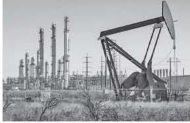
دبي - وكالات

ارتفعت أسعار النفط في تعاملات امس الجمعة بنسبة ٠.٢، لفترة وجيزة بعد حادث الناقل الإيرانية في البحر الأحمر. وهضرت الأسعار إلى ٦٥.٦٥ دولار للبرميل امس الجمعة بعد أن قالت وسائل إعلام إيرانية تعرضت لحادث في البحر الأحمر، لكن توقعات بتراجع الطلب على النفط سرعان ما دفعت الخام للهبوط من مستويات مرتفعة بلغها خلال الجلسة. وسجل خاما النفط الضخامن أكبر ارتفاع يومي منذ ١٦ سبتمبر. وتحسّر الدعم الأوّل الذي تلقاه الخام امس الجمعة من الأبناء الإيرانية مع استمرار التحوّلات، وارتفعت العقود الآجلة لخام القياس العالمي برزت ٦٠ سنتا