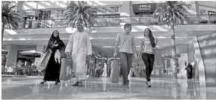
دبي - وكالات

من السائح المحلي لإمارة دبي حاليا، موضحاً أن ٥٨٠ من الدخل يأتي من الترفيه، و١٢٠ من سياحة الأعمال. وذكر أن منطقة الخليج تعد ثاني أكبر منطقة سفرا إلى دبي، ومساهمتها تبلغ ١٢٪ من السياح القادمين إلى الإمارة. ولفت كاظم إلى أن السعودية ستشارك في أكتوبر ٢٠٢٠ إلى ١٠ أبريل ٢٠٢١ في دبي بأكبر جناح بعد الدولة المنظمة وهي الإمارات، مبيّنا أنه ستشارك في أكتوبر ٢٠٢٠ نحو ١٩٣ دولة ويضم ٦٠ هالاية يوميا. وأكد عدم تأثر السياحة في دبي بالحرب التجارية بين الولايات المتحدة الأميركية والصين، مدعلا على ذلك بإرتفاع ترتيب السياح الصينيين من المرتبة العاشرة سابقا إلى الرابعة حاليا بين السياح القادمين إلى دبي.