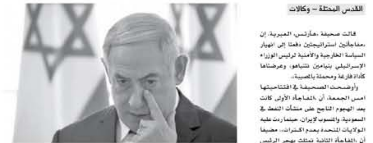
القدس المحتلة - وكالات

قالت صحيفة «هارتس» العبرية، إن مفاجأتين استراتيجيتين دفعتا إلى انهيار السياسة الخارجية والأمنية لرئيس الوزراء الإسرائيلي بنيامين نتياهو، وعرضتها كأداة فارقة ومحتمة بالمضي. وأوضحت الصحيفة في افتتاحيتها امس الجمعة، أن المفاجأة الأولى كانت بعد الهجوم الناتج على منشآت النفط في البحرين، والتسبب لإيران، حينما ردت عليه الولايات المتحدة بعدم الكفارة، مضيفا أن المفاجأة الثانية تمثلت بتهجير الرئيس الأمريكي دونالد ترامب للأكراد، والسماح لتركيا بعملياتها بسوريا.