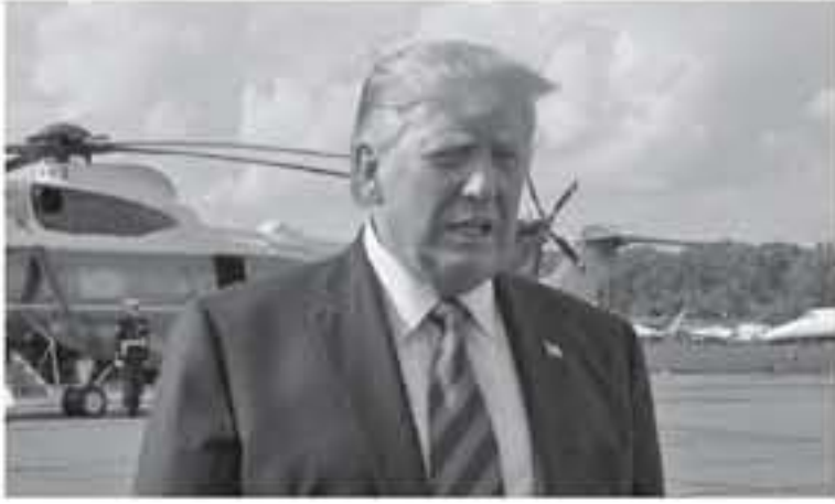
واشنطن - وكالات

مع الصين كجزء من الاتفاق التجاري بين البلدين والذي قد يشهد أيضا تطبيق زيادة التعريفات الجمركية الأسبوع المقبل. ويبحث الاتفاق آلية لعدم تلاعب الصين بقيمة اليوان. الاتفاق العملة الذي تم التوصل إليه في وقت سابق من هذا العام قبل انهيار المحادثات التجارية سيكون جزءا مما يعتبره البيت الأبيض بمثابة القافية المرحلة الأولى مع بكين. وسيتم ذلك المزيد من المفاوضات حول القضايا الأساسية مثل الملكية الفكرية ونقل التكنولوجيا القسري. بحسب ما ذكرته المصادر.