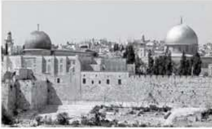
القدس المحتلة - وكالات

تعاوي الجهات المعنية المتفرقة تجاه المسجد الأقصى المبارك. وتقت نغيا قاطعاً، ما ورد من إشاعات غير بعض صفات التواصل الاجتماعي التخريبية والتي تقيد بإبلاغ شرطة الاحتلال موظفي دائرة الأوقاف الإسلامية أنها قررت السماح للمتطرفين اليهود أداء الصلوات العنيفة الجماعية داخل المسجد الأقصى، وأن احتياجات الحراس على أداء هذه الطقوس لم تجد تفعلاً، ولن يُستمع إليها.