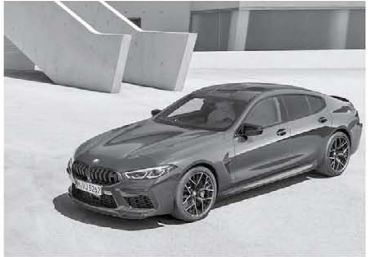
ديبى - عرب جي تي

من بي ام دبليو الفئة الثامنة جران كوبيه حصلت على شات رياضية تتضمن شباك أمامي أسود اللون وتفتح ليوفر فتحات تهوية تعمل على تبريد القلب النابض، وللاحتياط وجود فتحات تهوية أمامية أكبر حجماً مع شبك أسود اللون وهناك شبات من أجزاء الكربون فايبر، وحصلت السيارة على سقف من البلاستيك القوي بالكربون فايبر، وزودت بجنوط خفيفة الوزن قياس 2٠ إنش، ومن الخلف زودت بـ 4 مخارج للعدام وجناح صغير إمامي لتبدو سيارة BMW M8 جران كوبيه هجومية أكثر، والواصفات الإيكازية لـ سيارة بي ام