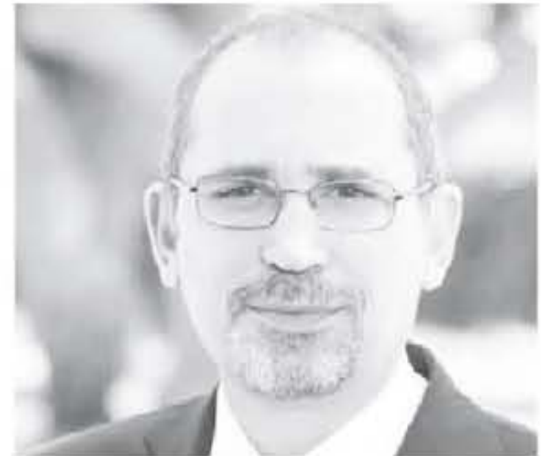
القاهرة - يثرا

وقدمت أمثلة الجمان وأدركنا على حمله، وزاد الصفدي بذلك، لثقل، مصاحفنا، ويستوجب أمنا الوطني أن جعل من التوصل لحل سياسي للأزمة بداهة السوريين، ويحفظ وحدة سوريا وشعبها، ووجهه لها أمنا واستقرارها وأولوية يجب أن تكون خطوات عملية لتحقيتها فوراً. وقال الصفدي بأجندة الدولهنا لتفعيل الدور العربي الجماعي في جهود التوصل لحل سياسي وتنهي هذه المسألة التي يفتي الشعب السوري التفريق صحبتها الأولى التي شكك ثنائيتها الكثيرة، خربا وعمارا وموتنا وتشرينا للأبرياء والشهداء للإرهاب في منطقتنا والعالم، لتستعيد سوريا أمنا واستقرارها، ويعود لها أبنائها الذين تشرذموا وتشتروا سوريا دولة الأساس في منظومة العمل العربي المشترك. وشدد الصفدي على أن التوافق على تشكيل الجنة الدستورية بشكل مخطوطة مهمة على طريق