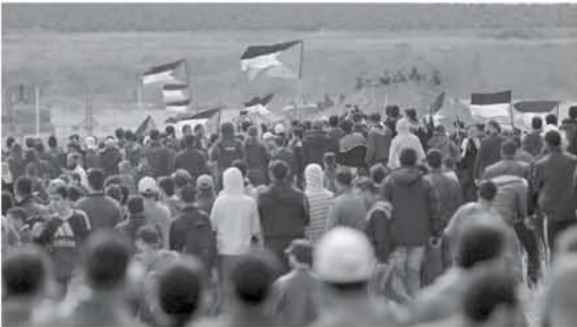
غزة - وكالات

أصيب عدد من المواطنين بالرصاصة العاطفي والاختناق بالغاز السيل للمدوع، جراء اعتماد قوات الاحتلال الإسرائيلي على المتظاهرين السلميين في مخيمات العودة شرقي محافظات قطاع غزة. وأفاد مراسل وكالة «صفا» بإصابة ثلاثة مواطنين بالرصاصة العاطفي، أحدهم بالرأس، وآخرين بالاختناق بالغاز السيل للمدوع الذي أطلقه جنود الاحتلال على المتظاهرين السلميين بمخيم العودة شرقي خراطة شرقي خان يونس جنوب القطاع. كما أفاد مراسل «صفا» بمخيم العودة شرقي مدينة غزة بإصابة 4 مواطنين (الذين بالرصاصة الحية، واثنين بالرصاصة العاطفي) في اعتماد قوات الاحتلال على المتظاهرين. أما في مخيم العودة شرقي جباليا شمالي القطاع، فأفاد مراسل «صفا» بإصابة مواطنين بالرصاصة العاطفي، وتوافد آلاف المواطنين عسرامس الجمعة إلى مخيمات العودة الخمسة شرقي محافظات قطاع غزة، استجابة لدعوة الهيئة الوطنية العليا لسيارات العودة للمشاركة في الجمعة الـ ٧٨ من المسيرات، والتي تحمل اسم جمعة «لا للتطبيع». والتقطت مسيرات العودة وكسر الحصار في 30 مارس/آذار 2018 للمطالبة بعودة اللاجئين إلى فلسطين المحتلة، وكسر الحصار المتواصل على قطاع غزة منذ 13 سنة. وأضرت اعتماد قوات الاحتلال على المتظاهرين السلميين عن استهداف 314 مواطناً، بينهم نساء وأطفال، وإصابة أكثر من ١٨ ألفاً بجراح متفاوتة، وفق ما أعلنت وزارة الصحة الفلسطينية. واقترحت عشرات المستوطنين وسط بلدة السموع جنوب محافظة الخليل جنوب الضفة الغربية، وأثروا شعارات تدعو في موقع أري وسط البلدة، وأفادت مصادر محلية بالفتحام عند أليات عسكرية إسرائيلية أحياء بلدة