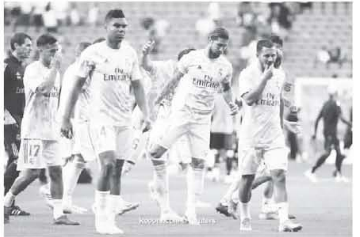
كوبيلا / إنديا / إنديا