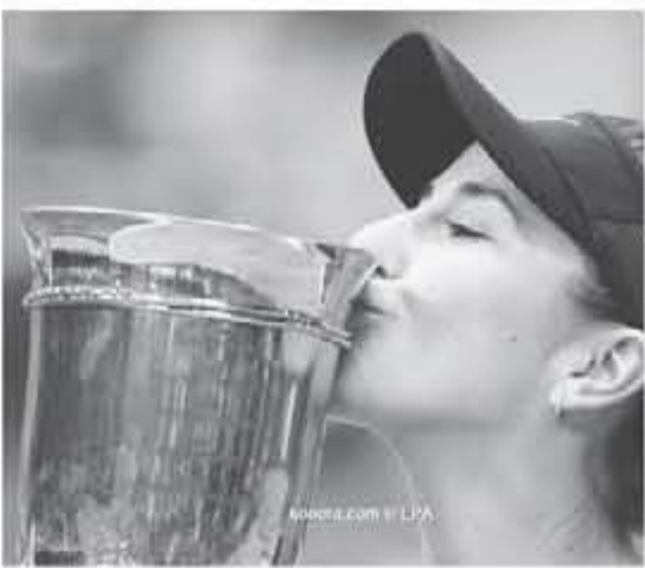
روسيا - وكالات