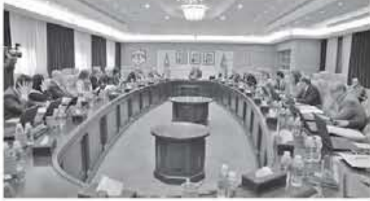
فتمتبر رخصتها لمغلق ويأتي القرار نظراً لأهمية هذا القطاع

يشار إلى أن المادة 9 من نظام ترخيص مؤسسات النشر والإعلان لسنة 2017 تنص على "تجديد الرخصة سنوياً وتلغى بعد مرور 3 أشهر من تاريخ انتهائها دون تجديد"، في حين تنطبق المادة 3/ أ/ ب من نظام رسوم وبدل ترخيص المطابع وور النشر وور التوزيع وور النشر والتوزيع والكتابة والدراسات والبحوث وور الترجمة وور قياس الرأي العام ومكاتب الدعاية والإعلان والمطبوعات اليومية لسنة 2017 بتحديد قيمة التبايع التي يتم استيفاؤها عند تقديم طلب الحصول على ترخيص وعند إصدار الترخيص.