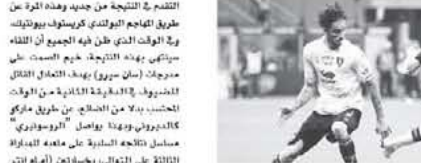
ميلان - وكالات