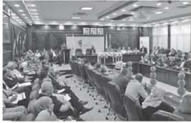
مفوضي الهيئة مع شرائح مختلفة في عدد من محافظات المملكة. وأشار الشبول إلى أن عدد الناخبين الذين يحق لهم الانتخاب بنسب القانون وتعديل سن الناخب سيصل إلى أربعة ملايين و ٢٥٠ ألف ناخب وناخبة بزيادة

قال عضو مجلس مفوضي الهيئة المستقلة للانتخاب فيصل الشبول إن الهيئة تهيء لإعداد ٦٠ ألف شخص لتثقيف الجوانب الاجرائية والفنية والترغيبية والسائدة لتعمل مراحل العملية الانتخابية و١١ ألف متطوع. وأضاف خلال لقاء حوارى يعملي هيئات المجتمع المدني في محافظة اربد إن المجلس يواصل لقاءاته مع مختلف الشرائح للوقوف على ملاحظاتهم حول الجوانب الاجرائية في العملية الانتخابية التي هي من صلب عمل الهيئة. وكشف الشبول عن رصد حوالي ١٣ ملاحة تعمل بقانون الانتخاب والنتائج الانتخابي الممول به حالياً كانت حسية لقاءات وحوارات معاملة اجراها مجلس