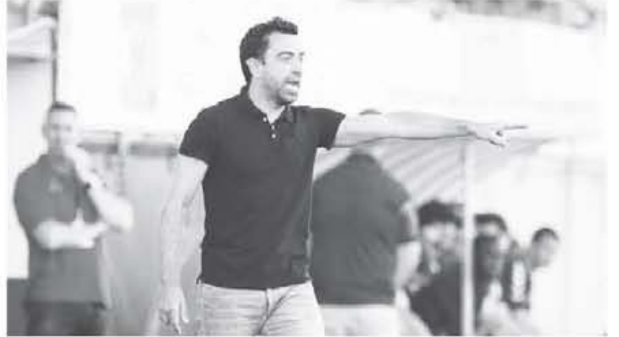
المدحج - وكالات

القتال في إياب قبل النهائي رغم المخلة أهم لاسبه بعدما دون نجاح، وبعد الكرهوم حسن، بسبب الإيقاف، وودع المسابقة بعد الخسارة (١-٠) في مجموع المباراتين، وقال تشافي الذي كان قائداً للسد قبل أن ينتقل إلى تدريبه بعد نهاية الموسم الماضي "كانت مباراة رائعة، وبمستوى الأداء الذي أظهرته الفريقين، ورغم أهمية المباراة قدم الفريقان مباراة ممتعة، وأضاف "أنا فخور بلاعبين فريقنا بعدما بدلو فساري جيهدهم، فسمنا أداء جيداً وامتلكنا مفعوفاً كبيراً ورغبة واضحة وسيطرنا على المباراة، وأضاف قائدا برشلونة السابق "تأثرنا بغياب اثنين من أهم لاعبي الفريق، وبدلنا فساري جيهدهم لتحقيق التفاضل، وتابع "لقد أثبتنا أننا نملك فريقاً كبيراً وحققتنا انتصاراً مهماً، يجب أن نتعلم من أخطائنا من أجل التطور، ويجب مواصلة العمل بجدية، وأند هو آخر ممثل عربي لآسيا عندما توج باللقب، في ٢٠١١، لكن تشافي يعتقد أن الهلال يملك فرصة كبيرة لحصد اللقب، عندما يواجه أوراوا في دياموند الياباني أو فوجنتشو إيفرجيراند الصيني.