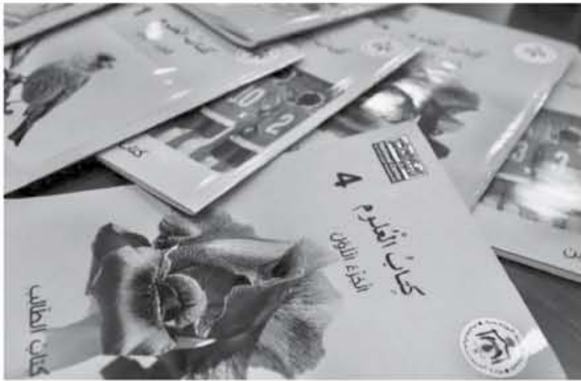
اللجنة على الميدان التربوي للعمل بها بعد اعتمادها وإقرارها بشكل نهائي.

وتتضمن اللجنة، تغيير من المتخصصين في الرياضيات والعلوم من إدارة المناهج في الوزارة، إضافة إلى عدد من الأكاديميين من الجامعات الأردنية والخبراء من خارج الوزارة، واوضح أن الوزارة ستعمم توصيات