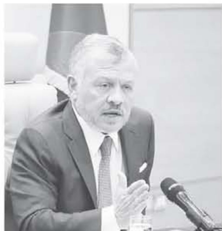
الجانب للاتقاء بمستوى التعليم والبيئة المدرسية، وكذلك النقل الرسمي.

التخفيف من ضلوع العيشة والظروف المالية الصعبة مع التأكيد على وضع معايير واضحة لرؤية الترتيبات والحوافز بالأمان. وذكر محور تشجيع الاستثمار وتحفيز الاستثمار، أكد الرزاز أن الحكومة ستطلق يوم الأحد المقبل حزمة من الحوافز للقطاع الخاص بهدف تحفيزه على تشغيل الشباب الأردنيين، وإحلال العالة الأثرية مكان الوافدة موضحاً أن هذه الحزمة تكلمن وشع أرة لعل شبابا المستثمرين العائقة، وكذلك الحوافز الموجهة لهم، وتوفير الحماية القانونية للمستثمرين في حالات الإسراف والحجز والتنقض، بالإضافة إلى إجراءات التحفيز سوق العقار والإسكان، وتسهيل حصول المواطنين على سكن ملائم. وأما محور تحسين جودة الخدمات المقدمة للمواطنين، أشار إلى أن الحكومة ستكثف جهودها في قطاع التعليم للوصول إلى الزامية التعليم المنكر (رياضة الأشغال) ابتداء من العام الدراسي المقبل ٢٠٢٠/٢٠٢١، بالإضافة إلى الاستثمار في تنفيذ الاستراتيجية الوطنية لعودة البشرية، التي شملت العديد من