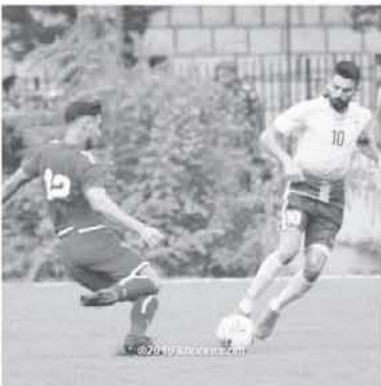
لبنان - وكالات

المظاهرات ونظرا لظروف الأوضاع المعقدة في البلاد، قررت لجنة التطوير في الاتحاد اللبناني لكرة القدم تعليق كافة البطولات والأنشطة، وذلك استنادا للأوضاع، وكانت الأخبار تشير من قبل اتحاد الكرة اللبناني إحداه هذه الخطوة، حيث أن أوضاعه معقدة منذ يوم الجمعة الماضي في ظل المظاهرات التي تشهدها شوارع بيروت.