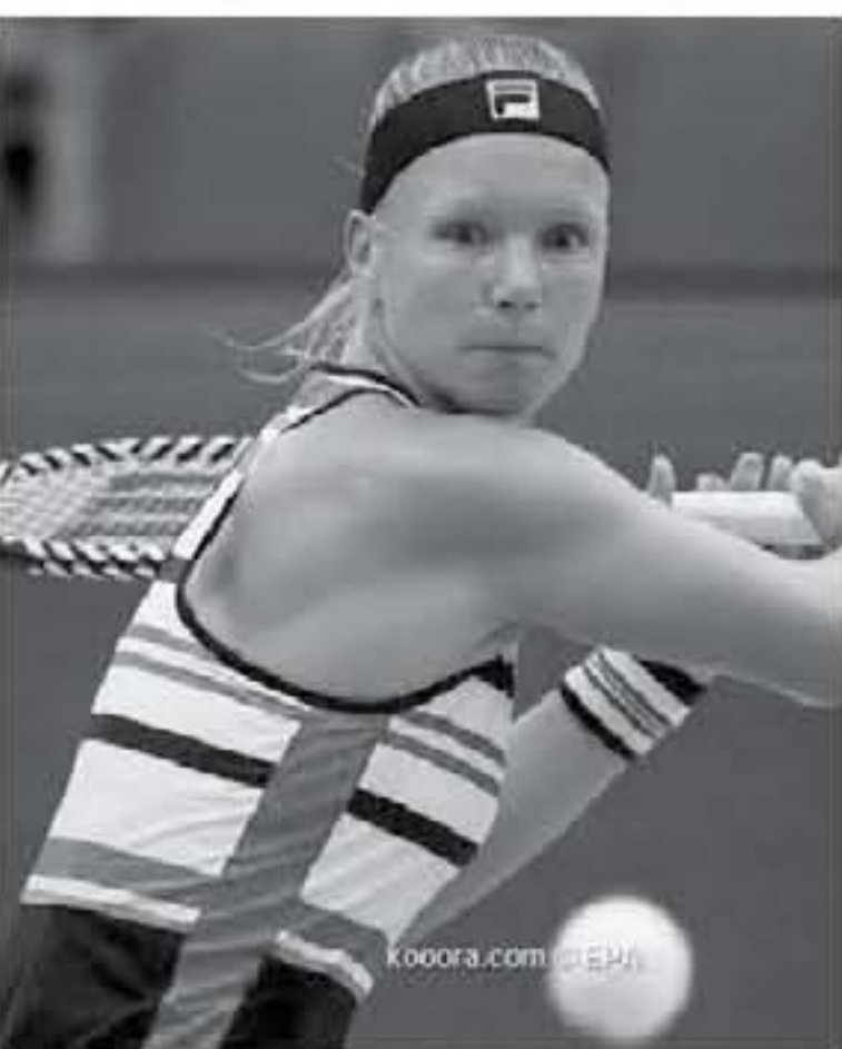
كين - وكالات

بورتون، المسلفة العاشرة عالميا، في الفوز على فريقين ١-٠ (٥-٧) و ١-٠ في لقاء استغرق نحو ساعتين، فيما أهدت سابلانكا، لستة ١١ عالية، مناهضتها اليونانية بواقع ٣-١ و ١-٠ و ٧-٠ دقيقة، وتعمل الأسترالية أصلي بارني اللقب من العام الماضي الذي فازت به على حساب الصينية كيانج وانج.