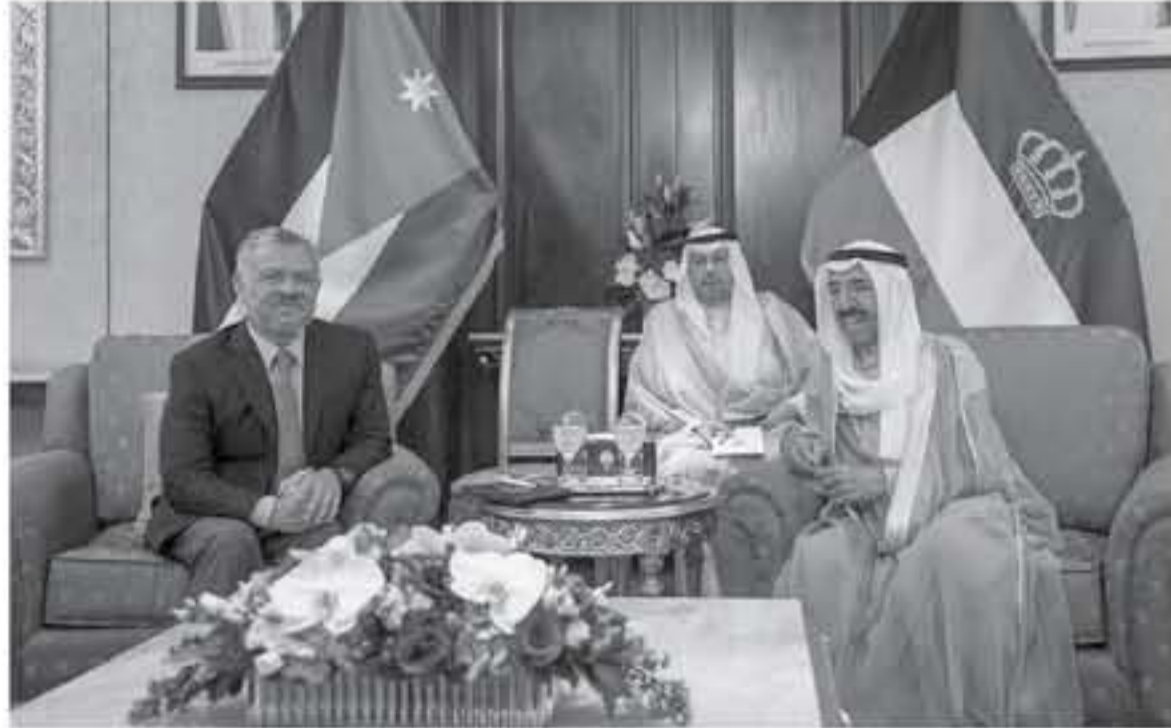
وللمشعب الكويتي الشفيق المزيد من والتقدم والازدهار. وعبر جلالته عن تقديره للدعم الذي تقدمه دولة الكويت الشقيقة، بقيادة سمو الشيخ صباح الأحمد الجابر الصباح، إلى الأردن والوقوف إلى جانبه

عقد جلالة الملك عبدالله الثاني، في الكويت امس، مباحثات مع أخيه سمو الشيخ صباح الأحمد الجابر الصباح، أمير دولة الكويت الشقيقة، ركزت على عمق العلاقات الأخوية بين البلدين، والتطورات الإقليمية. وأكد جلالته الملك والشهد وأسير دولة الكويت، خلال المباحثات التي حضرها سمو الشيخ نواف الأحمد الجابر الصباح، ولي العهد، استراتيجيا وبالعلاقات الأردنية الكويتية الراسخة، والحرص على تعزيز التعاون بينهما في شتى المجالات. وتم التأكيد على مواصلة التنسيق والتشاور بين البلدين إزاء مختلف القضايا ذات الاهتمام المشترك، بما يحقق مصالح البلدين والشعبين الشقيقين، ويخدم القضايا العربية والإسلامية. وأعرب جلالته الملك عن تهنياته لأخيه سمو الشيخ صباح الأحمد الجابر الصباح، بدوام الصحة والعافية،