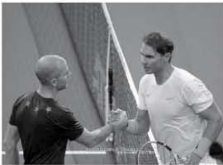
باريس - وكالات

عندما يلعب في مواجهة صعبة مع السويسري ستانيسلاس فافرينكا في الدور الثالث، بعد أن أفضح الأخير بالتهديف من مارين تشيبيتش بمجموعتين نظيفتين ٧-٦ (٣-٧) و٦-٧ (٥-٧). وستكون هذه هي المواجهة الثانية بين اللاعبين في هذه البطولة، حيث تعود الأولى للنسخة ٢٠٠٧ والتي حسمها الإسباني في نفس الدور بمجموعتين نظيفتين ٦-١ و٦-٢، بينما هي المواجهة ٢٢٢١ إجمالاً في مسيرتهما، علماً بأن نادال يتفوق باكتساح ١٨٥ انتصار مقابل ٣ فافرينكا.