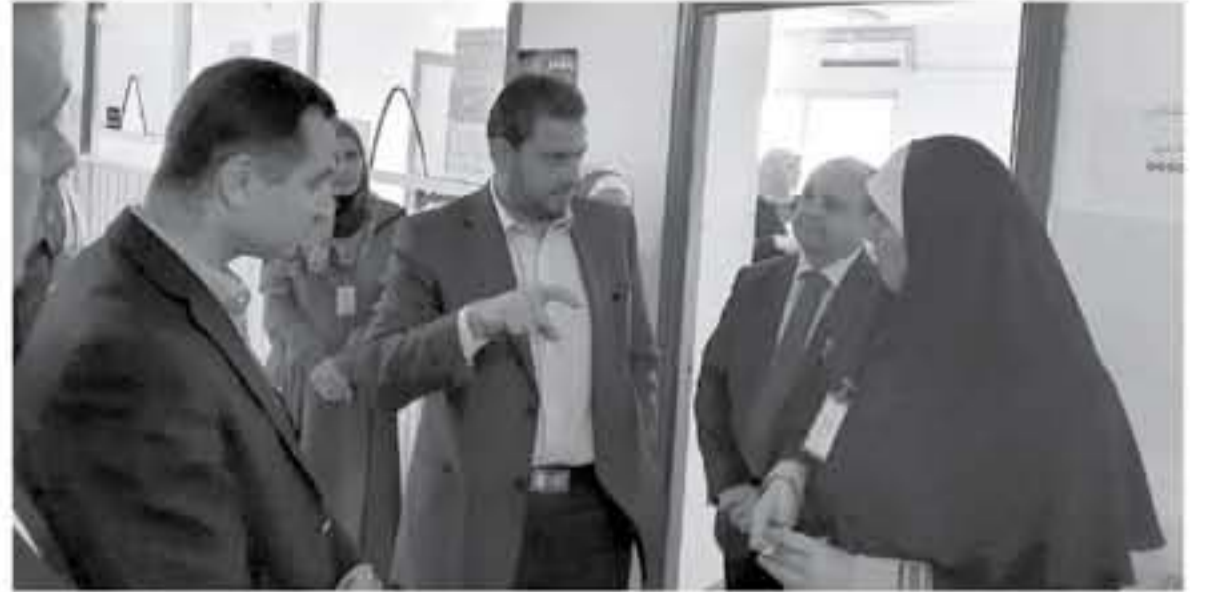
الانباط - السلط

قال وزير الصناعة والتجارة والتسويق الدكتور طارق العموري ان جلالة الملك وجه الحكومة في كتاب التكليف السياسي للحوار المستمر مع القطاع الخاص والعمل على دعمه وتميزه لتنافسيته.