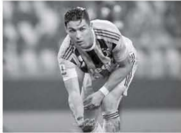
روما - وكالات

أشدد كريستيانو رونالدو يوفنتوس من المسقوط في فخ التصادم أمام ضيفه جنوى، في المباراة التي جمعتهما بأليانز ستاديوم بتورينو، ضمن لقاءات الجولة العاشرة من الدوري الإيطالي أحرز ليوناردو بولوتشي وكريستيانو رونالدو هدف يوفنتوس في الدقائق ٣٦ و٤٦، بينما سجل كريستيان كوامي هدف جنوى بالدقيقة ٤١، ويهدا الفوز، رفع يوفنتوس رسيداً إلى ٢٦ نقطة في صدارة الترتيب بفارق نقطة عن الإنتر، بينما يتجمد رصيد جنوى عند ٨ نقاط، بدأ يوفنتوس المباراة فعلياً من الدقيقة العاشرة بعدما حاول بيرناردينيكي التمدد من مسافة بعيدة، ليمددة كرة عند العارضة، ليورد بينامونتي مهاجم جنوى، بتسديدة خطيرة على مرمر البو، بعدما سد من داخل المنطقة كرة أرضية، وصلت لأضبان الحارس يوفون، ومن ركلة حرة بالدقيقة ٢٤، نُعدت خارج منطقة جزاء يوفنتوس، وقابها زابانا مدافع جنوى برأسية فوق العارضة، واستلم رونالدو الكرة في منتصف اللعب