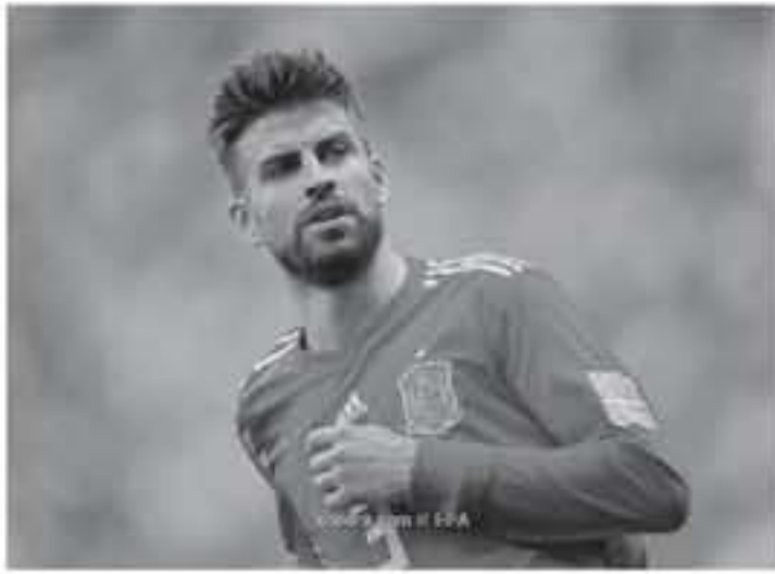
مدريد - وكالات

تعرف أبداً، كنت مضطراً لتخلي عن أي شيء في الحياة، وذلك في إشارة منه، إلى تحفيته لكل الأضباب الممكنة مع المنتخب الإسباني، بينما لم يشارك في الأولمبياد من قبل. ولم يرغب بيكيه في تأكيد أو إنكار، ما إذا كان قد تحدث بالفعل إلى راموس، حول هذا الاحتمال. وتوقف بيكيه عن اللعب مع المنتخب الإسباني، بعد كأس العالم ٢٠١٨، وتوج مدافع برشلونة مع "لاروخا" بلقب يورو ٢٠٠٨ و٢٠١٢، ولقب مولديبال ٢٠١٠.