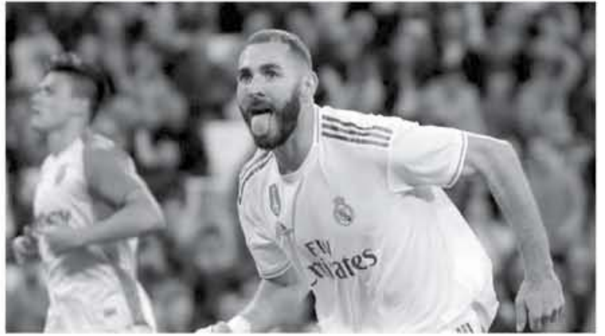
مدريد - وكالات

٢١ نقطة في وصافة جدول الترتيب خلف برشلونة بنقطة واحد بينما يتجمد رصيد ليجانيس عند ٥ نقاط في المركز الأخير. كثر ريال مدريد عن أضيائه ميكراً، حيث مرر كريم بنزيما كرة عرضية في منطقة الجزاء، استغلها البرازيلي روبرتو جويس وسجل الهدف الأول في الدقيقة ٧، وواصل الفرنسي بنزيما تألقه، ومرر كرة تونسي كروس، في سبيل موشابه لهدف الأول. ونجح الأثيني في مضاعفة النتيجة بالدقيقة ٢١، وكاد بنزيما أن يسجل الهدف الثالث للميرنجي، حيث انطلق بالكرة على الطرف