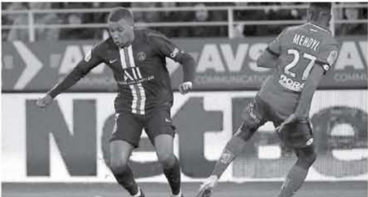
باريس - وكالات

ذكر تقرير صحفي فرنسي أن نادي برشلونة ينوي صرف النظر عن ضم كيليان مبابي نجم باريس سان جيرمان ويحسب موقع، Le sport، فإن برشلونة كان ضمن الأندية المهمة بالحصول على خدمات مبابي، لكن السعر المتوقع للصفقة، يشكل عائقا أمام الفريق الكتالوني، ومن المؤكد أن تكون قيمة انتقال مبابي أبعد بكثير مما يحتمل، له برشلونة، وبالتالي سيرك البارسا على مسار هجومي آخر أقل تكلفة، مثل لوانارو مارينيز مهاجم إنتر ميلان، والذي تقدر قيمته بنحو 100 مليون يورو، وعن المتوقع أن ينشر مبابي في الصيف المقبل، أزمات كبيرة للونارو المدير الرياضي لسان جيرمان، في ظل مستواه الاستثنائي مع الفريق الفرنسي وربحيته في الانتقال إلى مستوى أعلى من المنافسة، ويبدو ريال مدريد مصمما بشكل كبير على الفوز بخدمات كيليان