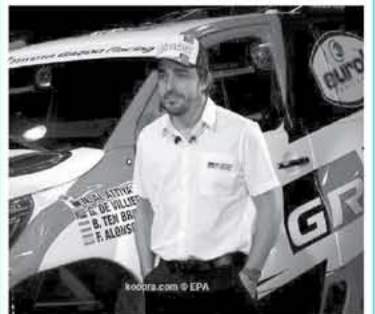
الرياض - وكالات

يشارك المسافر الإسباني فرناندو الونسو في رالي العلاء نيوم، بالجولة الثالثة من بطولة السعودية للرايات في الفترة بين الخامس والتاسع من نوفمبر/ تشرين ثان الجاري، وأكد تنظيم الرالي مشاركة الونسو، يمثل العالم في الشورمولو مرتين في 2005 و 2006، الذي يستعد بجانب مواطنه مارك كوما للمشاركة لأول مرة في رالي دكار الذي تقام نسخته المقبلة في السعودية، وتأتي مشاركة