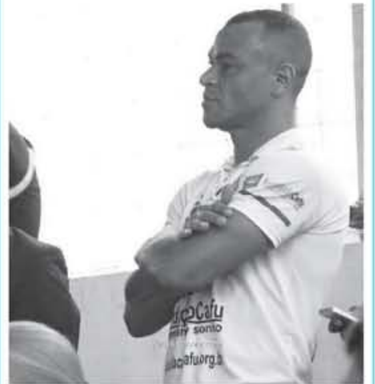
البرازيل - وكالات

تحدثت النجم البرازيلي السابق كافو لأول مرة، عن صدمته بعد وفاته ابنه الأكبر دانيو البالغ 30 عاما في سبتمبر/أيلول الماضي إثر سكتة قلبية أثناء لعبه مباراة كرة قدم مع والده. وفي مقابلة مع مجلة (هيجيا) البرازيلية قال كافو: "دفن الابن أمير يهوق كل ما تشعربه طوال حياتك، وأضاف: "أضف كل خمسة أيام لزيارة قبره، لم أستطع حتى الآن دخول غرفته، ابني وينجتون تبرع بأعضائه، لم أذهب مجددا للملعب الذي حدثت فيه الواقعة، وتابع "لا أصر كيف يمكنني وصف شعور دفن الابن وعمره أنه لا يمكنه أن يعود مجددا، وفاته الابن تظل مع