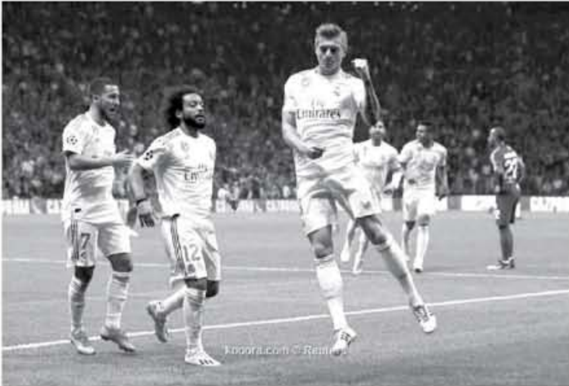
Kosora.com © Reuters