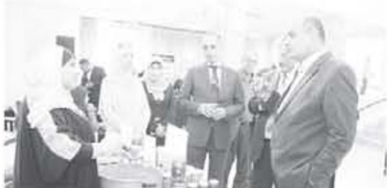
الانباط - السلط

جمعيات خيرية وسيدات من المجتمع المحلي في محافظة البلقاء نظمت عرض لتنتجات الزيتون من زيتون الكبيس وزيت الزيتون البلدي، إضافة إلى منتجات وصناعات غذائية بيئية من (زعترا وصل ومخللات والخبز البلدي وغيرها) ذات قيمة غذائية عالية وأبعاد صحية.