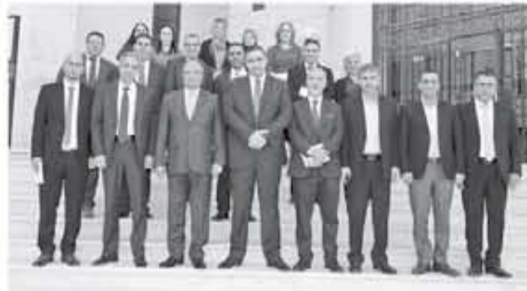
التشيين التفتيحين. وأشار الى ان التعامل مع الشكاوى المقدمة للهيئة يخضع لإجراءات محددة يقوم عليها متخصصون في الهيئة، مؤكدا أهمية تبادل

الخبيرات والمعرفة بما ينمكس ايجابياً على عمل هيئة النزاهة في التبدلين الشفيعين. وأوضح ان مديرية الشكاوى في الهيئة تمارس عملها من خلال عدة اقسام تتولى استقبال الشكاوى وجمع المعلومات حولها والتحقيق فيها ومن ثم إحالتها الى مجلس الهيئة وهو صاحب السلطة باتخاذ القرار المناسب حولها ومن ثم يقوم المجلس بحفظ الشكاوى اذا كانت لا ترقى الى شبة فساد او كانت شكوى كيدية، او إحالتها الى الجهات المختصة اذا ثبتت صحتها. وتجول الوفد الفلسطيني الذي تستمر زيارته عدة أيام في مديريات واقسام الهيئة وانطلق على أنبات منها وبرامجها والتخلف التي لتندعا، والادوار النوعية والوقائية والرقابية التي تقوم بها لمنع وقوع جرائم الفساد.