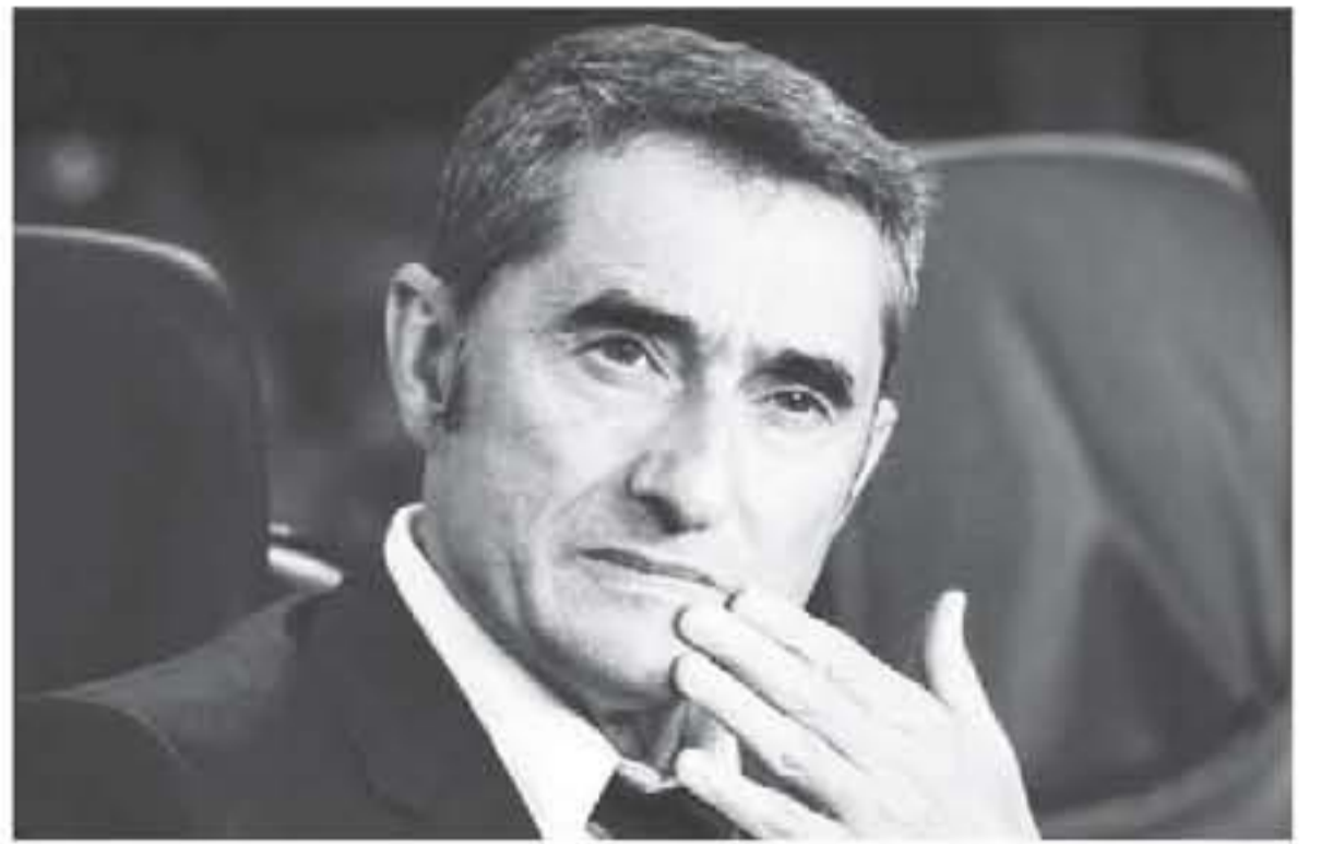
برشلونة - وكالات

برشلونة، جويليرمو أمور، الجدل حول حفيظة تفكير إدارة النادي الكتالوني في إقالة المدرب إرنستو فالفيدي. وهان