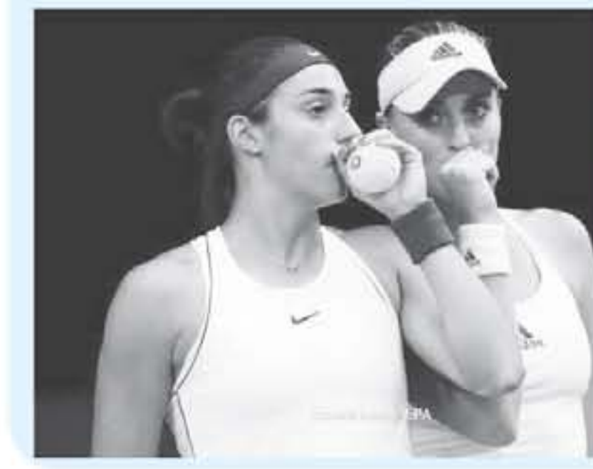
سيدني - وكالات

حفظت فرنسا لقبها الأول في كأس الاتحاد للنس لفرق السيدات خلال 16 عامًا، امس الأحد، بفوزها بثلاثة (3-2) على أستراليا صاحبة الحيافة، بعد أن حصدت مواجهة التوسى نهائي البطولة في بيروت وصعدت كريستينا ملاءيتوفيتش وكارولين جارسيا في مواجهة شروسه أمام أنسلي بارتي وبمساندا ستوسر ليتحقق الانتصار بنتيجة (3-2) في بيروت أريتا وضمت فرنسا لقبها الثالث في البطولة، وتوجت فرنسا باللقب لأول مرة منذ 2003 حين قادتها إيملي موريسو للفوز 1-0 على أمريكا في النهائي في موسكو.