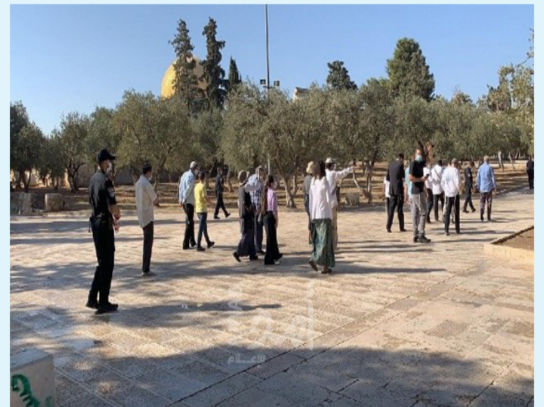
وقاموا بإشغال شموع الشمعدان الإسرائيلي على أبواب المسجد خلال الاحتفالات بالعيد الإسرائيلي «الحنوكاه» وحذر المرصد في تقريره السنوي، من خطر المشاريع التهويدية والحفريات التي تنفذها

أصدر مرصد الأزهر لمكافحة التطرف، تقريره السنوي حول الاقتحامات الإسرائيلية التي تعرض لها ساحات المسجد الأقصى وذكر المرصد «إن ١٨٥٤٤٨ إسرائيليًا قد اقتحموا ساحات الأقصى خلال عام ٢٠٢٠، تحت حراسة أمنية مشددة من قبل الشرطة الإسرائيلية» وشدد المرصد في تقريره على أن عام ٢٠٢٠ شهد سوابق تاريخية من قبل المستوطنين المتطرفين المدعومين من المنظمات الإسرائيلية وحكومة الكيان الغاصب، مما جعل هذا العام من أخطر الأعوام مرورًا على المسجد الأقصى تحت وطأة الاحتلال وبين أن من أبرز تلك السوابق اقتحام ساحات الحرم الشريف خلال يوم «عرفة» بالتزامن مع الذكرى الإسرائيلية التي يطلقون عليها «خرب الهيكال» إذ اقتحم المسجد ٩٧٨ مستوطنًا، في استفزاز صارخ لشاعر المسلمين في شتى بقاع الأرض، ودون أي اعتبار لتدابير مثل هذه الاستنزافات