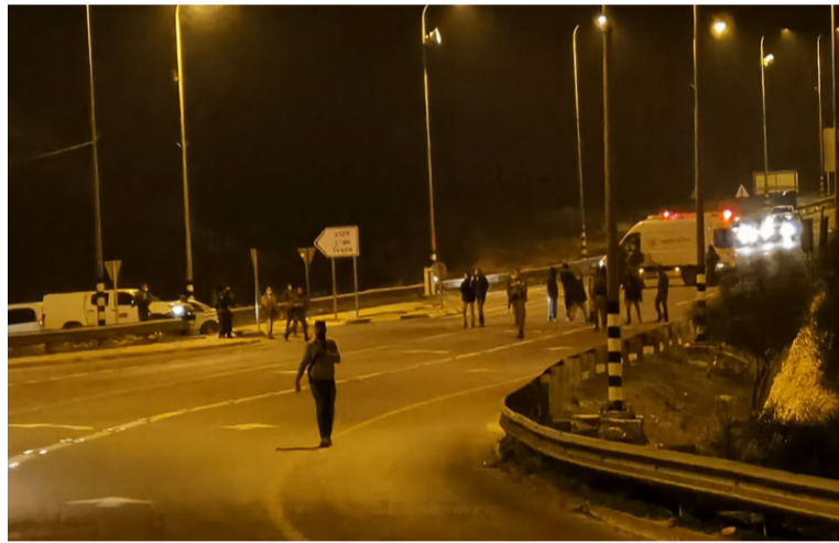
في أماكن متفرقة بالقدس الغربية، مساء الخميس وأضواء البيان، أن قوات الشرطة تحركت ضد أعمال الشغب العنيفة، حيث تم رشق ضباط الشرطة بالحجارة والبيض واعتدوا عليهم في عدة حالات وأردف: مما أدى إلى إلقاء أضراس بعدة سيارات للشرطة ومركبات مدنية وحافلات

أظهر مقطع مصور نشرته وسائل إعلام إسرائيلية، الجمعة، نجاته مواطن فلسطيني بأعجوبة من اعتداء متطرفين إسرائيليين بالقدس الغربية وأوضح المقطع المصور، المتطرفين وهم يهاجمون فلسطينيا (لم تعرف هويته)، وهو عائد بسيارته إلى منزله وألقى اليه يمينيون المشددون الحجارة وأدوات حادة على سيارة الفلسطيني، وفتحوا بابها وهم يهتفون هجموا، أمسكوه، ألقوا الحجارة ونجح الفلسطيني (من سكان القدس الشرقية) بالفرار بسيارته من المكان، ولم يتضح إن كان قد أصيب بجروح نتيجة الاعتداء لكن الشرطة الإسرائيلية، قالت في بيان الجمعة، إن متطرفين نظمو احتجاجات