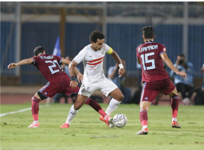
مدير - وكالات

كانون ثان بمدينة قرطبة، وحال فاز الفريق الكتالوني، سيخوض النهائي في مالاجا يوم ١٧ من نفس الشهر أمام ريال مدريد أو أتلتيك بلباو. وبعد كأس السوبر، سيبدأ برشلونة طريقه في بطولة كأس ملك إسبانيا، ومن المرجح أن يكون ذلك في ٢٠ يناير/كانون ثان (لم يتم تأكيد التاريخ بعد)، ضد منافس مستحده القرعة. وفي يومي ٢٤ و ٣١ يناير/كانون ثان، سيخوض برشلونة مباراتين في الدوري، الأولى على ملعب إلتشي والثانية أمام أتلتيك بلباو في كامب نو، كل هذا قبل شهر فبراير/ شباط الذي سيواجهه في البلاوجرانا موعدا مهما في دور ال١٦ من دوري أبطال أوروبا أمام باريس سان جيرمان.