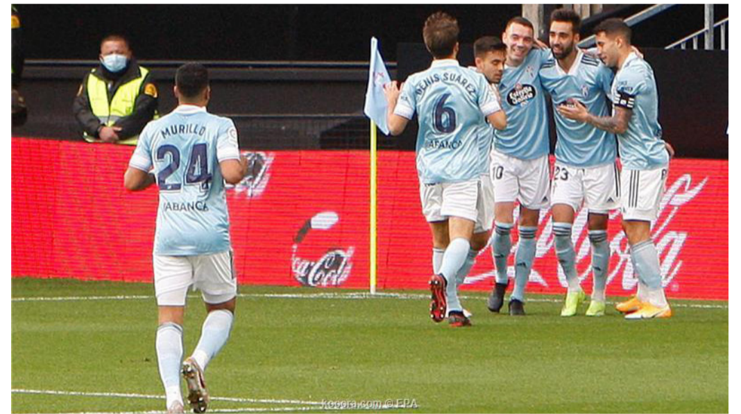
مدير - وكالات

بشكل سيء، ما كلف المدرب أوسكار جارسيا منصبه، يعيش سيلتا فيجو فترة تألق مذهلة تحت قيادة المدرب الأرجنتيني إدواردو كوديت. وفي أول مهمة له في أوروبا بعد فترات ناجحة في الأرجنتين والبرازيل، حول كوديت سيلتا من أسوأ فريق في الدوري ومرشح أكيد للهبوط، للتنافس على المراكز الأربعة الأولى. وخلال مباريات كوديت ال ٦ مع الفريق سجل المهاجم إياجو أساس هدفاً على الأقل أو صنع مثله، وقال إن مفتاح تألق الفريق هو نهج المدرب القائم على الضغط وتسليح خط الوسط بلاعبين يملكون "مهارة التمير" خلفه (أساس). وسيجده سيلتا إلى العاصمة الإسبانية وهو في المركز الثامن برصيد ٢٣ نقطة، متأخراً بفارق ٣ نقاط فقط عن إشبيلية صاحب المركز الرابع. وفي المقابل يحتل ريال مدريد المركز الثاني متأخراً بفارق نقطتين عن جاره أتلتيكو مدريد المتصدر، وذلك بعد تعادل محيط خارج الديار مع إلتشي ما دفع الحارس تيبو كورتوا لإلقاء اللوم على الحكم، بينما انتقد المدرب زين الدين زيدان الأسلوب الخططي السلبي لفريق إلتشي. وقد يعود إيدن هازارد للتشكيلة الأساسية لأول مرة، منذ أكثر من شهر عقب مشاركته كبديل أمام إلتشي. وفي مباريات أخرى، سيوزر أتلتيكو فريق الأفييس سعياً لتعزيز صدارته، بينما يزور برشلونة، الذي تعادل ١-١ على أرضه مع إيبار يوم الثلاثاء الماضي، ويسكا متذلل الترتيب.