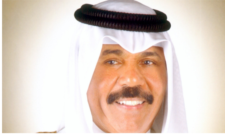
كما أعرب أمير الكويت عن ارتياحه لنتائج الجولة التي قام بها وزير الخارجية الكويتي لدول الخليج قبل أيام من انعقاد القمة الخليجية

أعرب أمير الكويت الشيخ نواف الأحمد الجابر الصباح، عن تفاؤله إزاء اللقاء الذي سيجمعه بقيادة دول مجلس التعاون الخليجي خلال القمة الخليجية المرتقبة بمدينة العلا بالملكة العربية السعودية في الخامس من يناير الجاري، بما يهدف إلى تعزيز التضامن العربي والخليجي لمواجهة التحديات التي تشهدها المنطقة جاء ذلك خلال اجتماع أمير الكويت، ظهر اليوم، مع وزير الخارجية الكويتي الشيخ أحمد ناصر المحمد الصباح، في قصر مياينة، وذلك للاطلاع على نتائج الجولة التي قام بها لعدد من دول مجلس التعاون حاملة رسائل خطية من أمير البلاد.