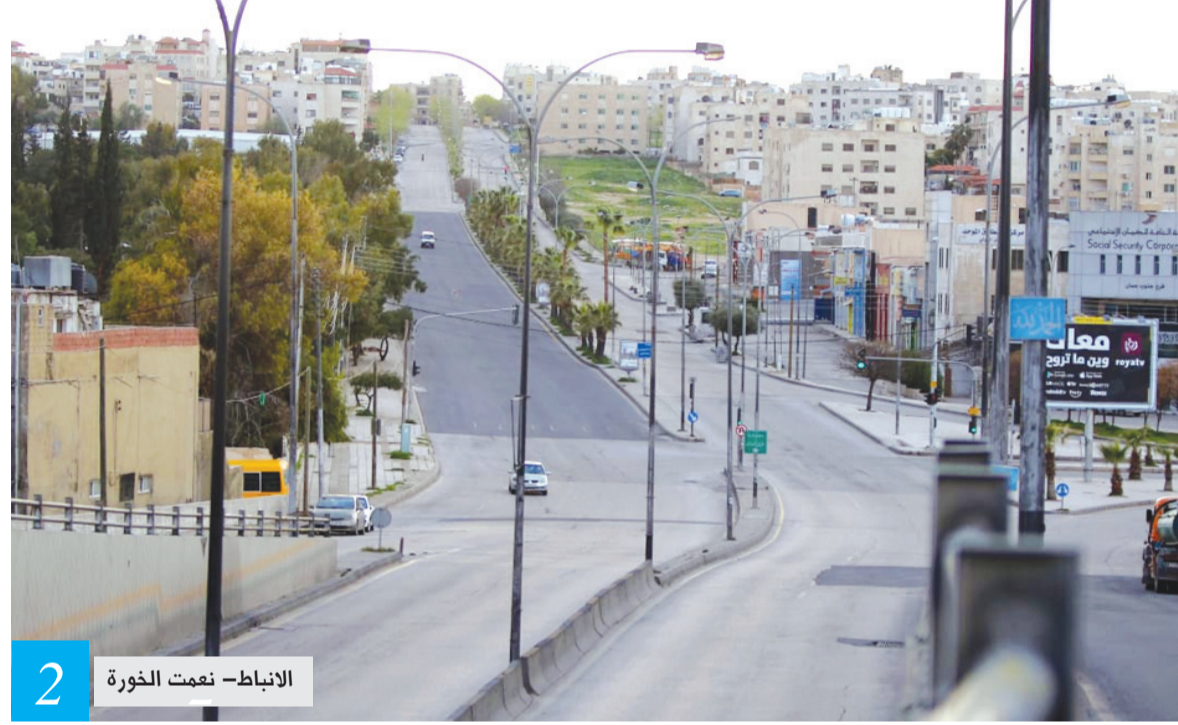
الانباط- نعمت الخورة 2