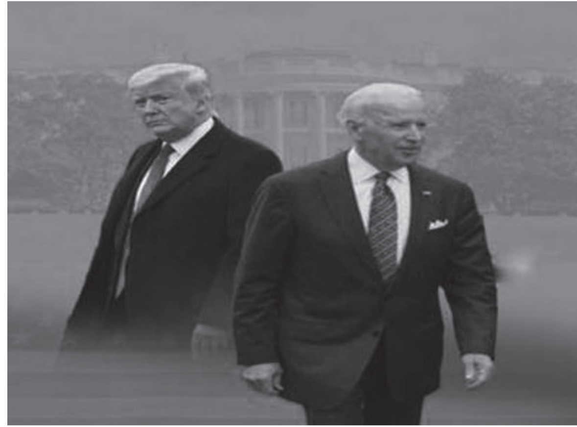
اللاجئين الفلسطينيين ويبدو ان هذا القرار ضمن حزمة

بدأت الادارة الامريكية الجديدة وبتوجيهات مباشرة من الرئيس جو بايدن باتخاذ ترتيبات خاصة لالغاء قرار الادارة الامريكية السابقة برئاسة دونالد ترامب بخصوص الانسحاب من الدعم المالي لوكالة غوث وتشغيل اللاجئين الفلسطينيين الاونروا وطلب من فريق قانوني خاص يعمل في مكتب الامم المتحدة ونيويورك وطاقتهم اخر من القانونيين في وزارة الخارجية وضع الاوراق اللازمة لإعادة الاعلان عن التزام الولايات المتحدة مجددا بتقديم مساهماتها المالية ووكالة الاونروا وطلب من فريق قانوني خاص يعمل في مكتب الامم المتحدة ونيويورك وطاقتهم اخر من القانونيين في وزارة الخارجية وضع الاوراق اللازمة لإعادة الاعلان عن التزام الولايات المتحدة مجددا بتقديم مساهماتها المالية ووكالة الاونروا وتؤكد مصادر خاصة لراي اليوم بان قرارا امريكيا مدعوما من جهة الرئيس بايدن سيصدر في غضون الايام القليلة المقبلة يعلن التراجع عن قطع المساهمة المالية الامريكية في الاونروا وبالتالي تترقب الاوساط الدبلوماسية في واشنطن صدور القرار الجديد والذي سيتضمن الالتزام مرة اخرى بتقديم المساعدات المالية في الحصة الامريكية المعتادة والسنوية لوكالة غوث وتشغيل