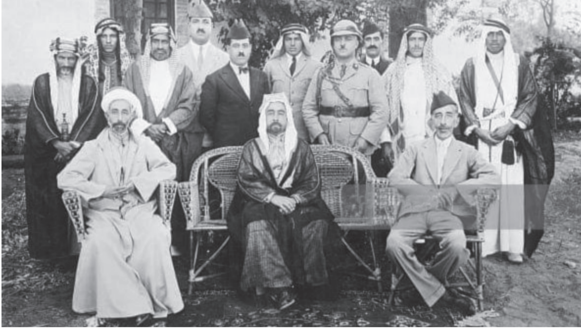
● العائلة المالكة «الشرفاء»