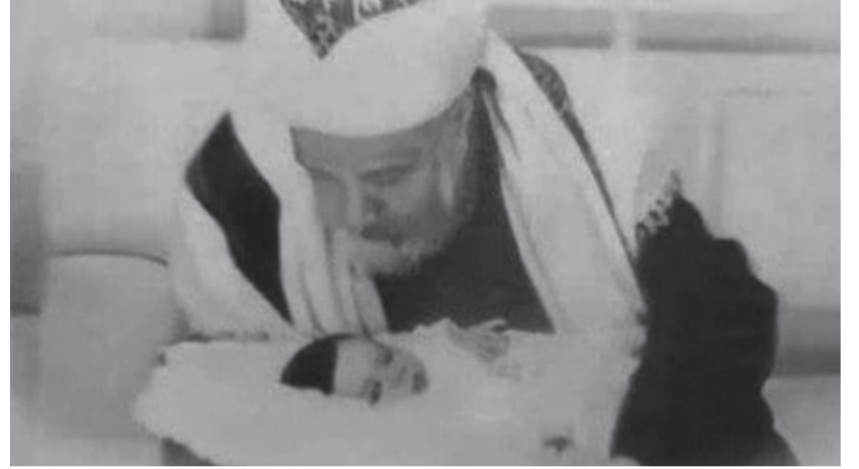
● الملك عبدالله الأول «الملك المؤسس»