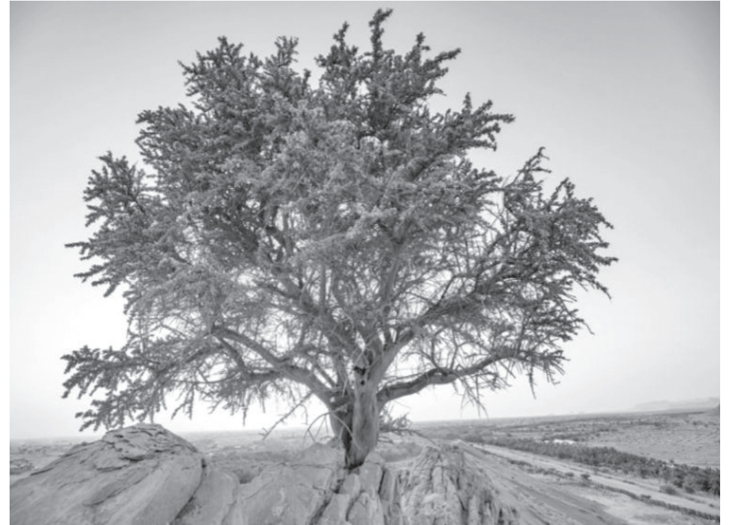
الانباط - سالي الصبيحات

واكد ان اعضاء نقابة المهندسين الزراعيين جاهزون لتنفيذ اي برنامج وانشطة خصوصاً ما يتعلق ببناء القدرات والتأهيل والتدريب لكوادر القطاع الزراعي.