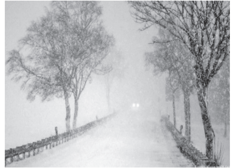
الانباط - سالي صبيحات

قال مدير المركز العربي للمناخ المهندس احمد العرييد، ان شهر شباط يعتبر الاكثر تقيلاً خلال فصل الشتاء، نظراً لان منظومة الضغوط الجوية في هذا الشهر تصبغ سريعة التغيير ومفاجئة . واضاف العرييد، ان القبة القطبية تكون