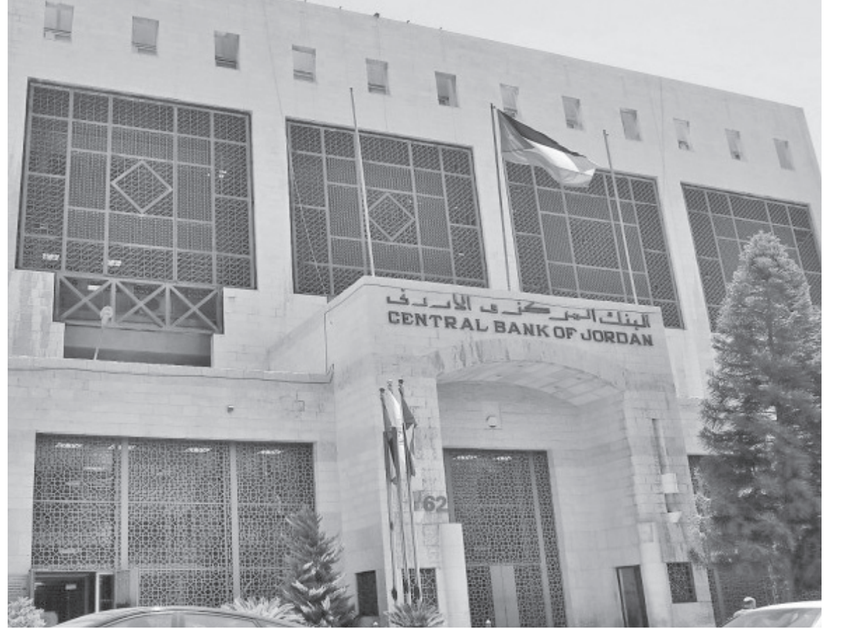
الأنباط - عمر الكعابنة

• العياصرة: خطوة تستحق عناية والبر: لن نعمل مع المركزي بشأنها