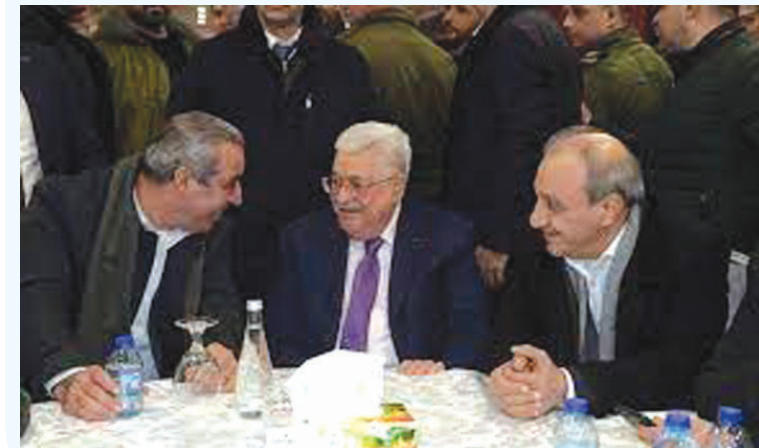
التفاصيل ص «٩»