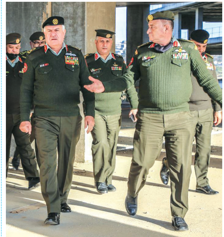
الأنباط - خليل النظامي

يعتقد البعض أن العقل والجهاز العسكري ل القوات المسلحة الأردنية «الجيش» يقتصر على توفير الحماية من الأخطار الخارجية وتأمين حدود الأردن من المتريصين بها فقط، فيما تعكس حقيقة الواقع التنموي أن «الجيش» أثبت وعلى مدار سنوات طويلة أنه المؤسسة الوحيدة التي لا يشوب فلسفة ومنهجية الاستراتيجية والخطط التي يصنعها وينفذها على أرض الواقع أية شوائب من كافة الشواحي خاصة الشواحي الفنية والإدارية والرقابية. ف بالرغم من الحمل الكبير الذي تحمله القوات المسلحة الأردنية على كاهلها ل تأمين حماية الوطن والمواطنين، لا ينفك العقل العسكري عن التفكير في واقع حال المواطنين من الناحية المعيشية والتنموية، والهموم والتحديات التي تعيق تطور وتحديث ومعالجة إختلالات الشأن المحلي على مختلف الصعد، من خلال المشاركة ب فاعلية كبيرة جدا في عملية التنمية والإصلاح الشاملة التي ينادي بها جلالة الملك عبدالله الثاني، وعلى سبيل المثال لا الحصر، قرأت مؤخرا في الأخبار أن رئيس هيئة الأركان المشتركة اللواء الركن يوسف الحنيطي قام ب زيارة خاصة ل مبنى مستشفى كان قد تم تأسيسه سابقا ولم يستكمل ظروف خاصة في منطقة ناعور يرافقه عددا من كبار ضباط القوات المسلحة، ب هدف الإطلاع على واقع المبنى