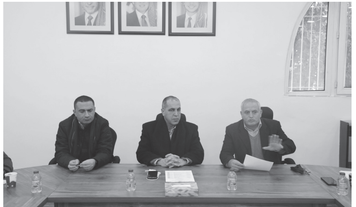
الانباط - البقعة

والمكافحة المتكاملة ومشروع مدارس المزارعين الحقلية، وهو احد مشاريع التنمية الاقتصادية الريفية والتشغيل (ريجيب2) الذي تنفذه المؤسسة الأردنية لتطوير المشاريع الاقتصادية (جيدكو)،