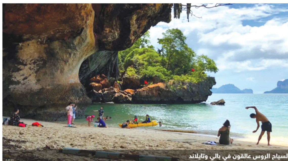
السياح الروس عالقون في بالي وتايلاند

وأوضح أن بنك "بوشتا" في البلاد يقدم بطاقة اقتراضية من خلال نظام "يونيون باي" الصيني، مضيفا: "إنها مجانية ويمكن للأشخاص فتحها أينما كانوا